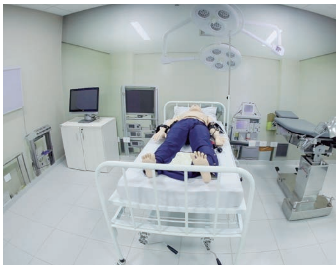
CENTRO de Simulação em Saúde: Tecnologia de ponta para ensino focado em conceitos humanistas