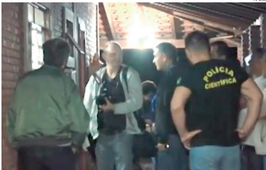
POLÍCIA fez levantamentos no local do crime em busca de vestígios que possam identificar o autor