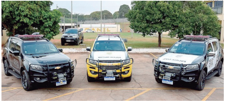
POLÍCIAS Civil e Militar receberam novas viaturas entregues pelo governo do Estado

Para o Comandante da PM, Coronel Letrinta, a vinda de novos veículos para o Batalhão melhora as condições de trabalho da equipe. “Isso proporciona