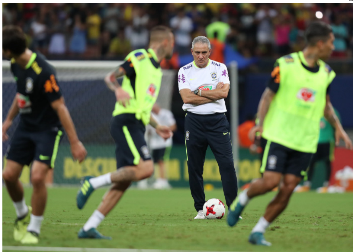
Técnico Tite confirmou quatro mudanças na seleção para o jogo de hoje