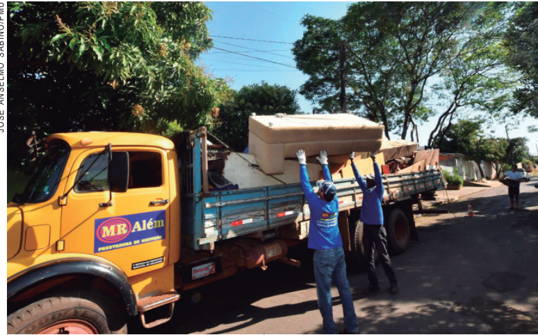
Somente no sábado três caminhões de móveis velhos, eletroeletrônicos e entulho foram recolhidos no Primeiro de Maio

Mas precisamos da adesão dos moradores, juntando o lixo de forma correta, separando os recicláveis e colocando o entulho na calçada apenas quanto o bota-fora estiver agendado", solicitou.