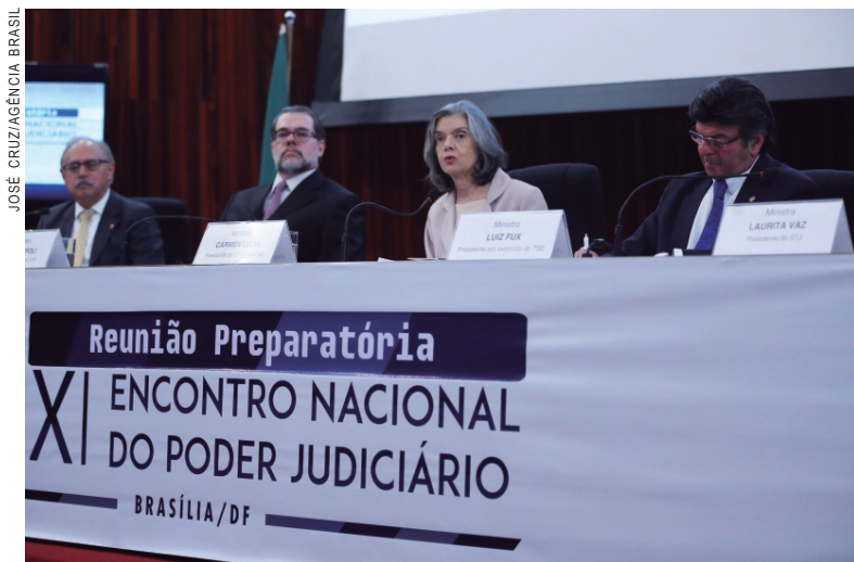
A presidente do CNJ e do STF, Cármen Lúcia, apresentou o anuário Justiça em Números