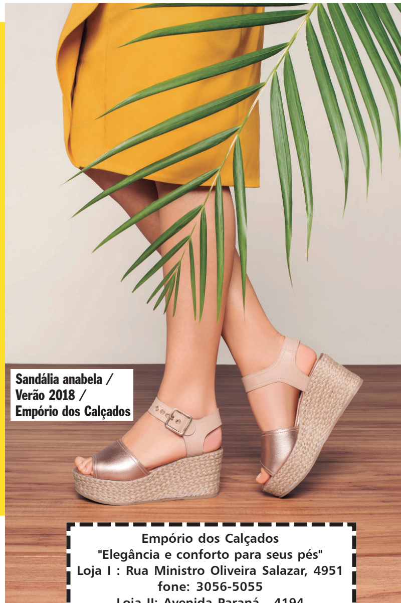
Sandália anabela / Verão 2018 / Empório dos Calçados

Ainda segundo o Mapa da Violência, o suicídio é predominante no sexo masculino, com exceção da Índia e China. O aumento das taxas no Brasil tem sido registrado em todas as faixas etárias, sendo a de idosos com o maior número: 8 mortes para cada 100 mil habitantes. De acordo com a Organização Mundial da Saúde, o Brasil é o 8º país com mais mortes por suicídio. Em 2012, foram registradas 11.821 mortes, sendo 9.198 homens e 2.623 mulheres.