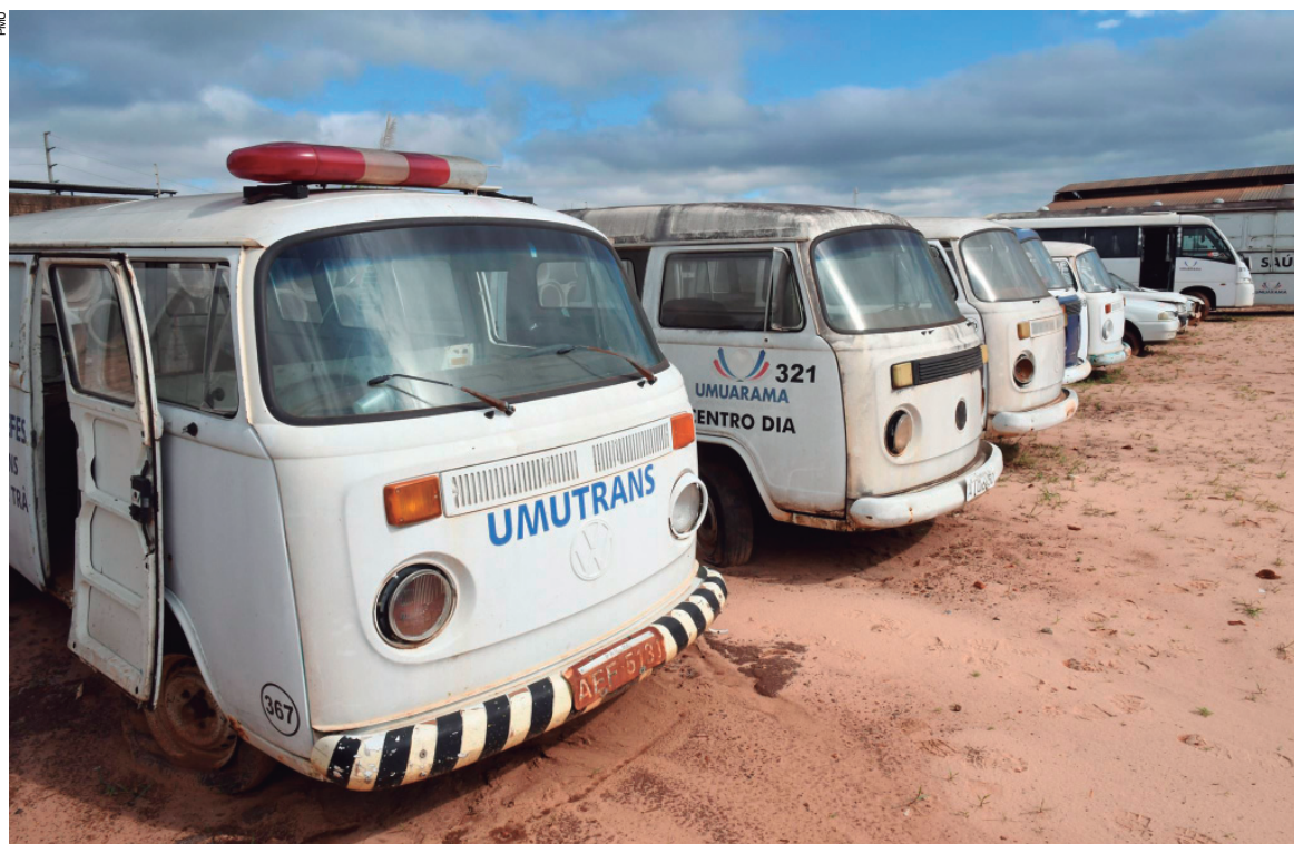
Estarão disponíveis caminhões, peruas Kombi, motoniveladoras, automóveis, ônibus e micro-ônibus, usina de asfalto e tratores, entre outros

Paço Municipal (Avenida Rio Branco, 3717 – Centro Cívico, Umuarama). Demais informações ou esclarecimentos pode-