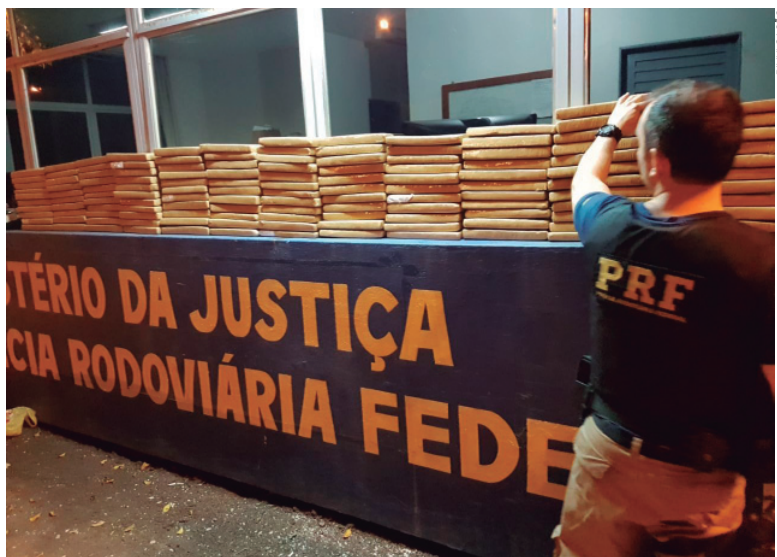
Os 90 kg foram apreendidos na madrugada da segunda-feira

A Polícia Rodoviária Federal apreendeu na madrugada de segunda-feira (04) na cidade de Alto Paraíso cerca de 90 kg de