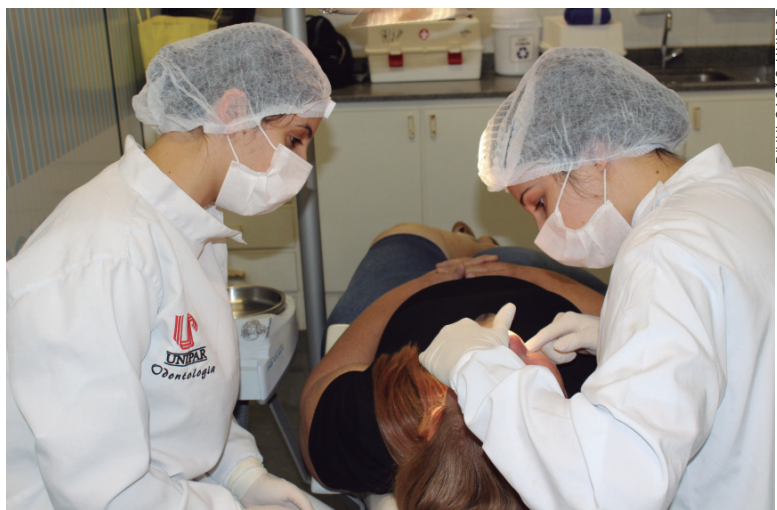
Tratamento é rápido e, nos últimos anos, vem beneficiando muitas pessoas de baixa renda

Há muitos anos, o curso de Odontologia da Universidade Paranaense – Unipar, Unidade de Umuarama, oferece tratamento para pessoas interessadas em reabilitação protética com prótese fixa ou removível (parcial ou total; esta, conhecida como dentadura).