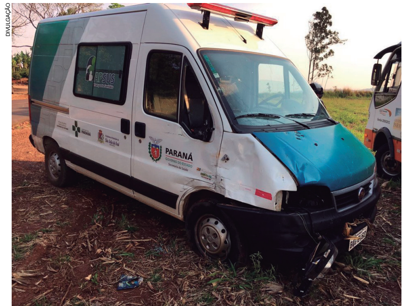
Ambulância foi abandonada pelo foragido após fugir

A ambulância foi abandonada e o foragido conseguiu fugir, porém foi encontrado logo depois no bairro Santa Terezinha onde foi morto.