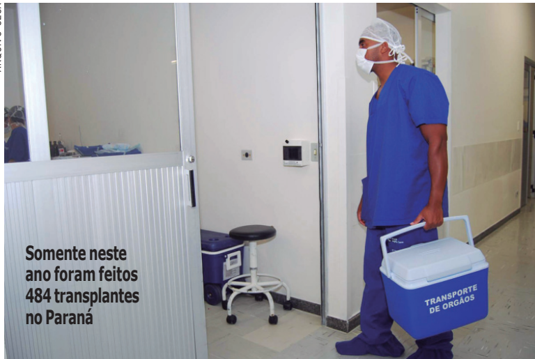
Somente neste ano foram feitos 484 transplantes no Paraná

que estimulem a doação de órgãos", destacou o secretário de estado da Saúde, Michele Caputo Neto. Segundo ele, o Governo do Estado tem trabalhado nestes últimos sete anos para melhorar cada vez mais os números do Sistema Estadual de Transplantes, o que colocou o Pa-