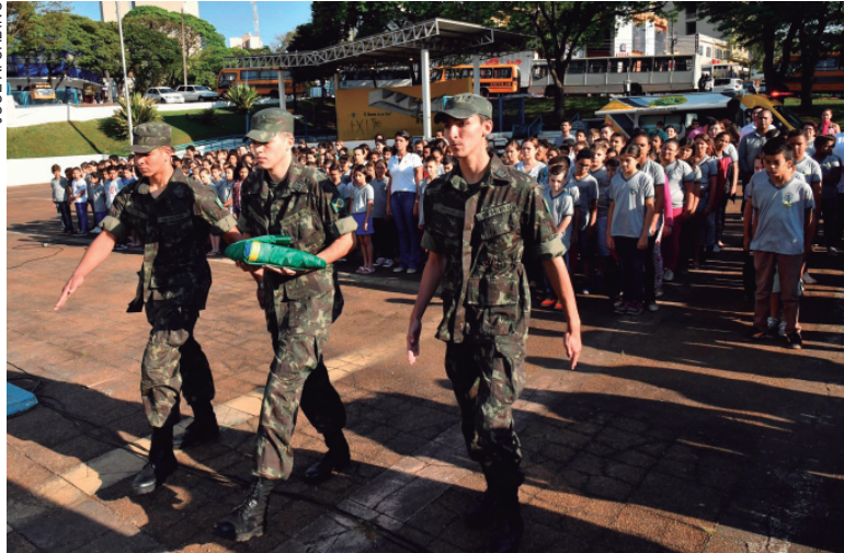
A bandeira nacional foi conduzida por atiradores do Tiro de Guerra, na abertura da Semana da Pátria

"Este momento nos faz lembrar a história da independência do Brasil e resgatar referências da Pátria, da construção da nossa nação, e a luta por um país pacífico, ordeiro e progressista, valorizando a diversidade e reforçando o verdadeiro sen-