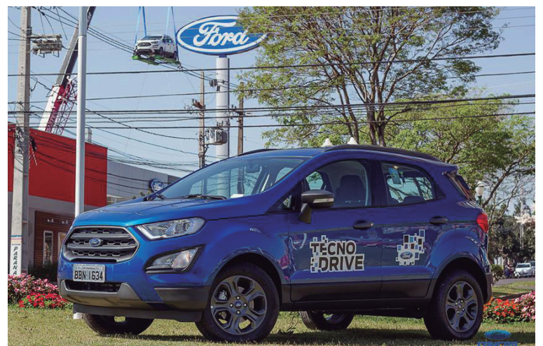
Na FANCAR, o novo EcoSport foi a estrela do lançamento