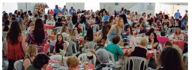
Toca do Leão "Jamil Helú", lotada, celebra o Chá das Domadoras.

Assim se resume o Chá das Domadoras, no último sábado, 26/08/2017, no Lions Clube de Umuarama. Companheiras e Domadoras comemoram o sucesso do evento.