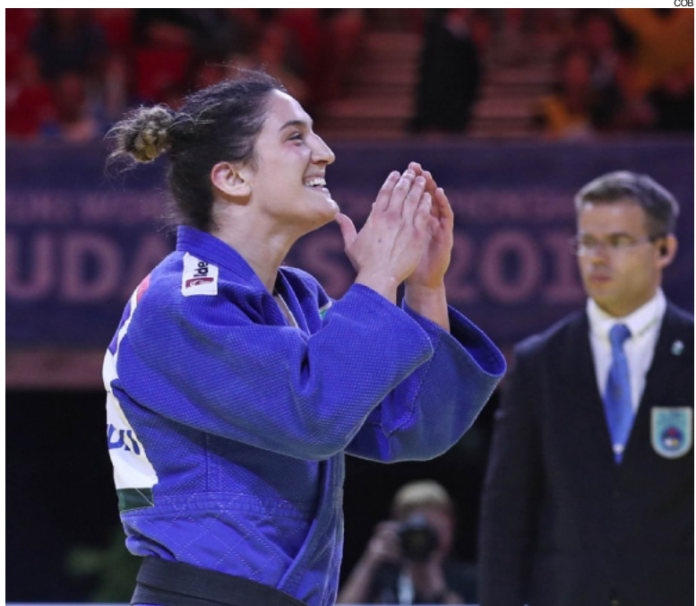
Mayra Aguiar é única brasileira bicampeã mundial e esporte olímpico individual

"Estou muito feliz! Eu estava muito focada, tinha me preparado muito. Sabia o quanto era importante e o quanto é gostoso ganhar o Mundial. E agora sou bicampeã", disse a judoca, ainda na zona mista após a final.