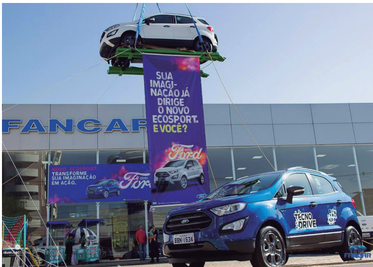
Novo Ford EcoSport no lançamento na Fancar

O novo Ford EcoSport 2018 foi apresentado no sábado (26) e já está disponível na Concessionária Ford Fancar de Umuarama. O utilitário esportivo compacto, o pioneiro neste segmento no país, possui como principais novidades dois novos motores: o 1.5 três cilindros e o 2.0 com injeção direta, ambos flex, nova transmissão automática, interior totalmente re-