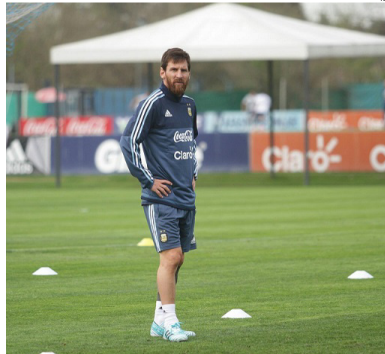
Camisa 10 Lionel Messi deve jogar mais próximo ao gol adversário

No Uruguai, Suárez é dúvida. Ele se apresentou machucado, mas que passou nos testes físicos. Sua presença é importante porque o técnico Oscar Tabárez já não conta com os atacantes Abel Hernández, Jonathan Urretaviscaya e Diego Rolán, lesionados.