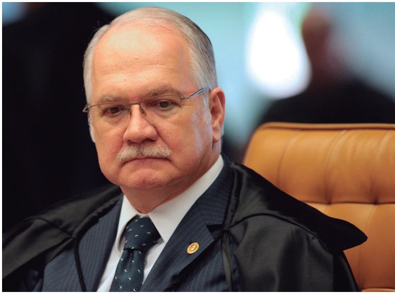
Ministro do STF, Edson Fachin