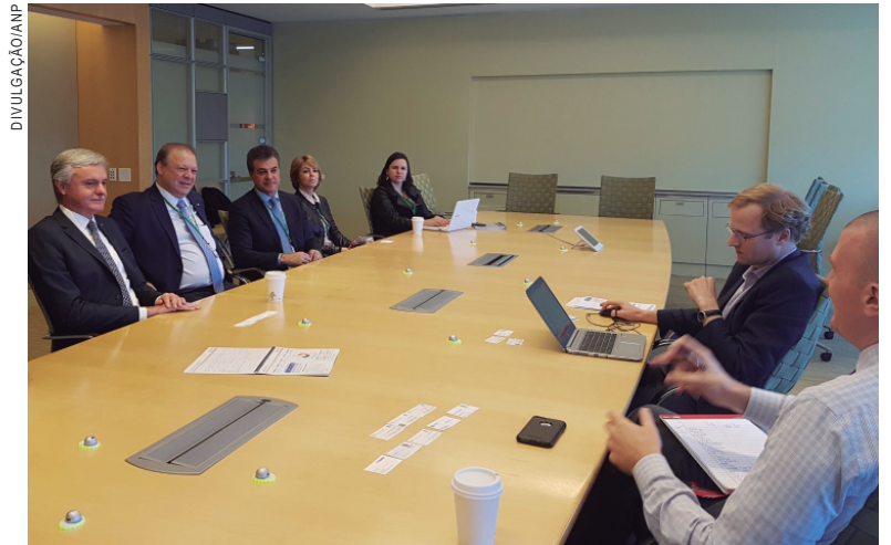
Governador Beto Richa durante reunião com executivos em Boston

Richa citou também a avaliação do grupo britânico The Economist, que apontou o Paraná como o segundo estado mais competitivo do País, atrás apenas de São Paulo. "Com o Paraná Competitivo, atraímos R$ 43 bilhões em investimentos em todas as regiões do Estado, gerando mais desenvolvimento e criando emprego e renda para a população", ressaltou, lem-