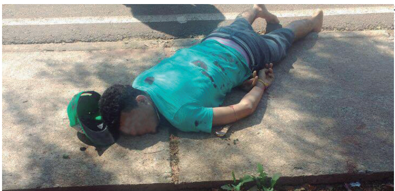
Foragido da Peco, envolvido em tráfico, é assassinado à tiros em Tapejara

Um homem de 31 anos foi morto a tiros no final da manhã da quarta-feira (30) em Tapejara (54 quilômetros de Umuarama). A vítima do atentado foi identificada e trata-se de um ex-detento da Penitenciária de Cruzeiro do Oeste (Peco) e seus antecedentes seriam por envolvimento em crime de tráfico de drogas.