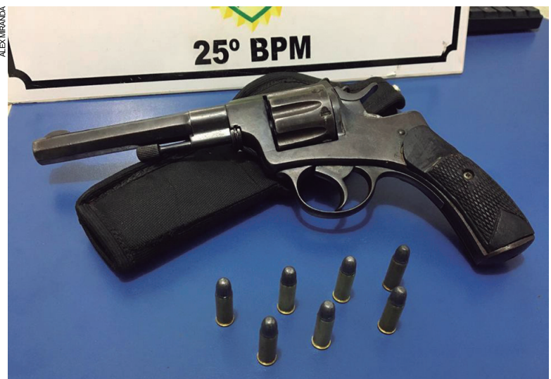
Uma das armas apreendidas pela Polícia Militar nas ações durante noite de quinta-feira e madrugada sexta-feira

Quando a equipe chegou ao endereço, foi recepcionado pelo denunciado, que prontamente franqueou a entrada dos PMs ao imóvel. Na revista, foi encontrado dentro de um armário, um revólver de calibre 32, com capacidade para oito tiros e seis cartuchos intactos do mesmo calibre.