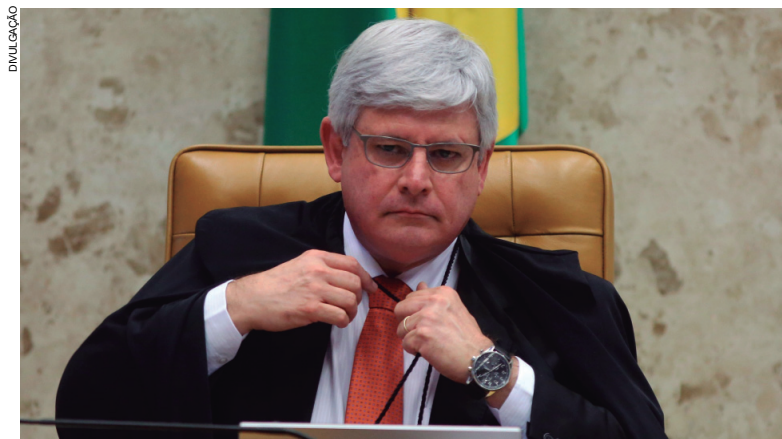
Procurador-geral da República Rodrigo Janot

As investigações apuram a ocorrência dos crimes de lavagem de dinheiro e corrupção