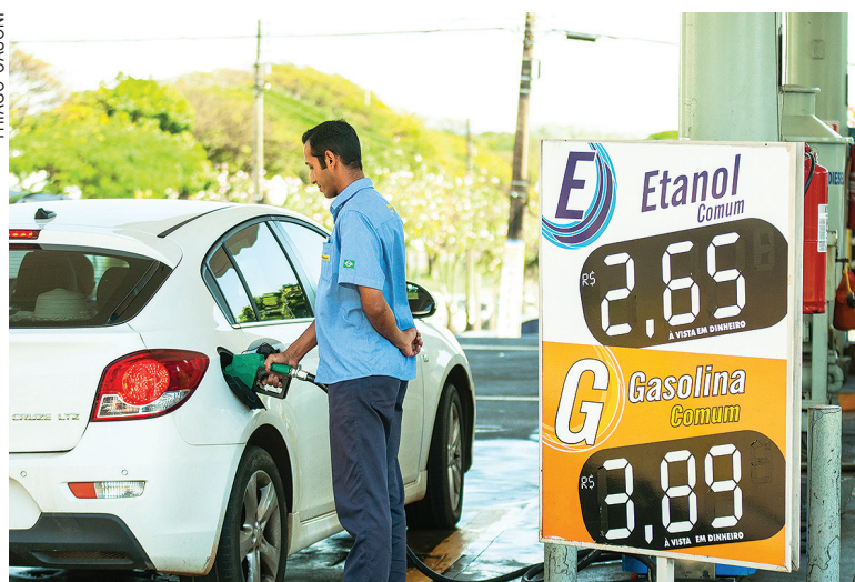
De acordo com levantamento da ANP, o valor máximo da gasolina comum na cidade era de R$3,99 e o mínimo R$3,79, entre 1º a 17 de agosto

passou de R$ 0,12 para R$ 0,13 para o produtor. Para o distribuidor, a alíquota, zerada, aumentou para R$ 0,19.