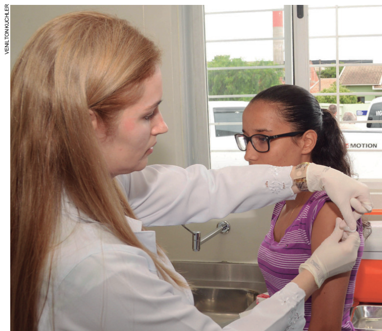
Campanha será de 20 de setembro a 27 de outubro nos 30 municípios que já receberam a primeira e a segunda etapa

Veja as cidades que receberão a campanha: Assaí, Bela Vista do Paraíso, Boa Vista da Aparecida, Cambará, Cambé, Cruzeiro do Sul, Foz do Iguaçu, Ibiporã, Iguaçu, Itambaracá, Jataizinho, Leopoldina, Londrina, Mandaguari, Marialva, Maringá, Maripá, Munhoz de Melo, Paçandu, Paranaguá, Porecatu, Santa Fé, Santa Isabel do Ivaí, Santa Terezinha de