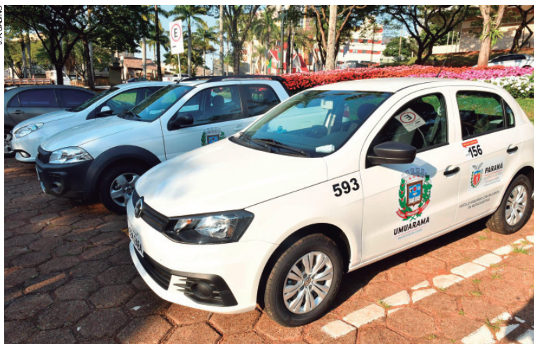
Três veículos vão reforçar o atendimento prestado pela secretaria

da de recursos no passado, por falta de projetos – que estimou em R$ 4 milhões apenas na área social – e disse que a equipe atual tem conseguido mais acesso às fontes. “Temos atendido a todas as secretarias municipais e assessorado aquelas que têm acesso a fontes externas. Estamos estruturando as equipes, melhorando a estrutura física, cobrando apoio dos nossos parlamentares em Bra-