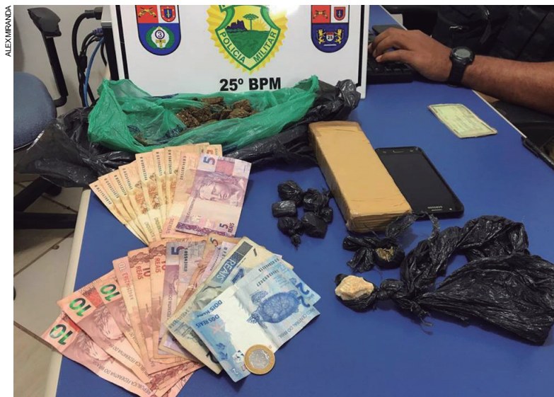
Maconha, crack e dinheiro apreendido com três jovens maiores de idade numa ação da PM que terminou na madrugada da quinta-feira (24)

O trio foi conduzido à Delegacia de Polícia de Umuarama, onde foi denunciado e recolhido, sendo mantido à disposição da Justiça.