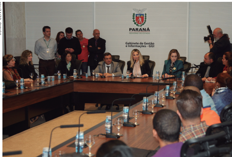
Os médicos foram recebidos pela governadora em exercício e o secretário de saúde

O Paraná possui 1.055 vagas para os profissionais do Mais Médicos em 315 municípios. Destas, 141 estão desocupadas e serão preenchidas com os profissionais que chegaram nesta quinta-feira e com outros que estão em processo de seleção. O Ministério da Saúde está com um edital em