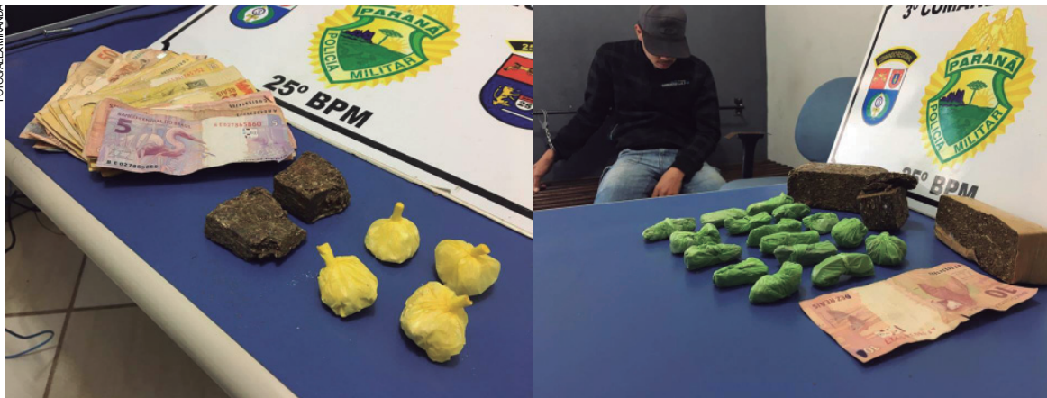
À esquerda, cocaína apreendida no Parque Industrial e ao lado, um adolescente apreendido com várias porções de maconha

Uma varredura foi realizada, mesmo na escuridão, até que os policiais localizaram minutos depois um pote plástico que armazenava R$ 815 em espécie e outras duas porções de cocaína.