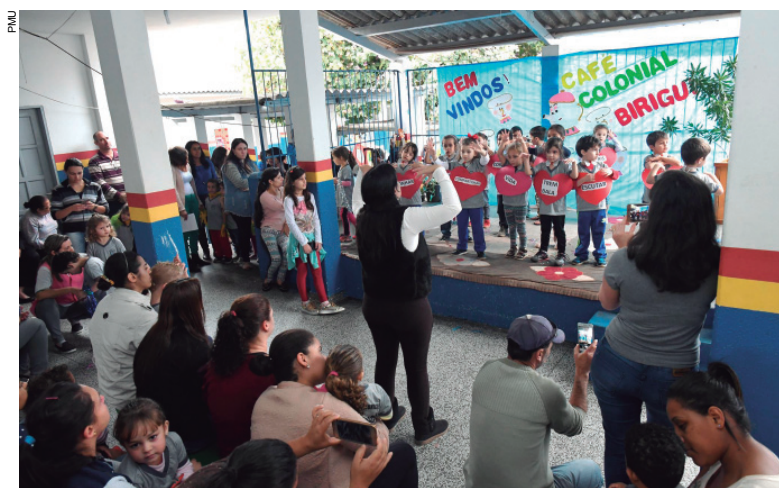
A atividade de interação foi na Escola Jardim Birigui na última semana