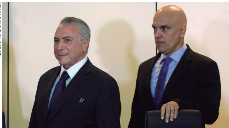
Michel Temer, ao lado do ministro do STF, Alexandre de Moraes

Supremo que a demora de Maia em processar o pedido representa "ato ilegal e omissivo", ainda que a Constituição garanta ao presidente da Câmara a prer-