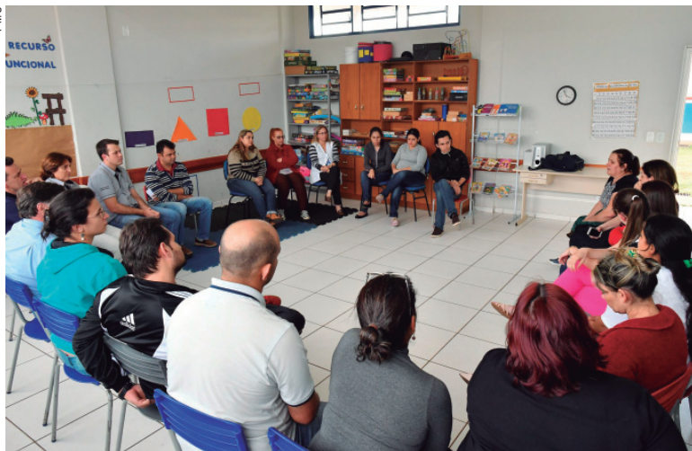
Representantes da escola, a Guarda Municipal e equipe da Secretaria Municipal de Educação, além do prefeito se reuniram para tratar do assunto