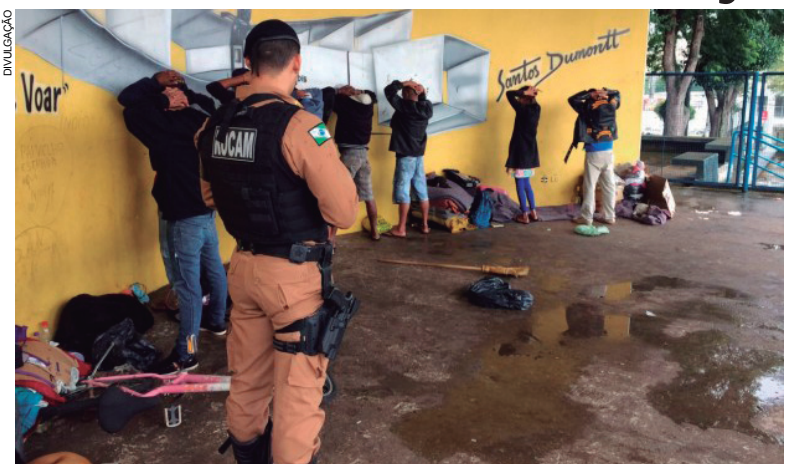
Mandado de prisão força PM a prender índio que se misturava aos moradores de rua de Umuarama

Desde o início do mês, quando uma operação envolvendo órgãos de segurança e a assistência social do município retirou andarilhos que fixavam residên-