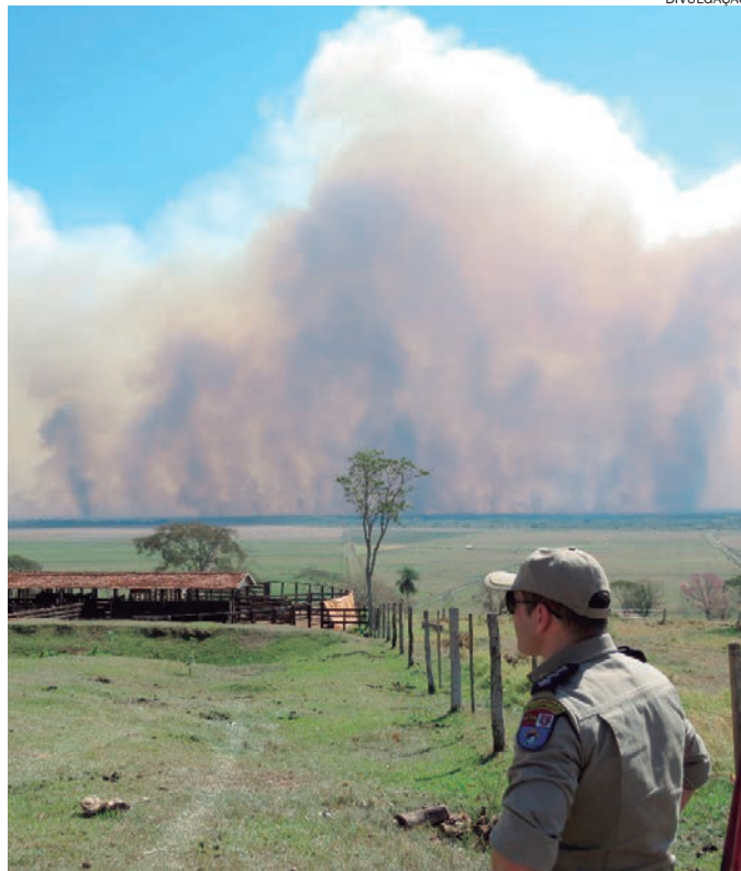
FOGO já se aproxima de propriedades rurais na região

O incêndio que atinge o Parque Nacional de Ilha Grande já consumiu 76 mil hectares, aproximadamente 63% da área, em dez dias. Segundo informações do Instituto Chico Mendes de Conservação da Biodiversidade (ICM-Bio), que cuida da área, o fogo já se aproxima de propriedades rurais na região. A comunidade também já participa do combate às chamas, junto com os bombeiros, brigadistas do parque e polícia militar do Paraná e Mato Grosso do Sul.