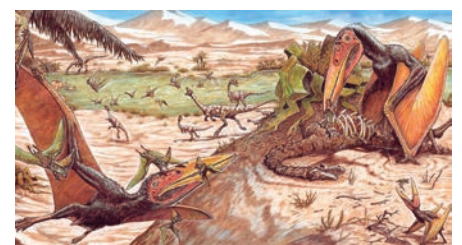
NO desenho, produzido pela Universidade da Contestado, o ‘Keresdrakon’ voando e comendo