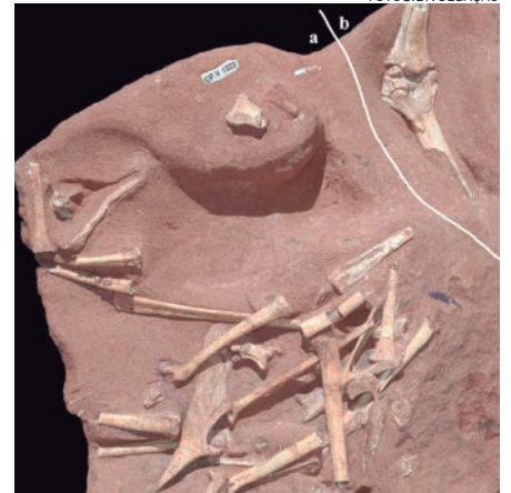
FÓSSIL de pterossauro foi analisado na Universidade do Contestado

O estudo também contou com a participação da Universidade Estadual de Ponta Grossa (UEPG), da Universidade Federal do Paraná (UFPR) e Universidade Paranaense (Unipar).