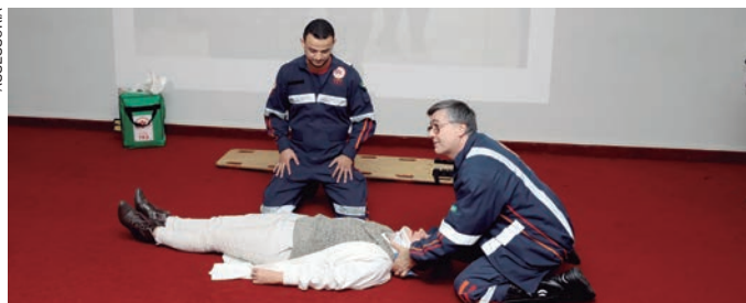
PALESTRA e demonstração das manobras de primeiros socorros marcaram a cerimônia de inauguração da Liga