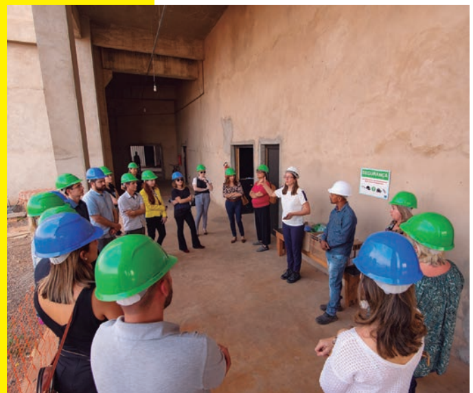
Início da visita . . . e atentos as explicações