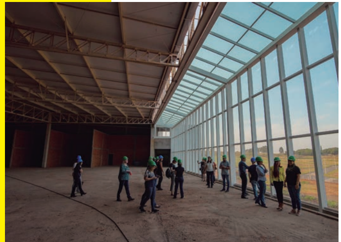
Vista panorâmica da Praça de Alimentação