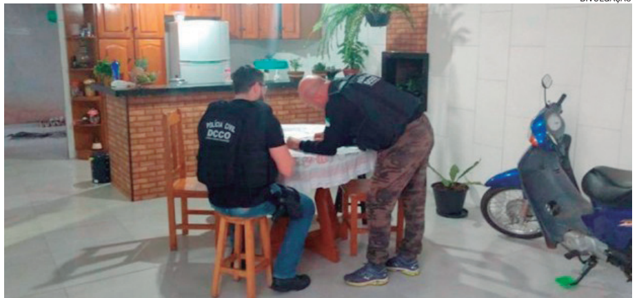
INVESTIGADORES do DCCO da Polícia Civil na casa do vereador envolvido