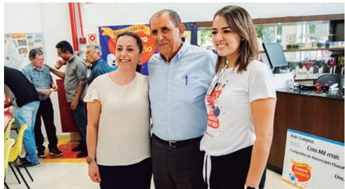
Uopecan, primeira mais lembrada