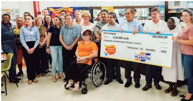
Representantes das entidades participantes