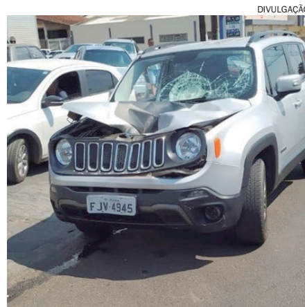
MARCAS da colisão contra o pedestre, mostram a violência do choque

O Jeep Renegade, de ano 2016, de Umuarama foi levado à delegacia de Umuarama, onde será submetido a uma perícia. O corpo do homem foi trasladado ainda no domingo, ao Instituto Médico Legal (IML).