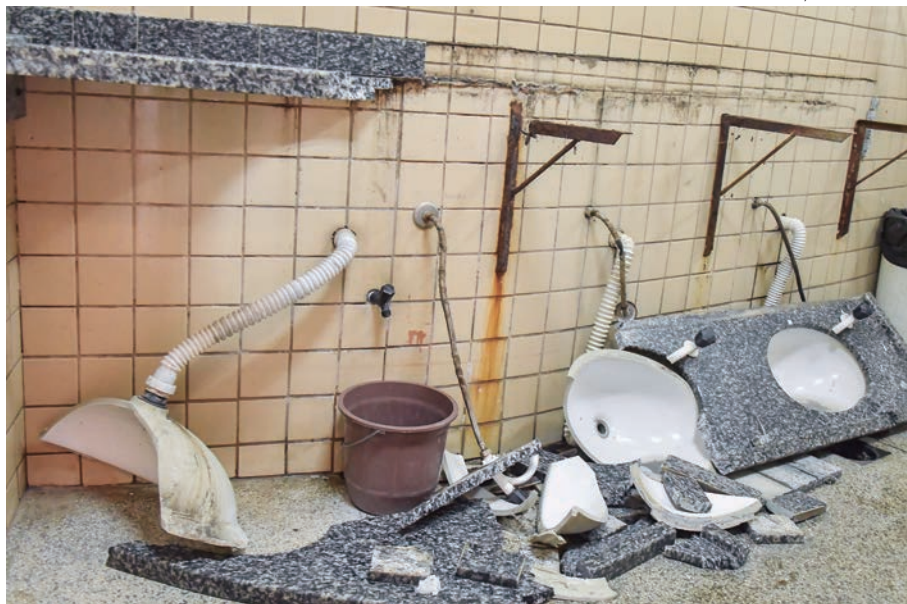
BANHEIRO ficou destruído com a ação dos criminosos

Em duas ações praticadas por criminosos, o prejuízo deixado foi de aproximadamente R$ 5 mil. “Há poucos dias foram destruídos os vasos sanitários. Agora foi a pia e, antes da reforma do banheiro, também destruíram o urinol coletivo, sem falar no furto de lâmpadas e até de rolos de papel higiênico, apesar da fiscalização e dos cuidados que tomamos