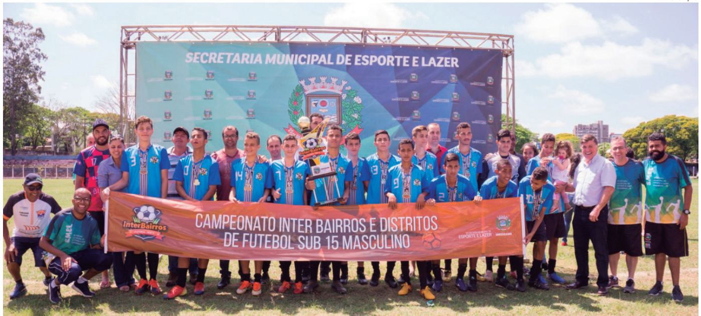
O time campeão da final do campeonato Colégio Bento

A Secretaria de Esporte e Lazer (Smel) e a Prefeitura de Umuarama encerram no último domingo (22), o Campeonato Interbairros e Distritos de Futebol Sub 15 (atletas nascidos até 2004). Os jogos da competição aconteceram durante a manhã, no Estádio Municipal Lúcio Pipino. A presença dos pais abrihantou ainda mais o evento.