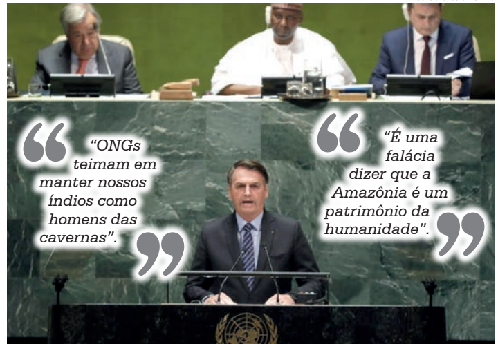
Presidente Jair Bolsonaro fez um discurso agressivo na abertura da Assembleia Geral da ONU, ontem, em Nova York, com ênfase à soberania nacional.

(Envie sua opinião com até 1.200 caracteres para editoria@jhoje.com.br)