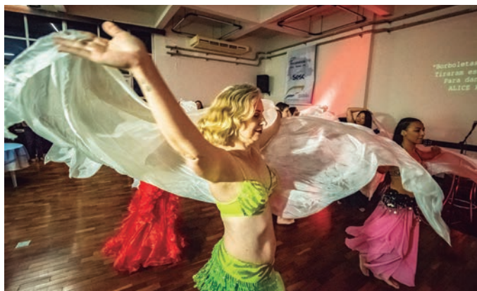
Dança do Ventre ...