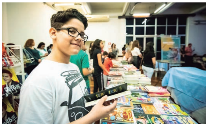
Prestigio das crianças ...