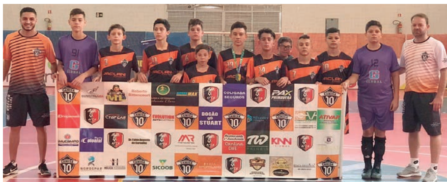
A equipe que embarcou para a disputa final em Curitiba

e enfrentará times fortes como A.A. Comercial de Cascavel, Clube Olímpico Maringá e ACGF Ponta Grossa. “O nível de dificuldades vai ser bem grande, pois iremos enfrentar equipes fortes, mas treinamos muito e