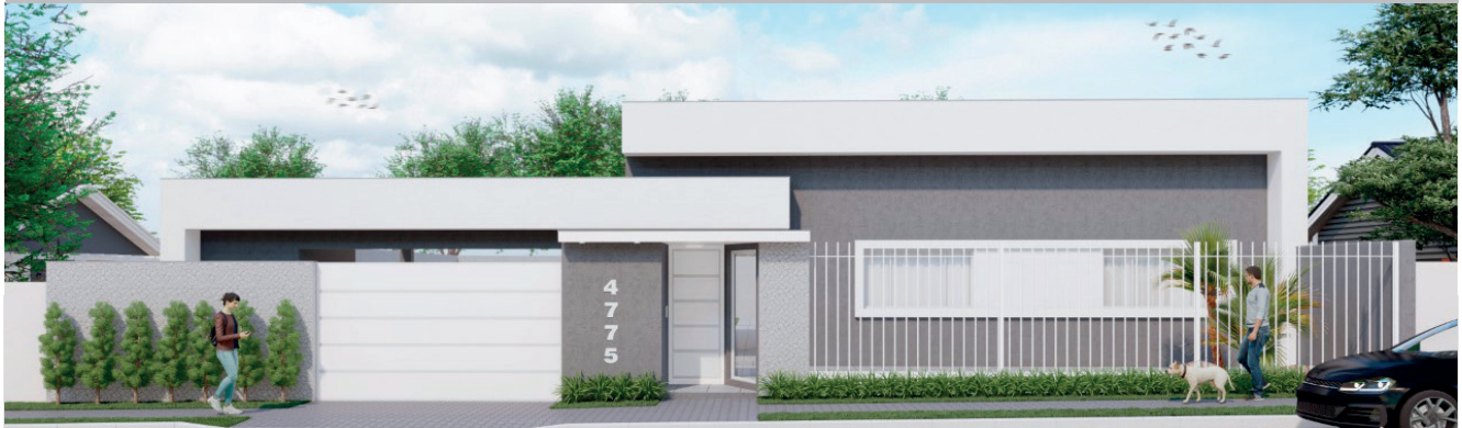
*PERSPECTIVA DO PROJETO