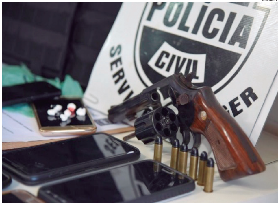
ARMA usada no crime foi apreendida durante cumprimento de mandados de busca no Parque das Jaboticabeiras

O delegado explica que as investigações desenvolvidas pelo Grupo de Diligências Especiais (GDE) de Umuarama revelaram que o crime de homicídio foi praticado por três pessoas, que foram identificadas