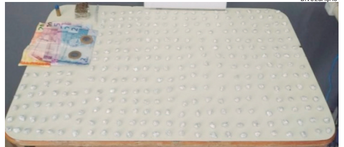
FORAM encontradas 300 pedras de crack em uma casa no bairro. Duas pessoas foram presas

O entorpecente estava escondido dentro de uma