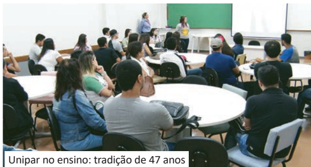
Unipar no ensino: tradição de 47 anos