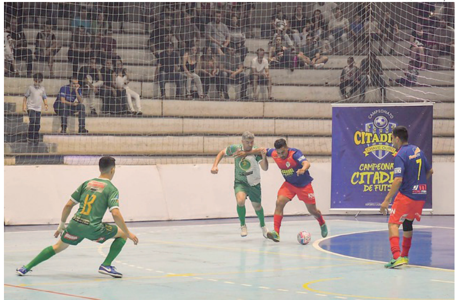
ACERU (laranja e azul) em seu último jogo, quando ficou em segundo lugar no Citadino

A equipe do Aceru, que foi vice-campeã da Chave Ouro do campeonato Citadino em Umuarama já confirmou presença na competição que acontecerá em Pérola. O time terá