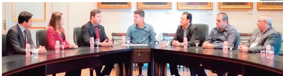
Na reunião, houve a liberação de indicações destinando recursos aos municípios