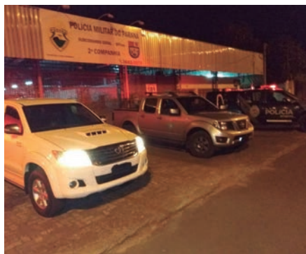
CARREGAMENTO seria entregue em Umuarama, mas veículos foram apreendidos antes

Após varredura da área, foi constatado que havia duas camionetes. Uma Toyota/Hilux de cor branca e uma Nissan/Frontier de cor prata, sem os bancos dos passageiros e com rádios comunicadores acoplados.