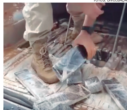
DROGA apreendida entrava no Paraná pela divisa estadual

Os dois envolvidos, com 21 e 30 anos de idade, foram presos em flagrante e conduzidos à Delegacia