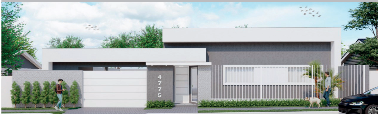
*PERSPECTIVA DO PROJETO