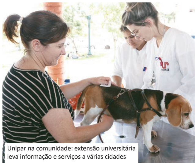
Unipar na comunidade: extensão universitária leva informação e serviços a várias cidades