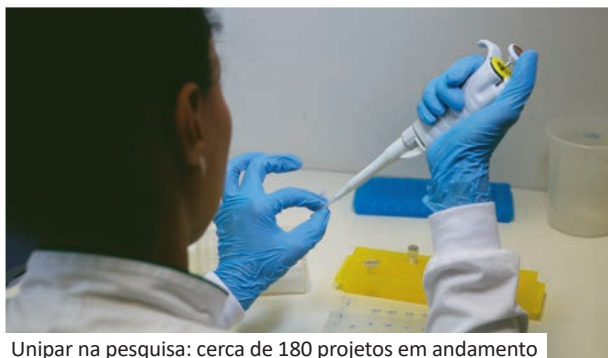
Unipar na pesquisa: cerca de 180 projetos em andamento