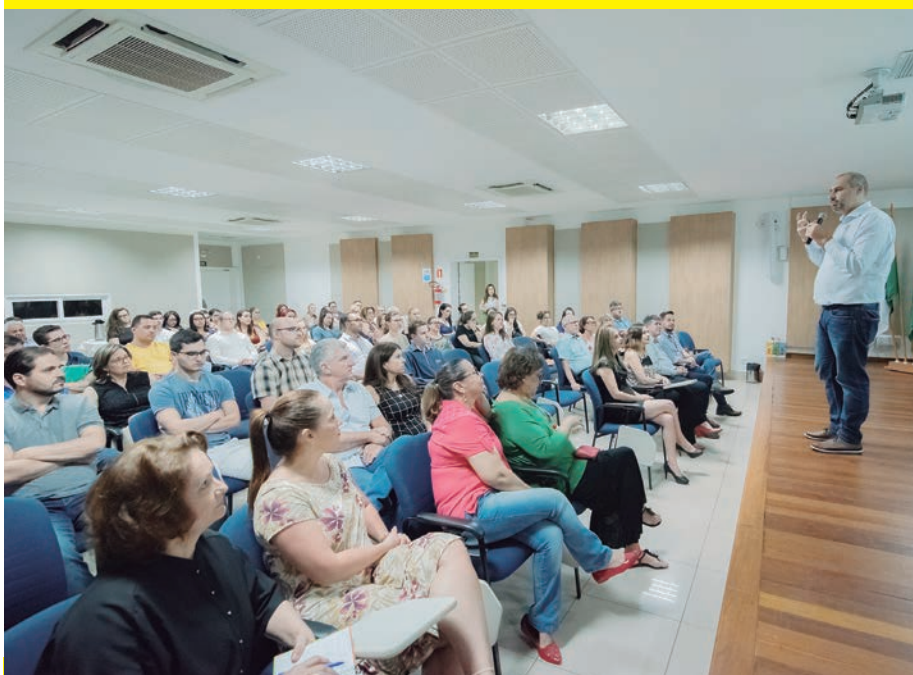
No Senac: platéia coesa, atenta e conectada

A agenda de Novembro destaca mais um evento da Câmara da Mulher, em parceria com Sebrae, ACIU, Conselho da Mulher, Fecomércio, Sesc, Senac e Sindilojistas que acontece dia 21 de novembro denominado Rodada de Negócios, no Studio Brum Arquitetura. A coluna dará mais detalhes, na semana que vem