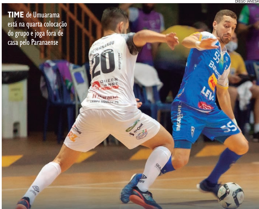
TIME de Umuarama está na quarta colocação do grupo e joga fora de casa pelo Paranaense

O próximo adversário do Campo Mourão pela Liga Nacional de Futsal 2020 será a Assoeva, dia 11/10, em Venâncio Aires/RS. O Umuarama só volta a jogar pela LNF no dia 24/10 contra o Pato Branco. Os dois jogos terão transmissão da LNFTV. O time do Umuarama segue líder do grupo C da LNF com 15 pontos em 9 jogos.