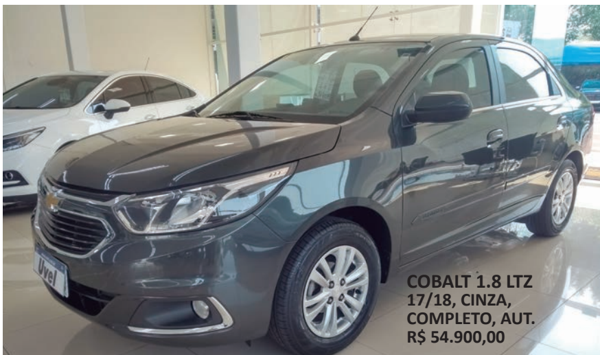
COBALT 1.8 LTZ 17/18, CINZA, COMPLETO, AUT. R$ 54.900,00