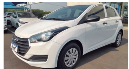
HB20 1.0 COMFORT 18/18, BRANCO, COMPLETO R$ 43.9000,00