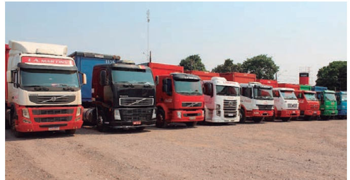
A empresa aderiu ao programa para fomentar a atividade comercial, atrair novas empresas e estimular o crescimento dos empreendimentos

“O Prodeu apontou o caminho mais correto à concessão de direito real de uso com doação futura, como é o caso da L.A Martins, responsável pela geração de dezenas de empregos diretos”,