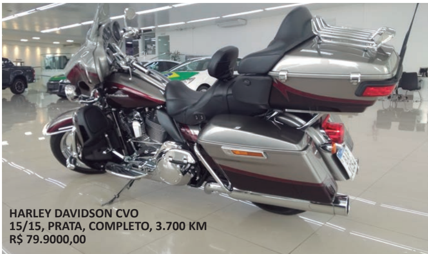
HARLEY DAVIDSON CVO 15/15, PRATA, COMPLETO, 3.700 KM R$ 79.9000,00