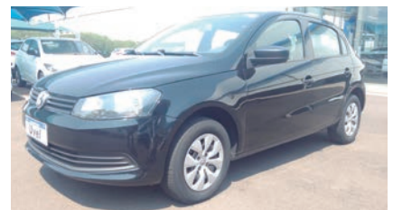
GOL 1.0 SPECIAL 15/16, PRATA, COMPLETO R$ 63.9000,00

CONFIRA MAIS OFERTAS EM NOSSO SITE: WWW.UVEL.COM.BR