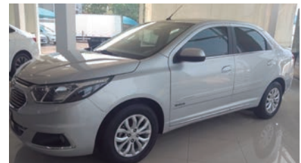
COBALT ELITE 18/19, PRATA, COMPLETO, AUT. R$ 63.9000,00