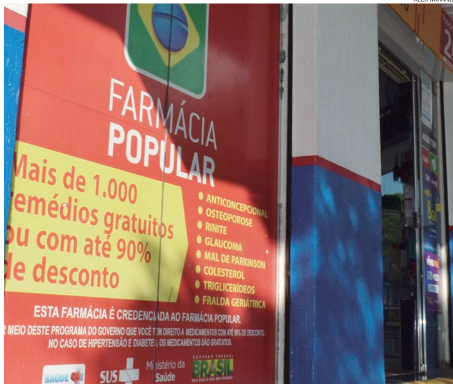
A ação civil pública contra a Farmácia Fugimoto foi movida pelo Ministério Público Federal

“A falta de prescrições médicas e cupons vinculados devidamente assinados, além de comprovantes em nome de pessoas falecidas e em nome de funcionário do estabelecimento, por si só, são suficientes para concluir que os réus