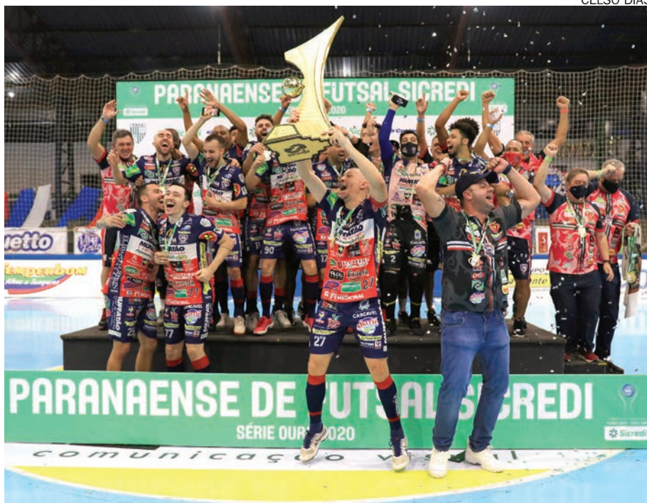
CASCABEL levantou a taça da edição 2020 da chave Ouro do Paranaense de Futsal se consagrando o maior campeão do Estado

Valente, o Umuarama, lutou muito, mas não teve força o suficiente para tirar o título das mãos do Cascavel, que conquistou o hexa campeonato paranaense de futsal.