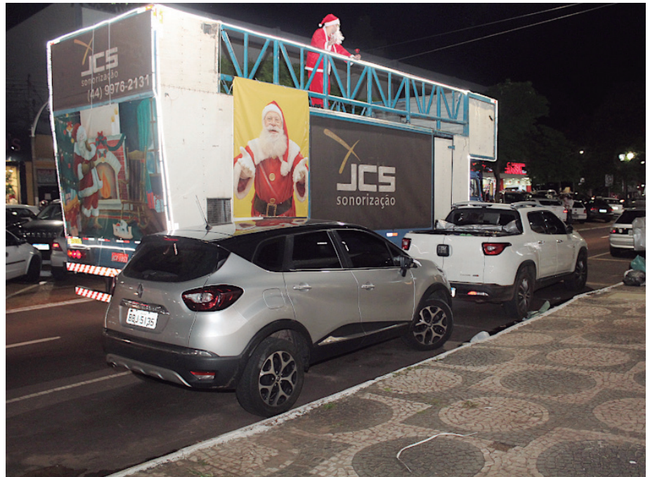
PAPAI Noel chegou em Umuarama e desfilou durante a semana sobre um caminhão e com trilha sonora temática, evocando natalis inesquecíveis

Pela mesma razão, atrações badaladas como o Auto de Natal da Unipar também deixam de