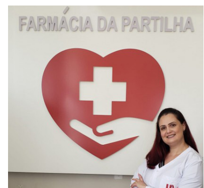
Mercado aquecido no setor de farmácia anima estudantes

A graduação em farmácia tem duração de 5 anos. O piso salarial da categoria varia conforme a área de atuação, mas a média é de R$ 3.300.