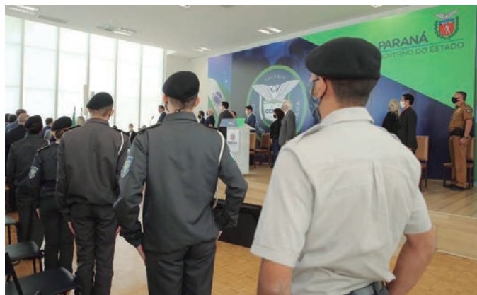
A adoção da modalidade foi aprovada por 199 colégios do Estado

Além da implementação de novos programas, a pasta também apostou na ampliação de projetos, como o Paraná Integral e o Prova Paraná. O primeiro, que consiste na oferta de ensino integral e currículo diferenciado,