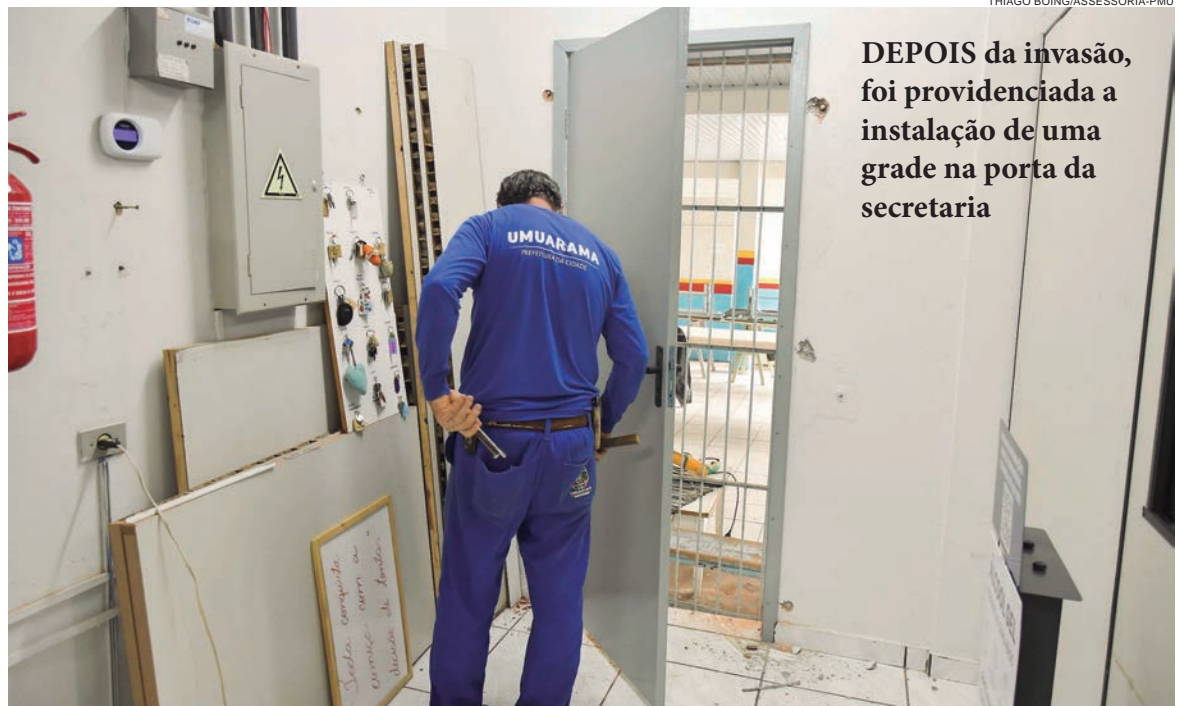
DEPOIS da invasão, foi providenciada a instalação de uma grade na porta da secretaria

“O prejuízo com o computador ainda não foi estimado, mas é lamentável que um estabelecimento de ensino seja alvo de ladrões. Ali estão pessoas dedicadas e recursos públicos que são utilizados para a educação das crianças e formação de cidadãos. A Escola Rui Barbosa tem cerca de 500 estudantes