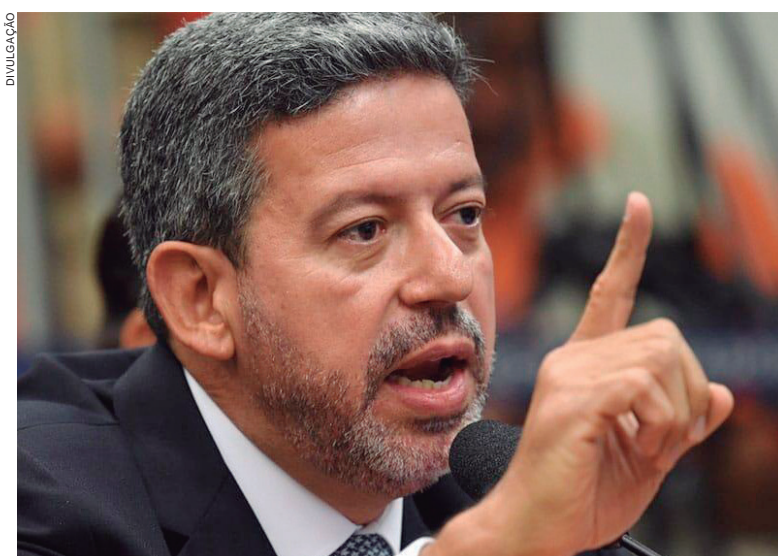
DEPUTADO Bolsonarista é o principal adversário de Baleia, candidato de Maia à presidência da Câmara

“PSL definitivamente fora do bloco da esquerda”, escreveu no Twitter o deputado Vitor Hugo, que foi líder do governo Bolsonaro na Câmara. O adversário de Baleia, Arthur Lira (Progressistas), o candidato oficial de Jair Bolsonaro, provocou Maia, que vem dizendo que as assinaturas dos deputados suspensos pelo PSL não deveriam ser levadas em conta.