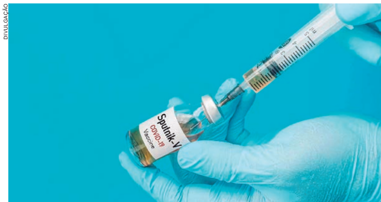
A Sputnik V já foi aprovada para uso emergencial em países como Argentina, Bolívia, Venezuela e Paraguai

“Considerada a afirmação do autor [governo da Bahia], feita na petição inicial, de que já foi requerida a autorização temporária para uso emergencial da vacina Sputnik V, informe, preliminarmente, a Agência Nacional de Vigilância Sanitária, no prazo de até 72h, se confirma tal afirmação e, em caso positivo, esclareça qual o estágio em que se encontra a aprovação do referido imunizante, bem assim eventuais pendências a serem cumpridas pelo interes-