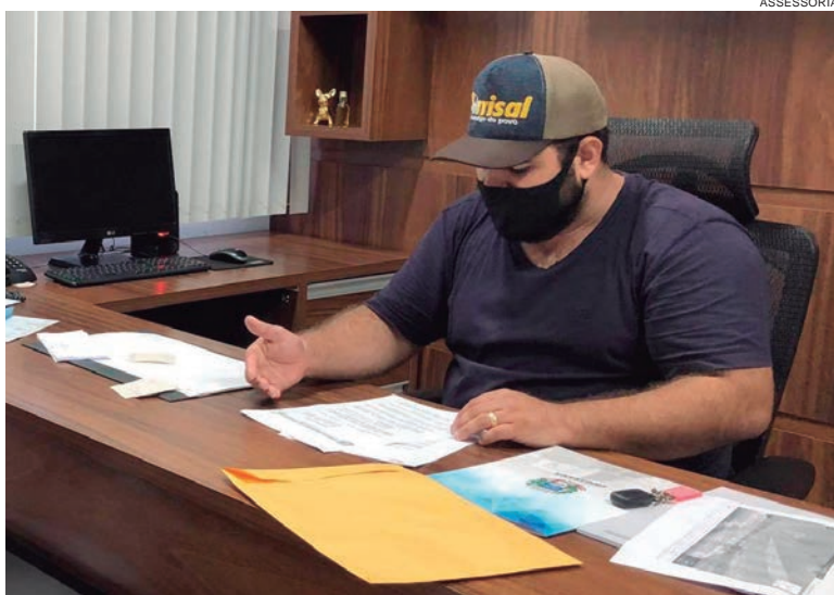
VEREADOR protocolou proposta que visa criar mecanismos de treinamento para defesa pessoal de mulheres vítimas de violência

Na proposição, o Poder Executivo poderá firmar convênios com entidades públicas e privadas, ligadas aos