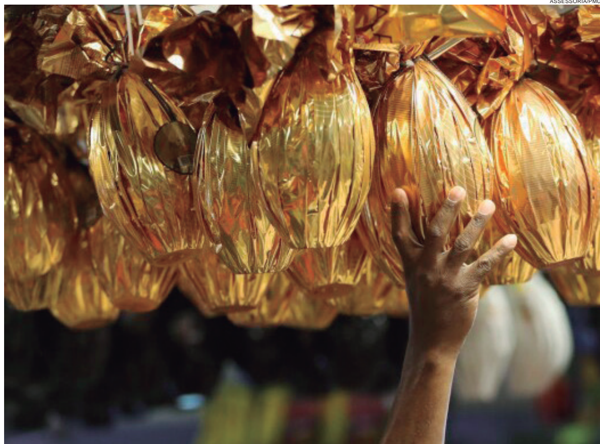
PESQUISA verificou grandes diferenças nos preços dos ovos de chocolate e de preços de pescado

Em cumprimento ao decreto municipal nº 086/2021