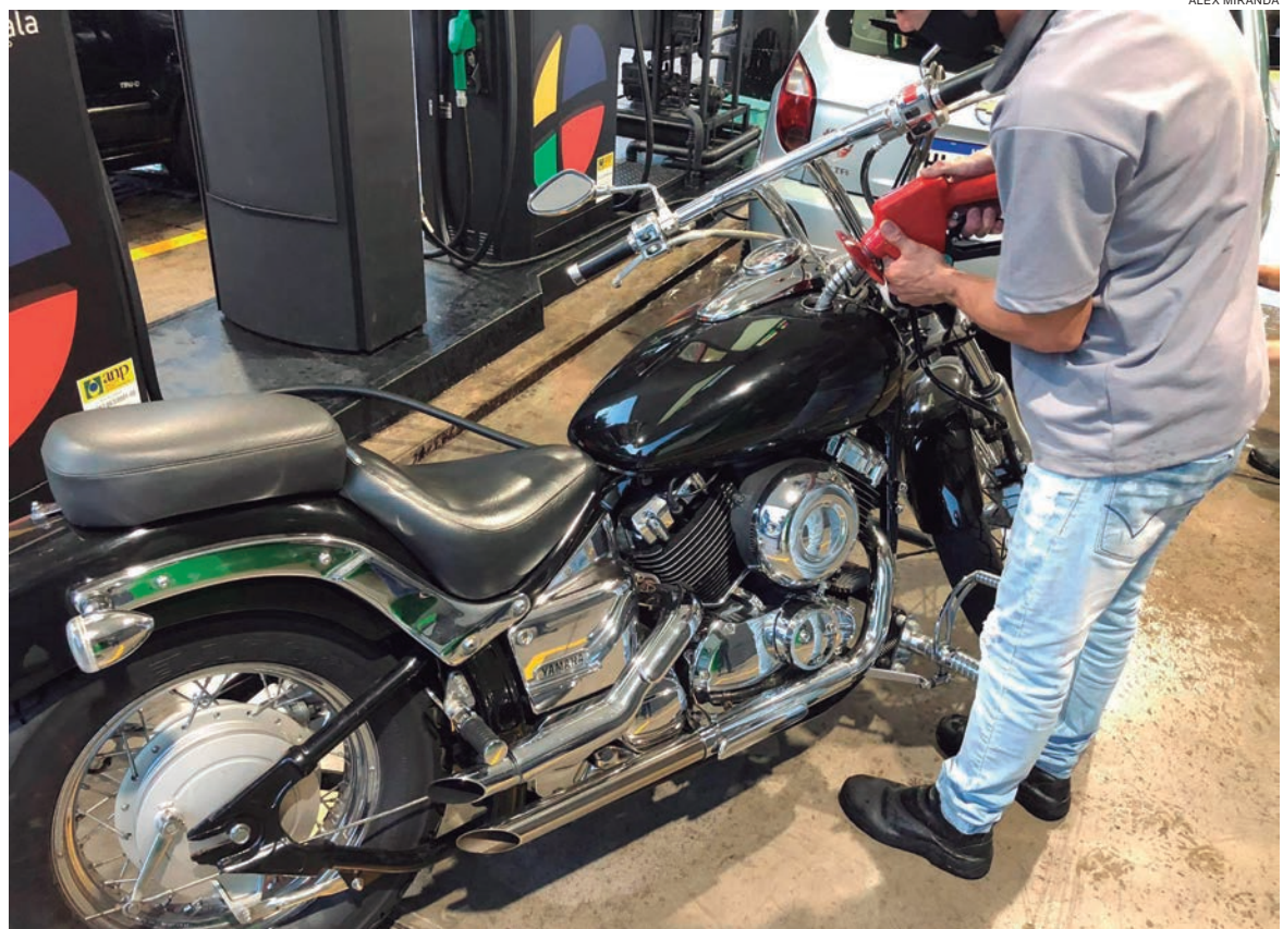
ESTA foi a segunda queda no preço da gasolina este ano e a primeira do preço do diesel

A Petrobras encerrou o quarto trimestre de 2020 com lucro recorde de R$ 7 bilhões, apesar do momento de crise. O resultado é, tanto recorde nominal entre as empresas brasileiras como também, quando se ajustam os valores dos maiores lucros da história pela inflação.