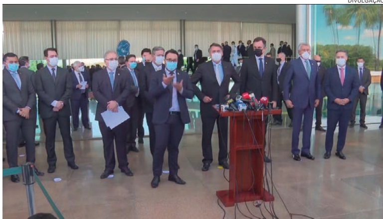
SERÁ criado um comitê que se reunirá toda semana com autoridades para decidir ou redirecionar o rumo do combate ao coronavírus

“Tratamos também de possibilidade de tratamen-