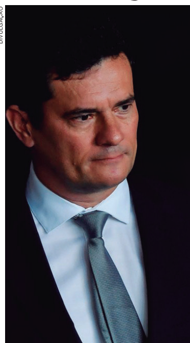
O ex-magistrado e ex-ministro da Justiça, se manifestou por meio de nota oficial

Ele ainda complementou: “O Brasil não pode retroceder e destruir o passado recente de combate à corrupção e à impunidade e pelo qual foi elogiado internacionalmente. A preocupação deve ser com o presente e com o futuro para aprimorar os mecanismos de prevenção e combate à corrupção e com isto construir um país melhor e mais justo para todos”.