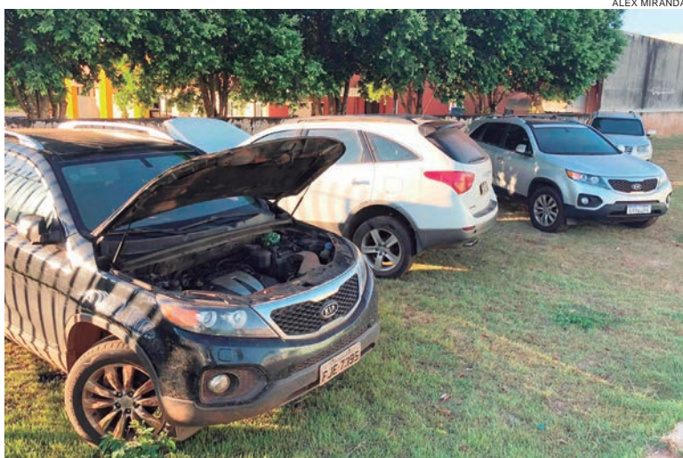
QUATRO veículos preparados para serem usados no contrabando, estavam em uma chácara

Em um deles, situado à rua Formosa, no centro da cidade, as equipes encontraram um veículo GM Cruze com alerta de roubo,