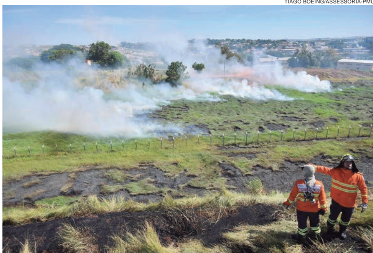
A área atingida foi de quase 40 mil metros quadrados nas imediações do aeroporto de Umuarama

“Não podemos afirmar que se tratou de uma queimada criminosa, pois pode ter sido uma pequena queimada que saiu do controle da pessoa e se alastrou”, explica o bombeiro, ressaltando que foram atingidos