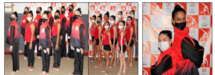
Pré-equipe e Equipe de Alto Rendimento