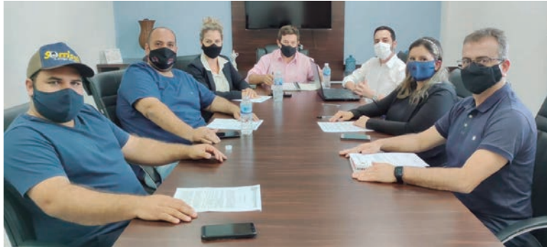
BANCADA parlamentar reunida para elaboração do documento que será apresentado em plenário para instalação da Comissão

Na ocasião, os parlamentares entraram em consenso para que fosse feito requerimento único, o qual seria endossado por todos. O trabalho tem como propósito principal, acompanhar paralelamente às investigações dos desvios de recursos do Fundo Municipal de Saúde, encontrados durante a Operação Metástase, conduzida pelo MPPR por meio da Subprocuradoria-Geral