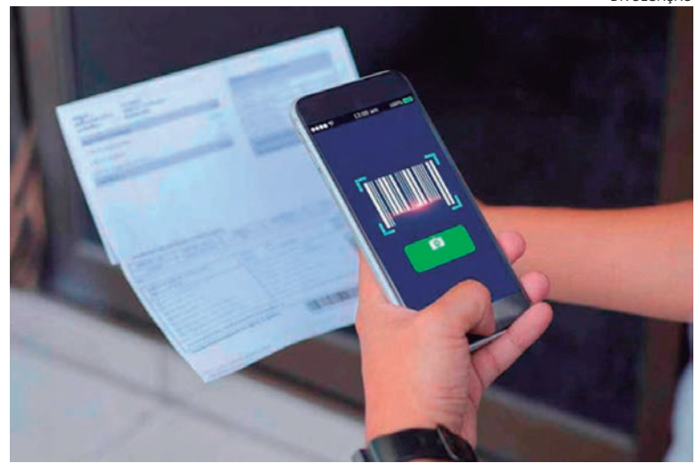
FALSOS boletos são encaminhados pelos Correios e, em muitos casos, por pura desatenção, acabam sendo quitados

Outra característica deste tipo de fraude é conter, no corpo do e-mail, arquivos anexados ou links que direcionam para um endereço suspeito. Se receber algum e-mail que foge aos padrões habituais,