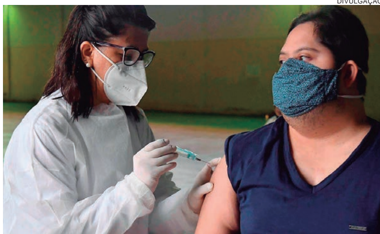
A segunda dose será aplicada nos alunos da Associação daqui a três meses

Vinte alunos da Associação de Pais e Amigos dos Excepcionais (APAE) de Umuarama receberam a 1ª dose da vacina contra o coronavírus. Os alunos com síndrome de down foram imunizados na última quarta-feira (12) na sede da Associação. Os profissionais da saúde do Jardim Lisboa foram até a escola e ministraram as doses nos alunos. Foram vacinados os estudantes acima de 18 anos e que são portadores da síndrome de down. Eles receberam a 1ª dose do imunizante AstraZeneca/Fiocruz. Agora eles irão receber a 2ª dose daqui há três meses.