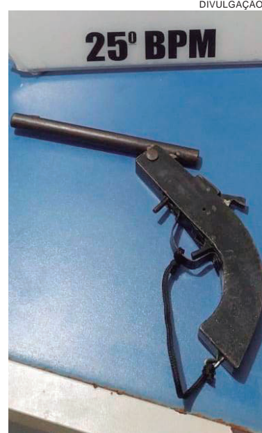
ARMA artesanal apreendida, aparentemente 'calça' cartuchos de calibre 22

Ela escondeu a bolsa e foi coagida pelo irmão. Com a intervenção dos policiais, o cidadão que ameaçava agredir a irmão foi levado, junto com a garrucha, à DP de Umuarama. Todos foram ouvidos e depois foram liberados, mas a arma artesanal ficou apreendida.