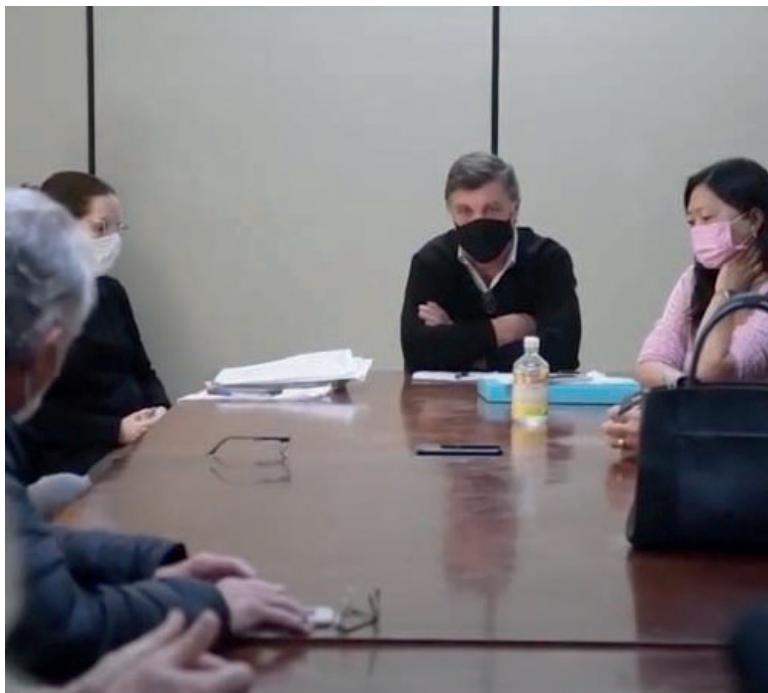
PREFEITO , secretária de Saúde e promotor de Justiça discutiram com diretores do hospital INSA, retomada do atendimento pelo SUS

Até a reativação, os pacientes serão encaminhados para outras unidades da cidade. Na justificativa a diretoria do INSA afirma que não tem mais a disponibilidade para a realização de exames de Radiodiagnóstico, reforçando em um segundo documento que devido à pandemia, existe a dificuldade em adquirir medicamentos e