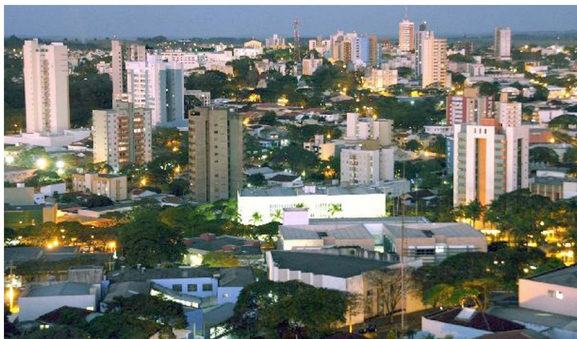
COM 216 trabalhadores colocados no mercado de trabalho, Umuarama está entre as agências que mais intermediou contratações no Paraná