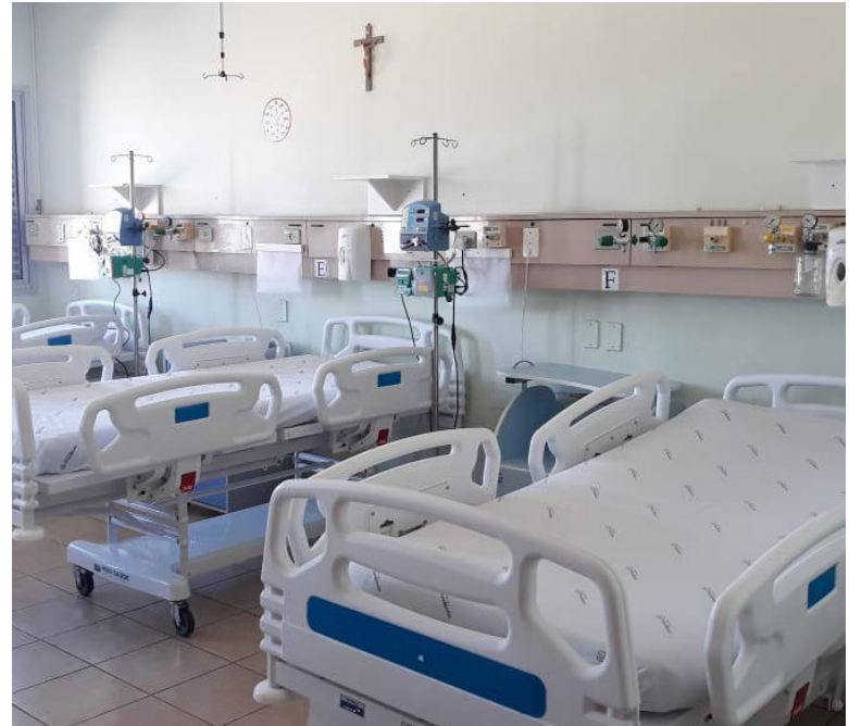
SÃO dez leitos de UTI no Hospital Municipal e dez leitos de enfermaria no Hospital Universitário

A ampliação de leitos viabiliza o acesso de pacientes ao atendimento, mas não impede as complicações em virtude da