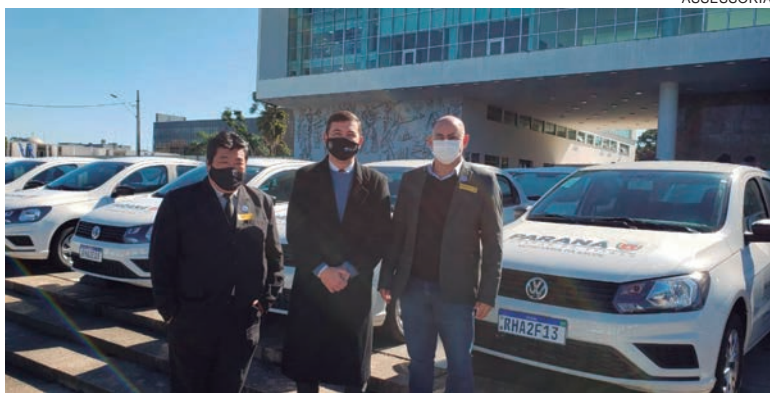
DOURADINA foi uma das cidades beneficiadas pelo Estado com veículos repassados para serem usados nas Secretarias de Saúde