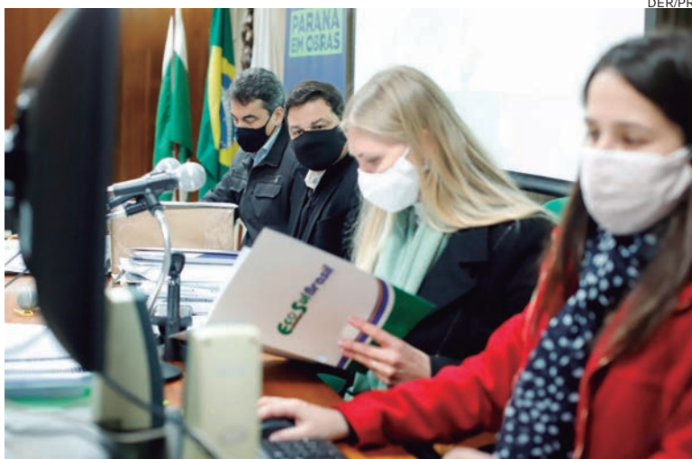
AS propostas serão analisadas e depois acontece a abertura dos envelopes com documentos de habilitação das melhores colocadas

Agora as propostas serão analisadas pela comissão de licitação, com o resultado sendo publicado em Diário Oficial e no portal Compras Paraná, também já marcando a data para abertura dos envelopes com documentos de habilitação das melhores colocadas.