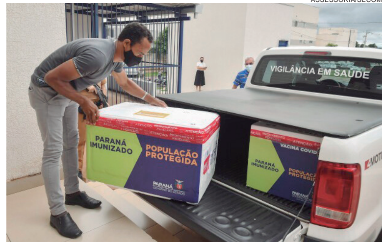
RITMO da vacinação é definido pelo Plano Nacional de Imunização. Ministério da Saúde é responsável por adquirir e distribuir as doses da vacina aos estados

Outra dúvida da população é com relação ao saldo de doses da vacina contra