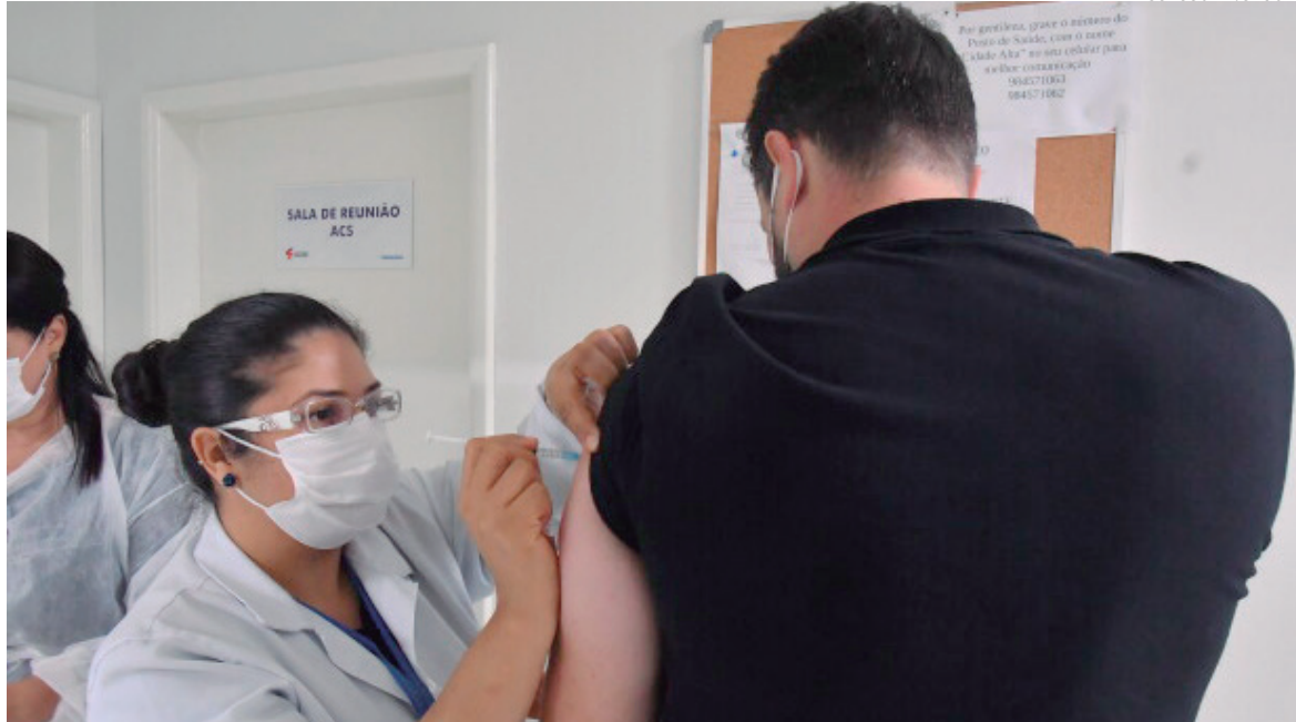
A vacina estará disponível nas UBS Jardim Cruzeiro, Centro de Saúde Escola e no Colégio Estadual Dra. Zilda Arns (com a equipe da UBS San Remo)

Umuarama terá vacinação contra o coronavírus para o público em geral de 44 anos ou mais no próximo domingo (4), das 8h às 12h. O setor de Atenção Primária em Saúde da Secretaria Municipal de Saúde reuniu a equipe de vacinação na tarde desta quinta-feira (1º), na Prefeitura, para planejar como será disponibilizada a vacina, que a exemplo do último sábado deverá atrair um grande público.