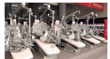
Os consultórios doados às entidades