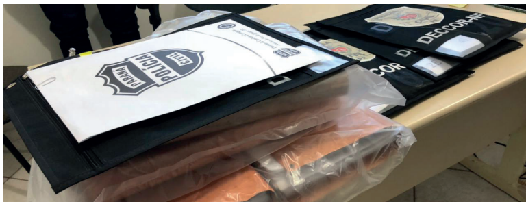
No Noroeste foram apreendidos documentos em empresas investigadas e telefones celulares de suspeitos de estarem envolvidos nas fraudes

Mais de 120 policiais participaram da ação simultaneamente nos municípios de Alto Piquiri, Goioerê, Juranda, Anahy, Braganey, Campo Bonito, Cascavel, Quatro Pontes, São José das Palmeiras, Ouro Verde, São Pedro do Iguçu, São Miguel do Iguçu, Santa Lúcia, Capitão Leônidas Marques, Capanema, Realeza, Catanduvas, Três Barras do Paraná e Rio Bonito do Iguçu.