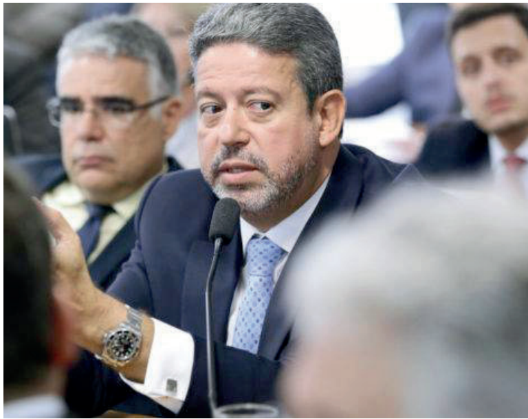
COM Mourão na Angola, Lira é o primeiro da linha sucessória caso Bolsonaro se afaste para tratamento de saúde, mas decisão do STF o impede

Lira, porém, enfrenta um obstáculo para despachar no quarto andar do Palácio do Planalto, onde está localizado o gabinete de Bolsonaro.