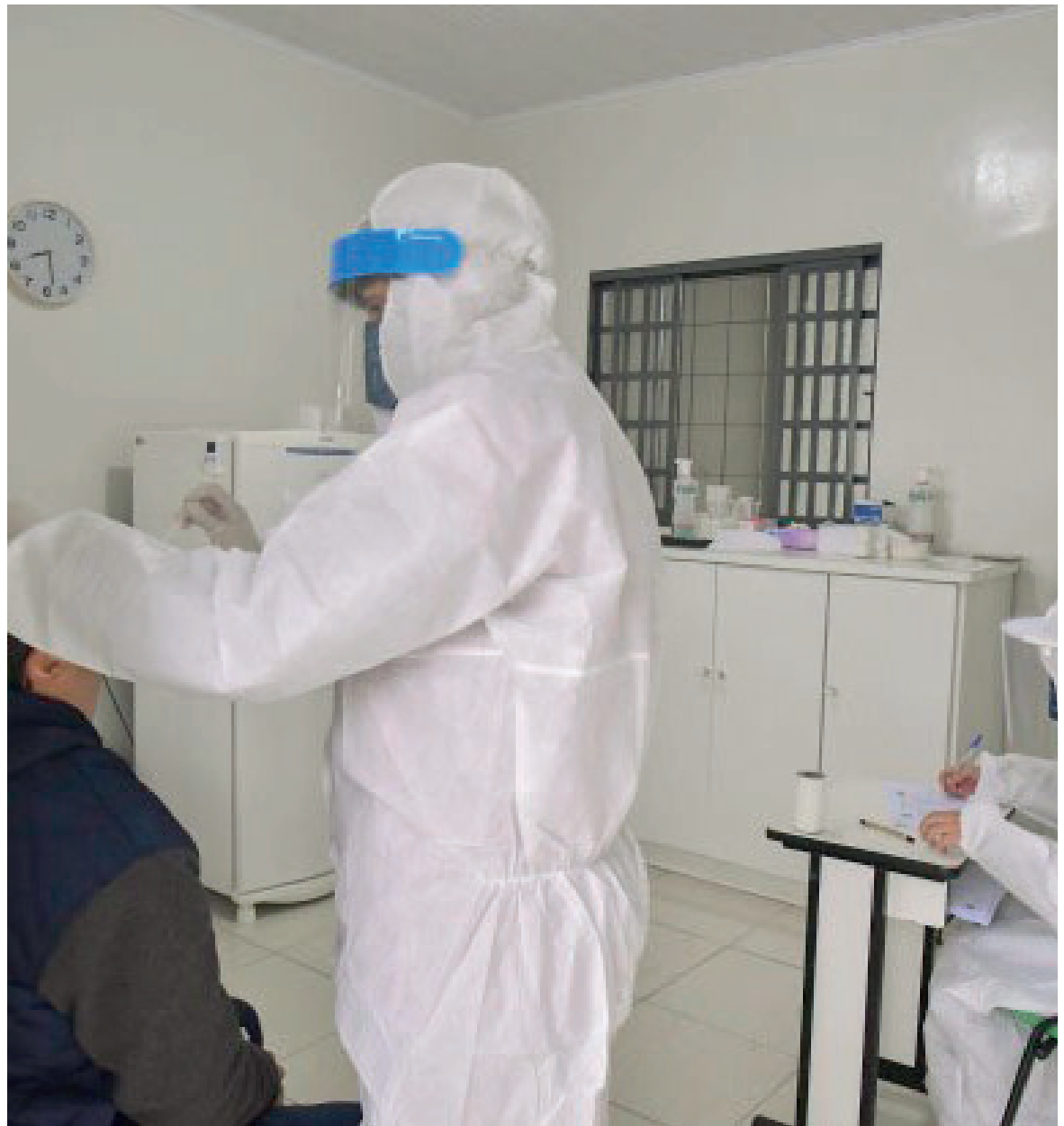
OS CASOS confirmados na quinzena impressionam: foram 856, uma média de 57 por dia e no dia em que houve menos casos foram registrados (1º) 42

Os casos confirmados na quinzena também impressionam: foram 856, uma média de 57 por dia. No dia em que menos casos foram registrados (1º) houve 42 casos, já o dia com mais confirmações (8) foram 84. As mulheres continuam sendo maioria entre os infectados pelo vírus Sars-CoV-19, com 428 casos (50%) – foram 378 homens (44%) e 50 crianças (6%).