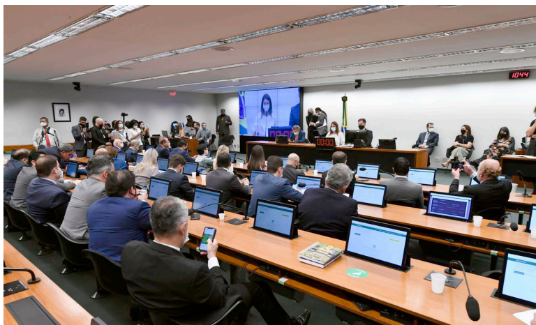
APÓS passar pela CMO, a proposta deve ser votada ainda nesta quinta pelos plenários da Câmara dos Deputados e do Senado Federal

Após passar pela CMO, a proposta deve ser votada ainda nesta quinta pelos plenários