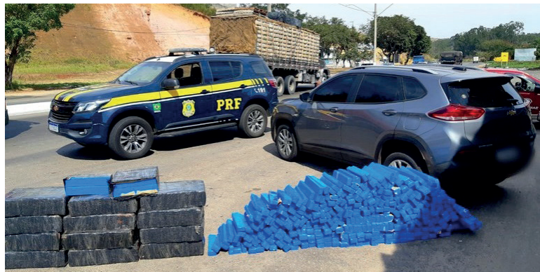
MOTORISTA do caro com placas falsas disse que a droga saiu de Umuarama e seria entregue no Rio de Janeiro

Durante a abordagem, os policiais localizaram 680 tabletes de maconha, acondicionados em todo o interior do veículo, que também utilizava placas adulteradas de São