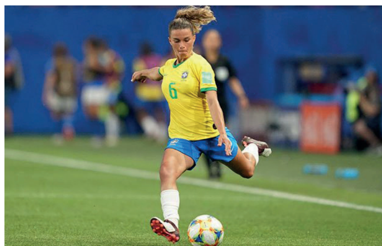
A LATERAL da Seleção lembrou do confronto no Torneio Internacional da França, quando Brasil e Holanda empataram sem gols

Brasil e Holanda se enfrentam neste sábado, às 08h (de Brasília).