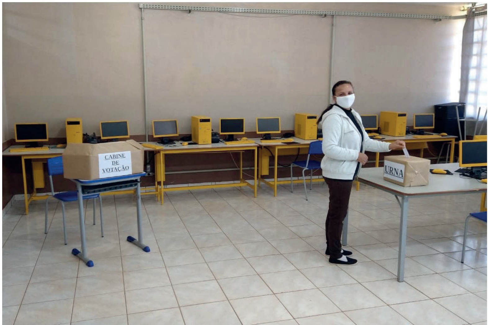
NA REGIÃO compreendida pelo Núcleo Regional de Educação com sede em Umuarama, são cinco os colégios onde acontecerão eleições para diretores

A segunda votação ocorre principalmente porque as instituições não atingiram o quórum mínimo de 35% de votantes para homologar a consulta. Em outras, há disputas entre chapas e não foi atingida a maioria e, portanto, é feito o segundo turno. Também existem casos de impugnação da primeira consulta por irregularidades cometidas pelas chapas durante o processo.