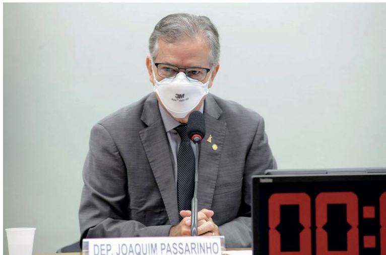
DEPUTADO Joaquim Passarinho acredita que a medida pode ter papel importante na recuperação da economia

“O projeto representa iniciativa para fornecer taxas de juros mais baixas nos empréstimos das instituições financeiras oficiais que utilizam a TLP e sua taxa de juros pré-fixada, especialmente o BNDES (Banco Nacional de Desenvolvimento Econômico e Social), que pode ter papel importante na recuperação da