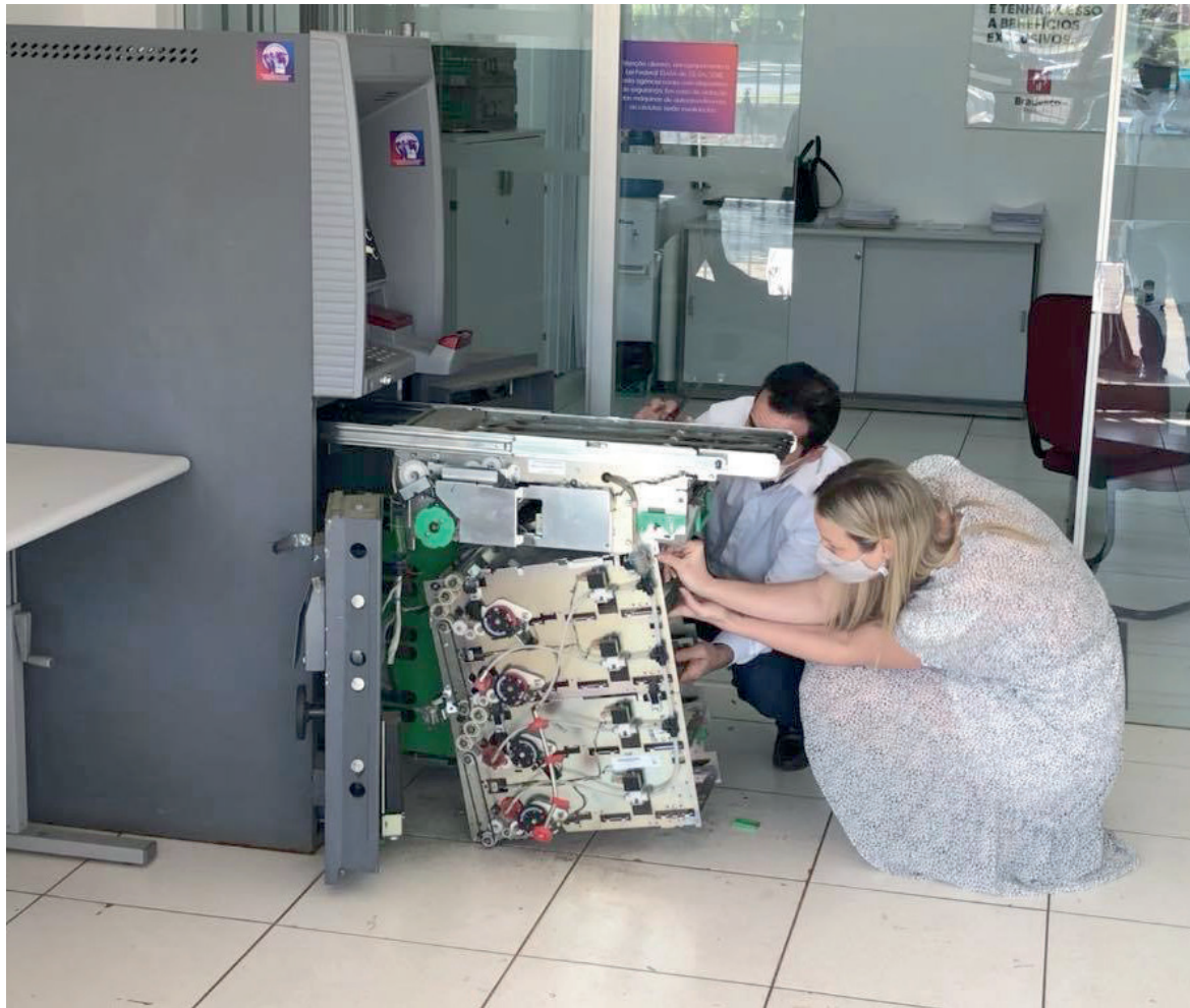
Gerentes da agência de Maria Helena verificaram ontem de manhã os estragos deixados pelos bandidos

Moradores da pequena cidade de Maria Helena (município localizado a 22 quilômetros de Umuarama), que chegaram à agência do Bradesco, em busca de dinheiro para saque no caixa eletrônico, tiveram que procurar os correspondentes em um mercado e duas lojas do município. O equipamento foi invadido e todo o dinheiro que havia em seu interior foi furtado no final de semana.