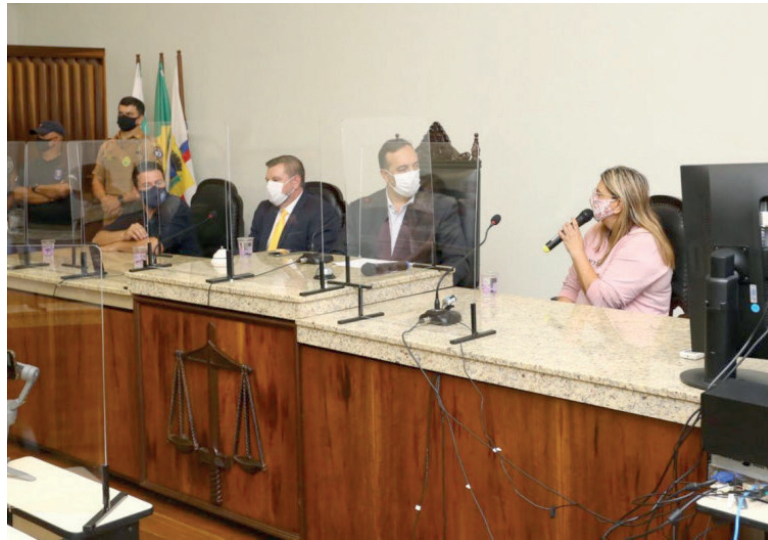
REUNIÃO da Comissão Especial de Vacinação em Apucarana. Grupo de trabalho recebeu mais de mil denúncias de possíveis irregularidades na aplicação do imunizante contra a Covid-19

O parlamentar explicou que o objetivo da Comissão é elaborar uma legislação que evite irregularidades em campanhas de vacinação nos próximos anos. “O nosso objetivo é, ao final dos trabalhos, construir uma proposta legislativa de todos os deputados para fechar os gargalos que foram identificados, pois