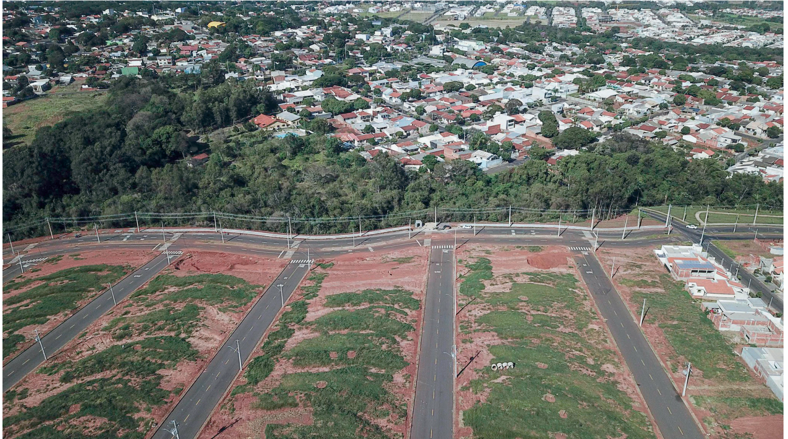
A EVOLUÇÃO do setor imobiliário contribui para sustentar o desenvolvimento de Umuarama

Sob a gestão do prefeito Celso Pozzobom foram aprovados/reprovados 29