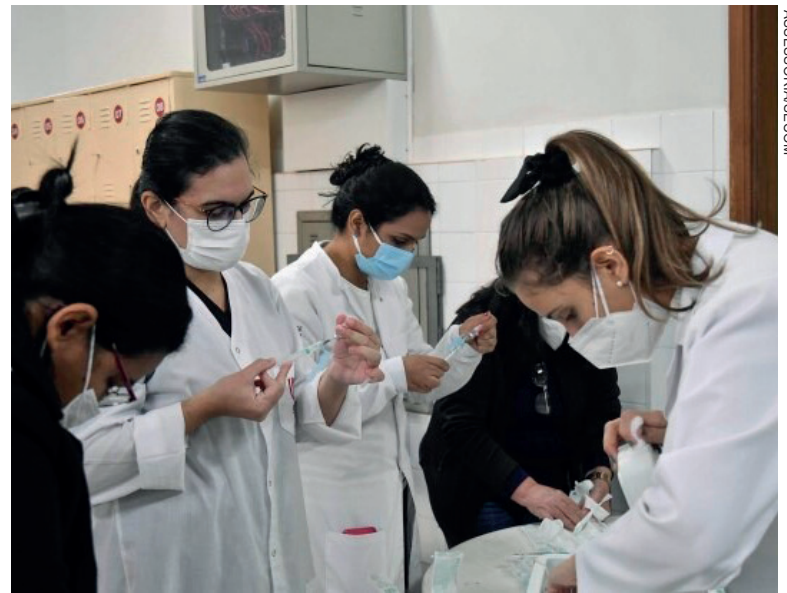
COM a primeira dose aplicada em 59.107, mais as 2.492 que tomaram a dose única, números representam que 72,5% da população adulta da cidade já foi parcialmente imunizada

Os grupos com maior número de pessoas totalmente imunizadas é o de 65 a 69 anos, com 4.164, seguido pelo de pessoas com 70 a 74 anos (3.301), 60 a 64 anos (3.188), 75 a 79 anos (2.376) e de trabalhadores em serviços de saúde (1.879). Já os grupos mais vacinados apenas com a primeira dose, continua o de pessoas com 60 e 64 anos (4.489), seguido pelo de pessoas com comorbidades (5.144), com 45 a 49 anos (4.942), com 50 a 54 anos (4.889), com 40 a 44 anos (4.865), com 65 a 69 anos (4.822) e com 55 a 59 anos (4.371).