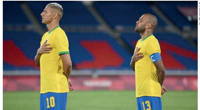
Honrado por disputar a competição, em suas próprias palavras, Dani Alves afirmou que o torneio olímpico é maior até que a Copa do Mundo

“Não existe patriotismo no nosso país, infelizmente. Se existisse, nossos grandes ídolos, nossa grande história, seriam respeitados. O único lugar em que a história não conta muito é no nosso país. Fora dele, as pessoas respeitam muito porque sabem que a história não está ali por acaso. A história está ali porque houve grandes autores, dedicados a escrever bons capítulos no livro da história brasileira”, afirmou.