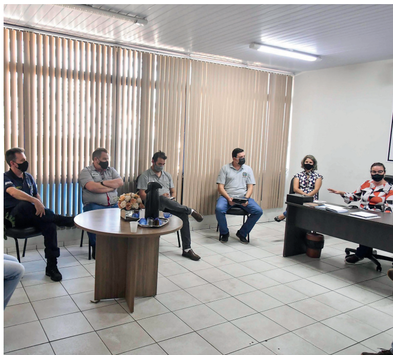
A PREOCUPAÇÃO é não deixar essa população exposta às baixas temperaturas, embora o acolhimento em abrigos tenha de ser voluntário