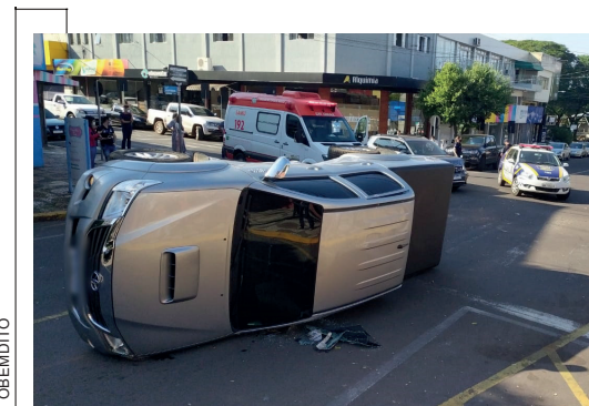
Um acidente de trânsito terminou em tombamento na manhã de ontem (26) no centro de Umuarama. Uma pessoa ficou ferida. A colisão, no cruzamento das ruas Ministro Oliveira Salazar e Arapongas envolveu um Volkswagen T-Cross, que seguia pela Ministro Oliveira e avançou a preferencial e uma Toyota Hilux. Com o impacto a caminhonete tombou e ficou parada no meio do cruzamento. A condutora do T-Cross, de 59 anos, ficou ferida e foi socorrida por uma equipe do Samu.

Segundo apurou a polícia, os suspeitos do crime fugiram em um veículo GM/Spin, que não foi mais localizado.