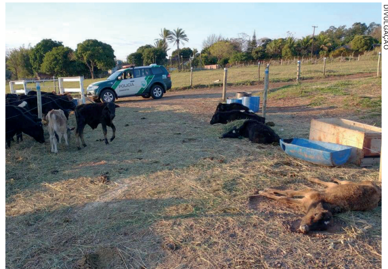
GADO não tinha pasto suficiente nem alimentação complementar. Proprietário disse que animais tinham preguiça de se levantar para se alimentar

A declaração chegou a causar espanto aos policiais e, além de responder criminalmente pelos maus tratos, através de termo circunstanciado, foi lavrado também um auto de infração ambiental no valor de R$ 15.500,00 e foi determinado ao infrator que providenciasse imediatamente a alimentação adequada aos animais.