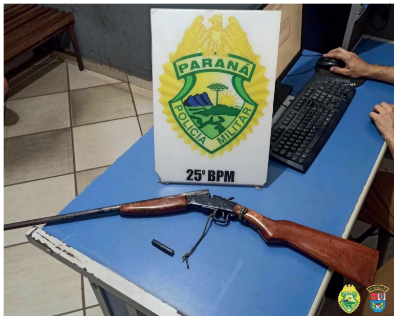
ARMA apreendida durante a confusão entre dois casais que terminou em polícia nas imediações do Centro Poliesportivo

A amiga que presenciou as agressões tentou defendê-la e, por sua vez, também foi