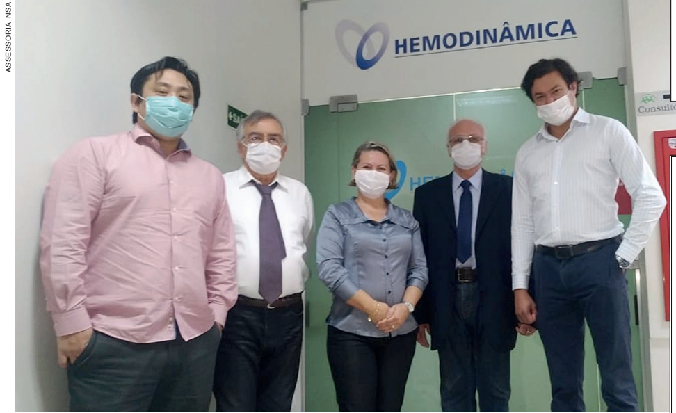
Médicos e autoridades participaram da recepção

O clima ameno e ensolarado do último sábado e domingo (24 e 25), em plenas férias de julho, contribuiu para a boa visitação nas Cataratas do Iguaçu. O principal atrativo do Parque Nacional de Foz do Iguaçu registrou o terceiro melhor final de semana do ano, confirmando a retomada do turismo de Foz do Iguaçu. Em números, 8.869 pessoas visitaram as Cataratas - 3.808 no sábado e 5.061 no domingo. Os dados se aproximam do desempenho nos dois primeiros finais de semanas de 2021 - dias 2 e 3 de janeiro, com 10.293 visitantes no feriadão da virada do ano e 13 e 14 de fevereiro, no Carnaval com 9.358 visitantes. Agende-se, Foz te espera.