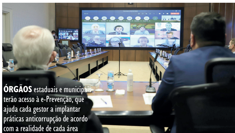
ÓRGÃOS estaduais e municipais terão acesso à e-Prevenção, que ajuda cada gestor a implantar práticas anticorrupção de acordo com a realidade de cada área

Os projetos sonhados e demandados pela população do Paraná são inúmeros e de grande alcance social. Os de urbanização, que incluem