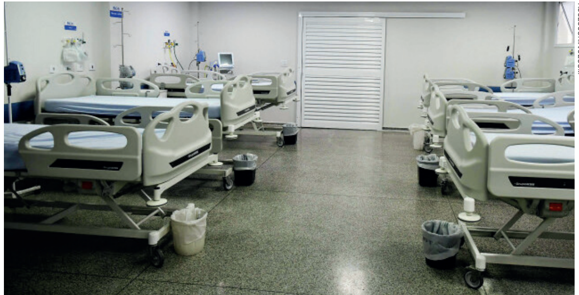
EMBORA o número de casos indique tendência de queda na ocupação de leitos, autoridades alertam que não é momento de relaxar

Embora o número de casos indique tendência de queda, com redução também na ocupação de leitos hospitalares, as autoridades alertam que ainda não é o momento de relaxar porque existe a possibilidade de novas ondas da covid-19. “Há receio de que um surto possa ser causado pela variante delta, inclusive com a previsão de nova onda em agosto. A vacina é a melhor prevenção contra covid-19, mas não se pode descuidar das medidas. Continuaremos fiscalizando, com o apoio da Guarda Municipal e da Polícia Militar”, completou Franzimar.