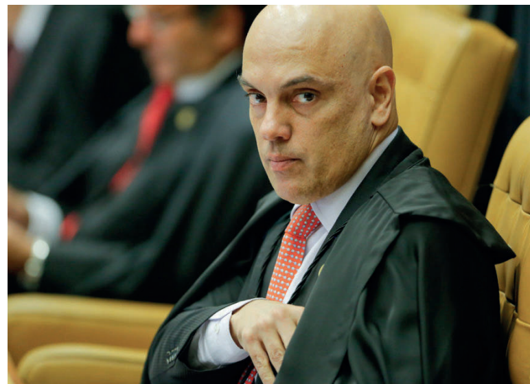
REMUNERAÇÃO mínima foi acordada entre Petrobras e trabalhadores em 2007

Porém, funcionários da Petrobras foram à Justiça do Trabalho alegando que a estatal não estava calculando os valores corretamente, pois considerava adicionais pagos aos trabalhadores, não apenas o salário-base. O TST concordou com a