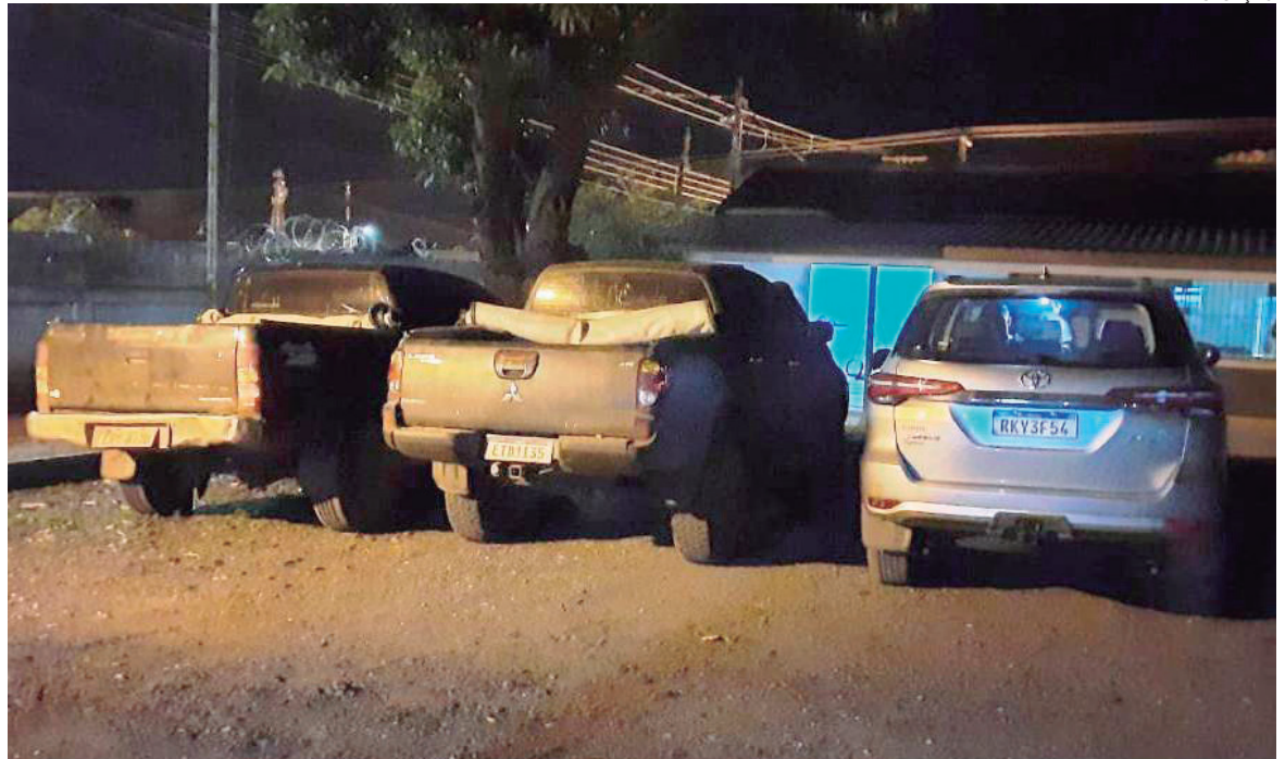
VEÍCULOS recuperados foram levados à Delegacia de Icaraíma e uma pessoa foi autuada por receptação

No local eles encontraram o automóvel e falaram com o morador sobre a denúncia. O homem disse que o veículo era de um amigo e que ele estava apenas guardando. Contudo, não soube dizer o nome do suposto amigo e também não informou a procedência do veículo.