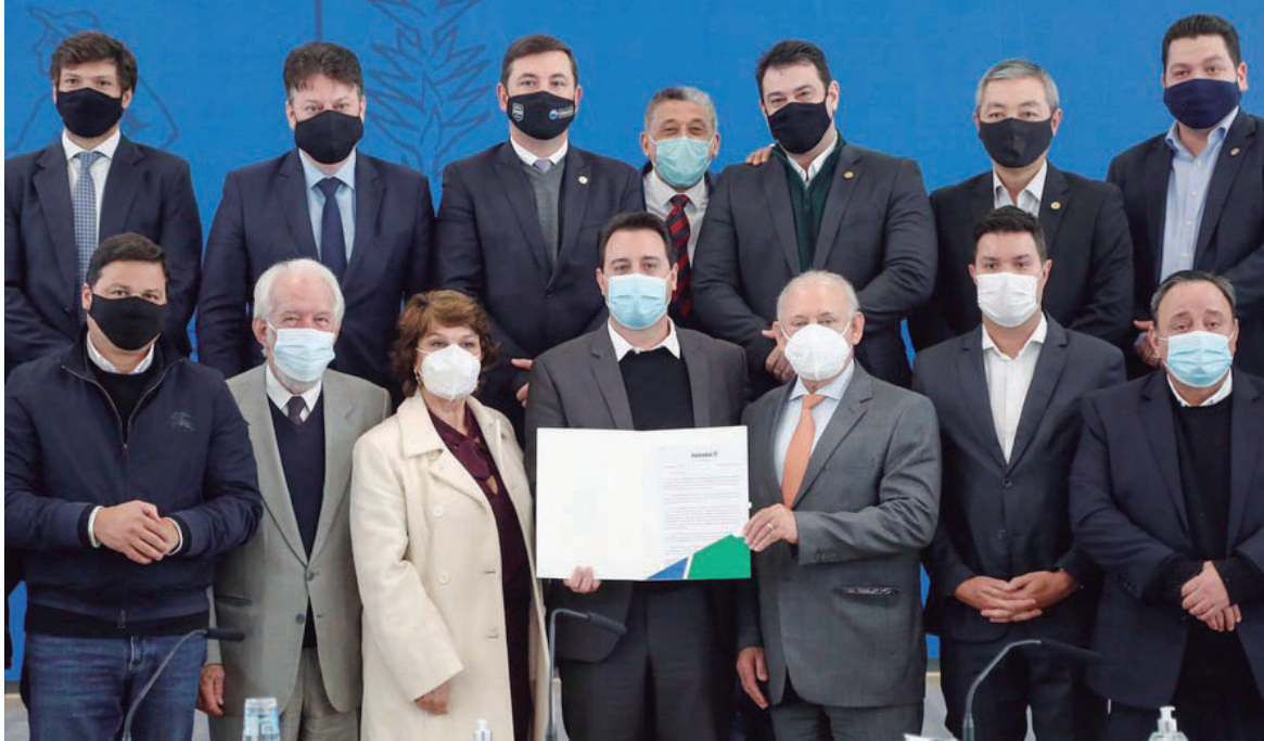
GOVERNADOR Carlos Massa Ratinho Junior apresenta o Plano de Concessões de Rodovias durante reunião com deputados estaduais

O Paraná já possui um novo modelo para a concessão dos 3.368 quilômetros de rodovias que cortam o Estado. O governador Ratinho Jr afirmou ontem (4), que o Governo do Estado e o Ministério da Infraestrutura fecharam uma proposta final: o modelo de menor tarifa, sem limite de desconto e com garantia de obras a partir de um seguro-usuário.