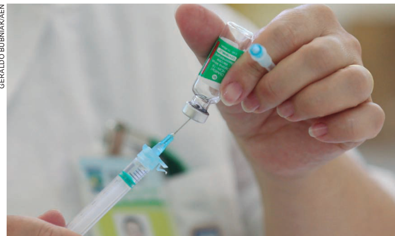
A multa varia de R$ 5.754,50 a R$ 57.545,00 para quem burlar a ordem de vacinação