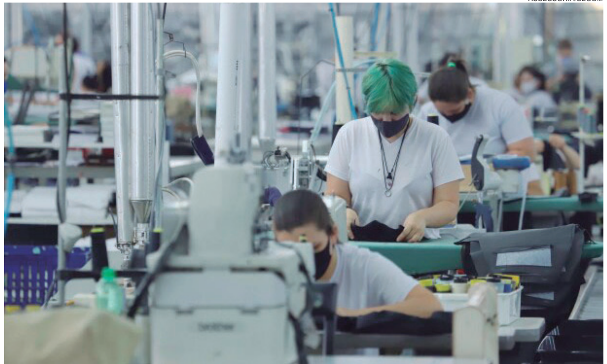
O Estado possui 216 Agências do Trabalhador e nos últimos meses, a de Umuarama está em destaque na geração de empregos

Os resultados se devem à confiança dos empregadores na economia do município, expandindo o corpo funcional das empresas ou abrindo novos negócios, e também ao trabalho da agência, que tem sido efetiva na seleção de currículos e