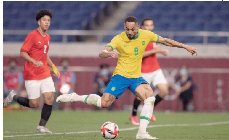
ATLETA sofreu contratura muscular na coxa esquerda na partida contra o Egito, válida pelas quartas de final das Olimpíadas