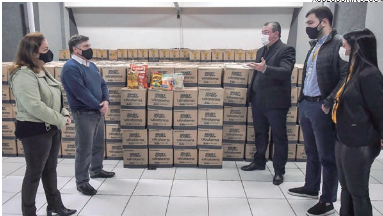
ESTA foi a primeira doação de alimentos que a assistência social de Umuarama recebeu de empresas, em 2021