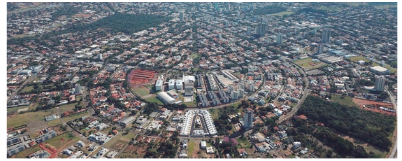
SOMENTE o IPVA rendeu ao município de Umuarama neste ano R$ 20.894.545,72

O Fundo de Exportação resultou num aporte de R$ 10 milhões nos cofres municipais, enquanto os royalties de petróleo somaram R$ 211 mil em repasses no mês de julho.