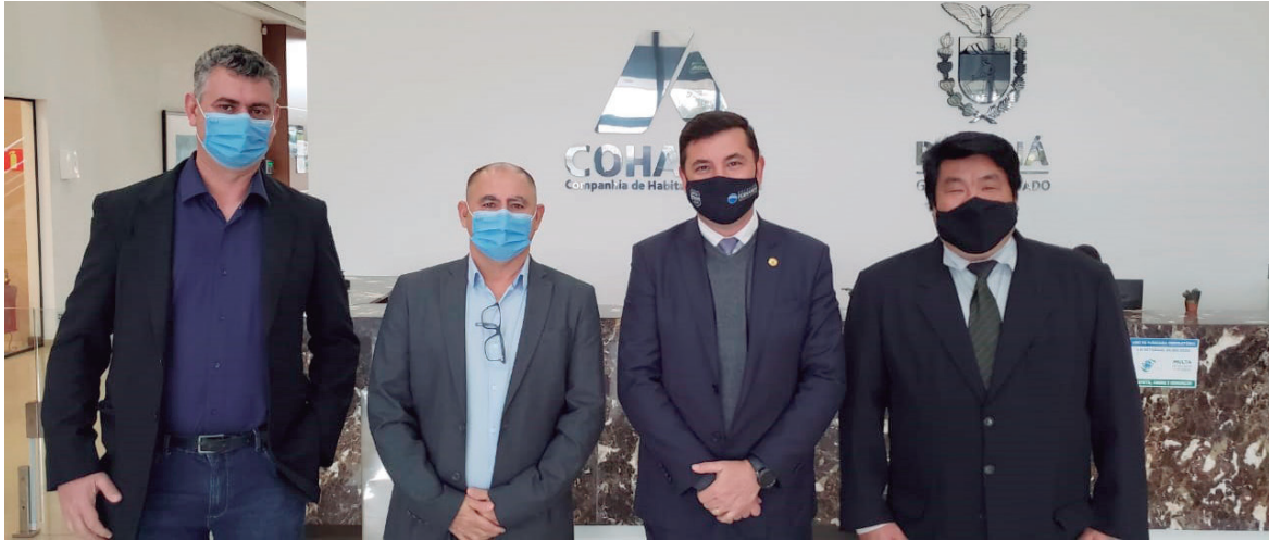
LADEADO pelo prefeito, vice e vereador de Douradina, deputado Fernando Martins intermediou negociação para implantação do sistema Casa Fácil

O Deputado Estadual Delgado Fernando Martins (PSL) acompanhou representantes dos municípios de Cidade Gaúcha e Douradina, no Noroeste do Paraná, em reuniões na Companhia de Habitação do Paraná (Cohapar), na última quarta-feira (4).