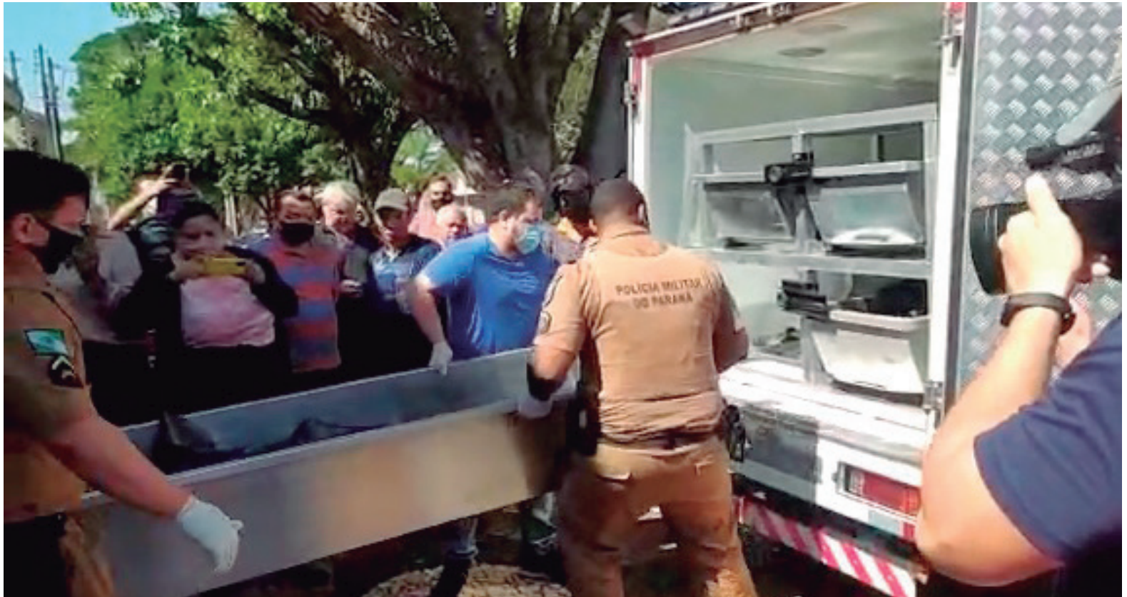
CORPOS foram recolhidos ao IML depois que peritos coletaram vestígios que devem auxiliar nas investigações

A primeira pessoa a encontrá-los, foi a empregada doméstica, que chegou, por volta das 8h para trabalhar e se deparou com a casa toda ensanguentada. Imediatamente ela procurou a ajuda de vizinhos que