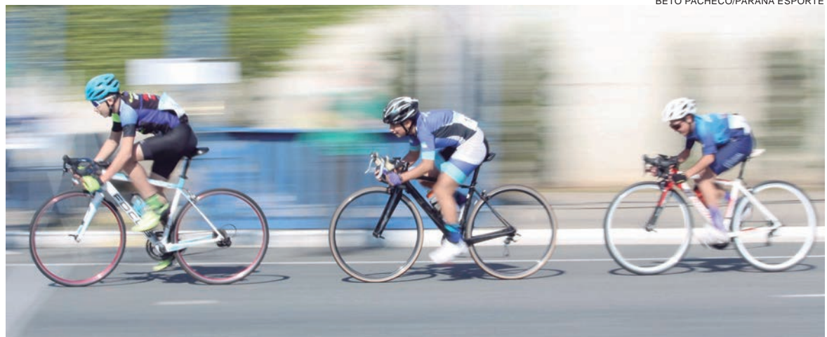
A 67ª edição dos JEPS foi marcada pelas disputas presenciais do ciclismo, em Araucária, e do tênis de mesa, em Toledo