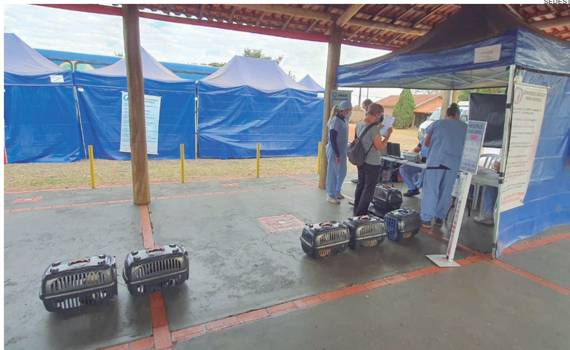
EM sete cidades do Noroeste, animais estão sendo beneficiados com o Programa Permanente de Esterilização de Cães e Gatos

do Norte, Bom Sucesso do Sul, nos dias 10 e 11, Terra Rica, no dia 10, Nova Esperança, no dia 11, Marilena e Loanda, no 12, receberão o programa.