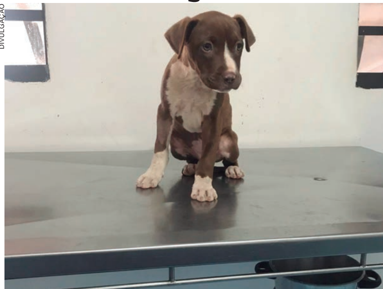
O cão sem raça definida foi levado para tratamento veterinário na SAAU com ferimentos na genitália

Durante a abordagem e a averiguação, os policiais constataram que o cachorro possuía um ferimento na região da genitália. Na tentativa de justificar o morador relatou que o cachorro havia pulado o muro de sua residência e invadido o quintal, pois sua cachorra estava no cio.