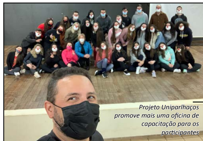
Projeto Uniparlhaços promove mais uma oficina de capacitação para os participantes

A coordenação do projeto providenciou um certificado de participação nesta oficina.