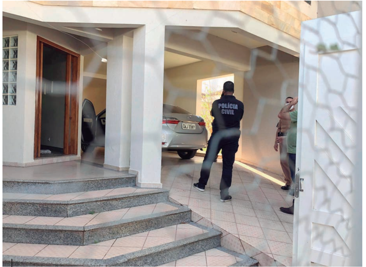
COLETA de provas fortaleceram a hipótese que levou à prisão do marido de uma das vítimas

flagrante e permanece à disposição da Justiça. De acordo com o delegado Gabriel Meneses, as provas coletadas durante as investigações fortaleceram a acusação e por isso foi tomada tal decisão.