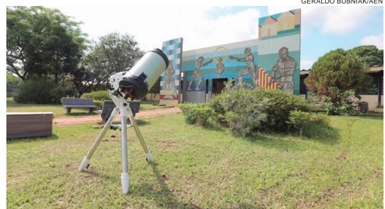
OS descerramentos das placas marcaram as celebrações dos 30 anos do Câmpus Regional de Goioerê da UEM e da inauguração do curso de Física Médica

Em 2011, diante da necessidade de expandir a oferta das graduações, foram criados mais dois cursos presenciais: Licenciatura