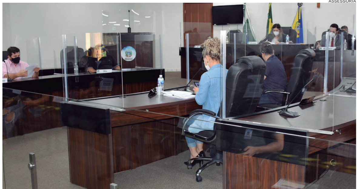
ALÉM do convite ao prefeito, comissão convocou também ex-procurador jurídico do município