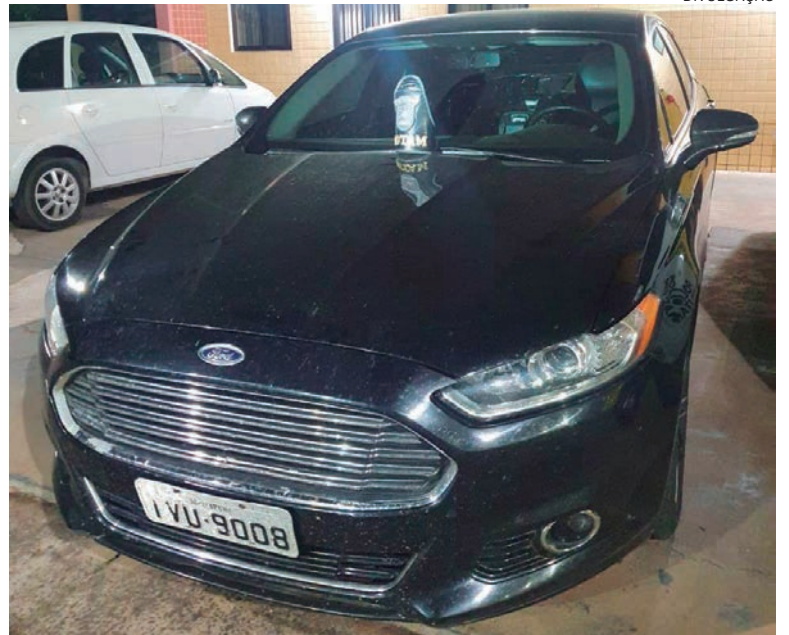
DONA da casa onde o veículo estava não soube dizer aos policiais que o deixou em sua garagem

Um veículo Ford Fusion foi apreendido pela Polícia Militar de Umuarama no final da noite da segunda-feira (9). As equipes do grupo Rotam do 25º Batalhão de Polícia Militar apreenderam o carro, que estava preparado para ser utilizado no transporte de mercadorias ilícitas. A ocorrência foi registrada no bairro Jardim Alvorada.