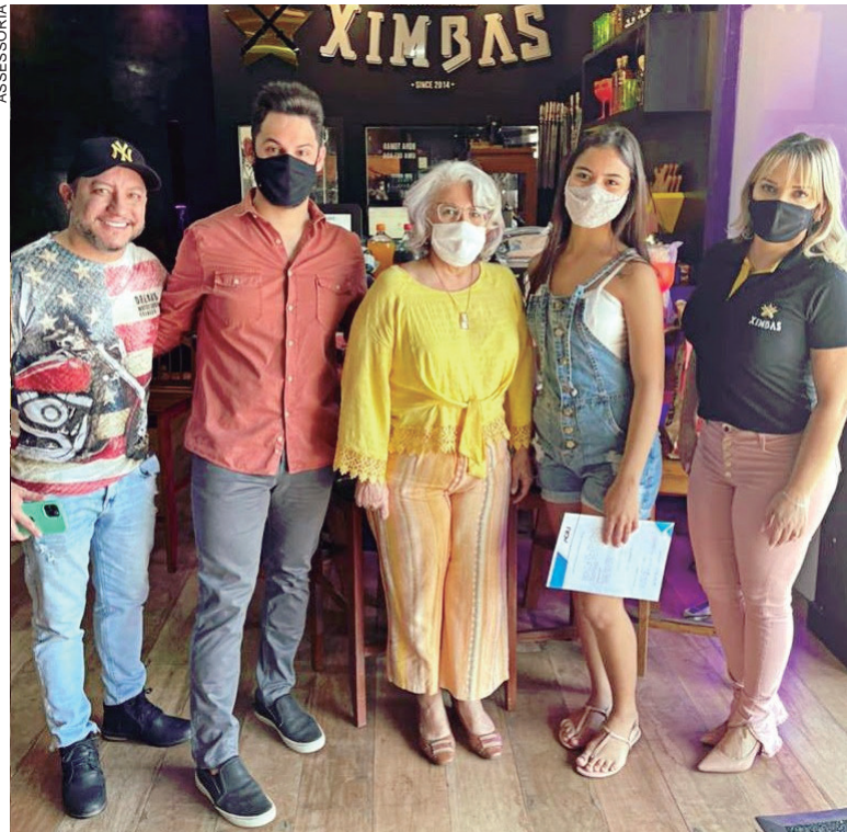
CAMPANHA que sorteuo kit churrasco completaço obteve dezenas de milhares de impressões e mais de 11 mil comentários

A Aciu agradece a todos que participaram de uma de suas promoções com maior engajamento, com dezenas de milhares de impressões e mais de onze mil comentários.