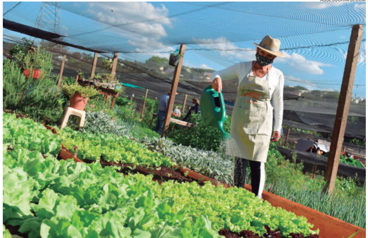
PROGRAMA incentiva criação de hortas comunitárias em terrenos situados sob linhas de transmissão e distribuição de energia elétrica

A reunião acontece a partir das 13h30, na Rua Francisco Gonçalves de Macedo, 3449, com as presenças do gerente