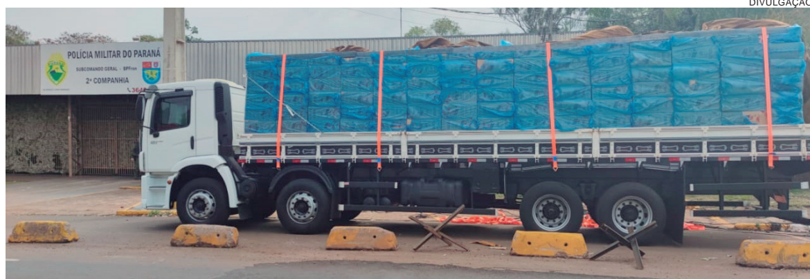
CAMINHÃO carregado com cigarros foi averiguado em Altônia e apreendido com a carga

Mas quando averiguaram a carga que estava abaixo da lona, descobriram as 600 caixas de cigarros contrabandeados. O veículo e o cigarro contrabandeado foram apreendidos e encaminhados para as providências de praxe.