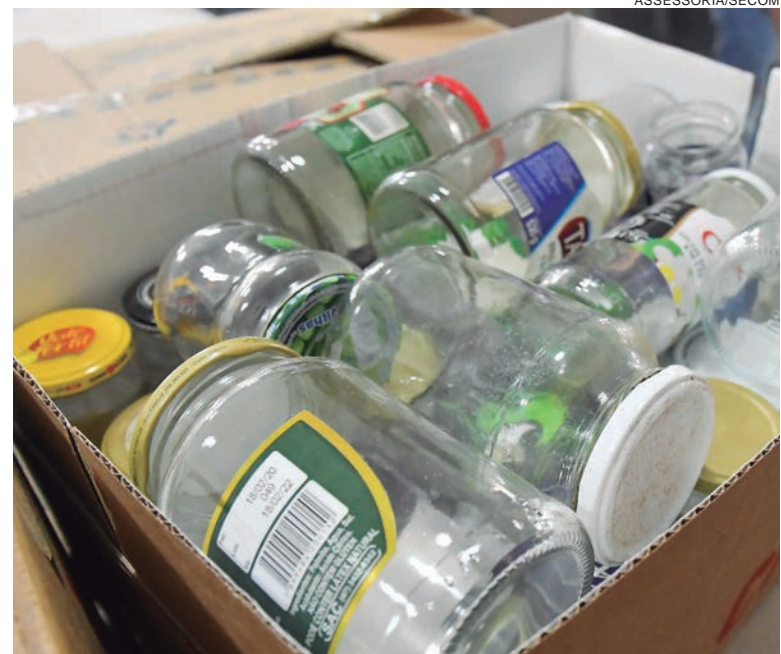
O Posto de Coleta fica no Norospar e os interessados em continuar contribuindo podem doar em qualquer uma das unidades básicas de saúde do município

Em Umuarama, gestantes e puérperas recebem apoio de profissionais de saúde – médicos, enfermeiras, nutricionistas, obstetras etc – em todas as UBS e quem encontra qualquer dificuldade no processo de amamentação, será atendida de forma especial. O Posto de Coleta de Leite Materno de Umuarama funciona dentro da Maternidade Municipal e hoje capta 60 litros por mês.