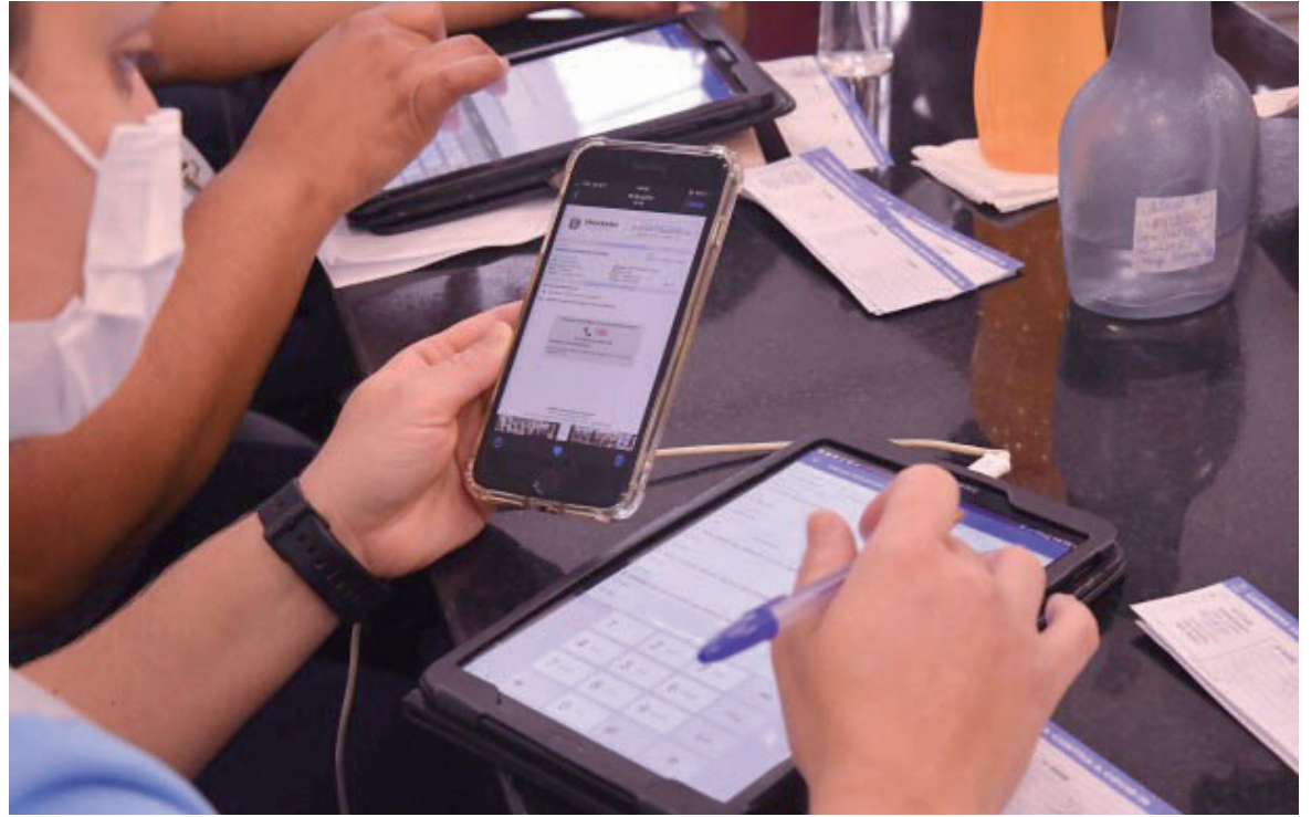
AGENTES de Saúde acompanham números repassados pelo município à Secretaria de Saúde do Estado que reenvia os dados aos municípios

A ocupação dos leitos exclusivos para tratamento da doença, disponibilizados pelo SUS (Sistema Único de Saúde), é controlada pela Macrorregional de Saúde, em