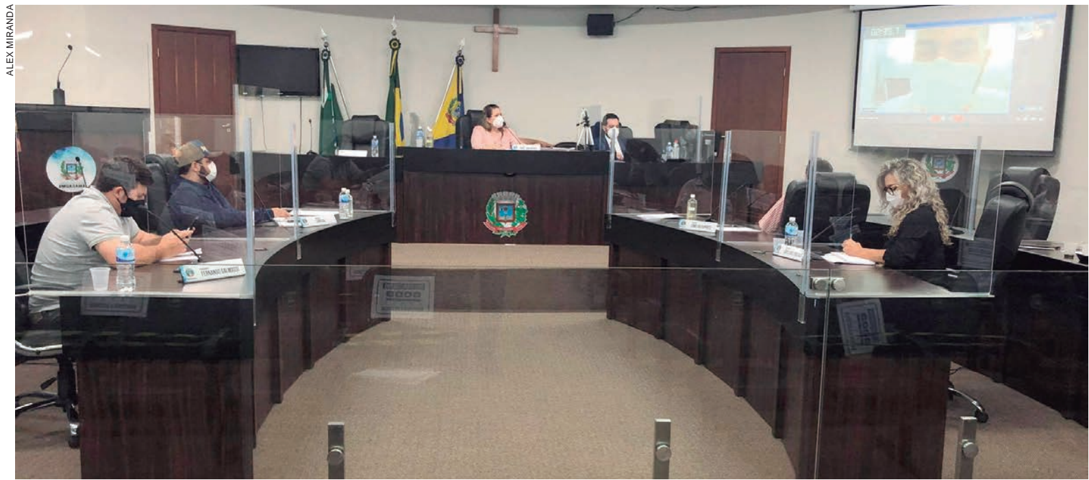
CONTADOR foi ouvido através de videoconferência, pois está preso no Complexo Médico Penal em Curitiba

Referidos serviços eram prestados para o município no atendimento aos casos de covid-19, por meio de recursos oriundos do Fundo Municipal de Saúde, responsável por