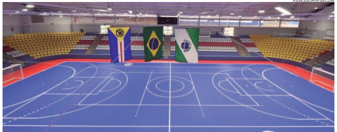
SMEL será responsável pela gestão disputas na cidade, que, devido à pandemia de coronavírus, não poderá receber torcida

Na etapa dos Jogos da Juventude do Paraná, que está em sua 33ª edição, Umuarama vai sediar