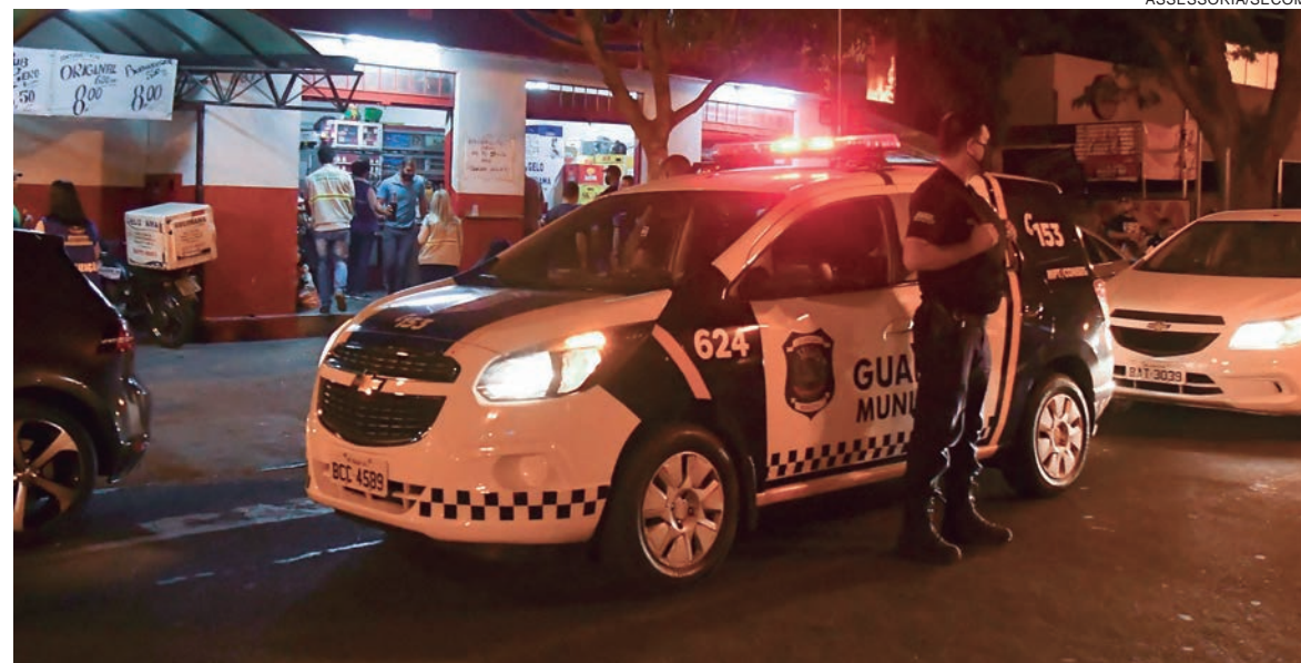
DIVERSAS notificações foram emitidas aos estabelecimentos que foram flagrados descumprindo as recomendações dos decretos

Por meio da Vigilância Sanitária e com o apoio da Guarda Municipal e da Polícia Militar, a Prefeitura de Umuarama segue com a fiscalização do cumprimento às medidas de enfrentamento à pandemia de covid-19, especialmente nos finais de semana. Nos últimos dias, diversas notificações e infrações foram emitidas contra estabelecimentos comerciais que descumprem as recomendações dos decretos do município e do governo do Estado. Além disso, as aglomerações voltar a ficar frequentes na região central.