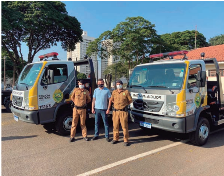
O presidente da Comissão de Segurança Pública na Alep ressaltou a importância de investimentos na área da segurança e no corpo policial

Em seu discurso no evento, o parlamentar e presidente da Comissão de Segurança Pública na Assembleia Legislativa ressaltou a