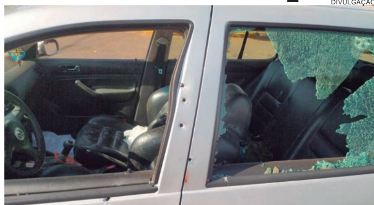
GOLF que era conduzido pela vítima foi crivado de balas em plena tarde