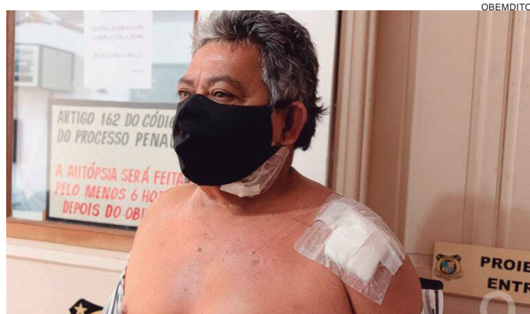
GOLPES que acertaram o pescoço e o ombro passaram bem perto de terem atingido a artéria carótida comum da vítima