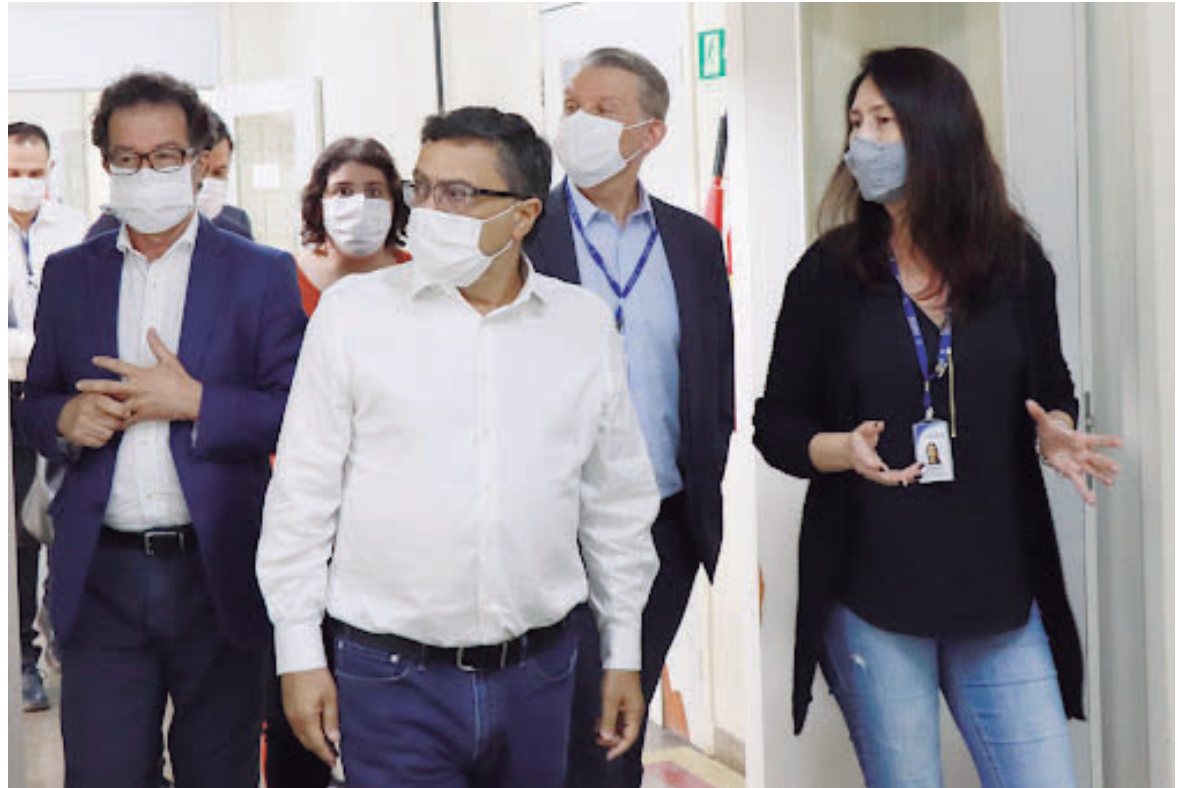
COORDENADOR da Frente Parlamentar do Coronavírus da Alep lembra que a estimativa da Abeoc-PR, é de que as perdas do setor, chegam aos R$ 25 bilhões

protocolos a serem adotados. “Esses eventos estabelecem parâmetros, em conjunto com os órgãos de saúde, para definir um protocolo específico para cada tipo de atividade, e assim, acelerar a retomada dos eventos, setor que está paralisado desde o início da pandemia”, disse. “Estão fazendo com quatro segmentos da área de eventos: shows/festivais, esportes – inclusive o futebol, feiras corporativas, e também a área de eventos sociais, como jantares, formaturas, casamentos, batizados, etc. Em comum acordo com as entidades que representam esses setores e a Vigilância Sanitária, foram produzidos protocolos para, através de chamamento público, escolher as empresas e os eventos para aplicar esse evento-modelo”, explicou.