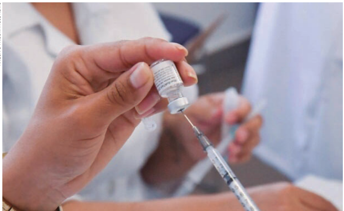
EM 17 meses de pandemia, 38.779 pessoas procuraram as unidades básicas de saúde e no Ambulatório de Síndromes Respiratórias

De acordo com a Macrorregional de Saúde, em Maringá, nos hospitais locais com alas exclusivas para o tratamento da covid-19, das 64 enfermarias existentes, 21 estão ocupadas (32%), bem como 14 dos 37 leitos de UTI (38%).