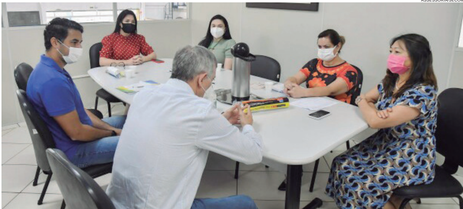
SECRETÁRIA de Saúde afirma que o controle da segunda dose é feito de maneira bastante minuciosa e as vacinas ficam disponíveis na data anotada na carteirinha

Ela chama a atenção também para o fato de muitas