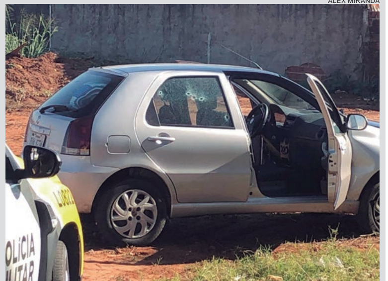
VEÍCULO alvejado com disparos havia sido tomado de assalto pelo criminoso com a ajuda de um comparsa