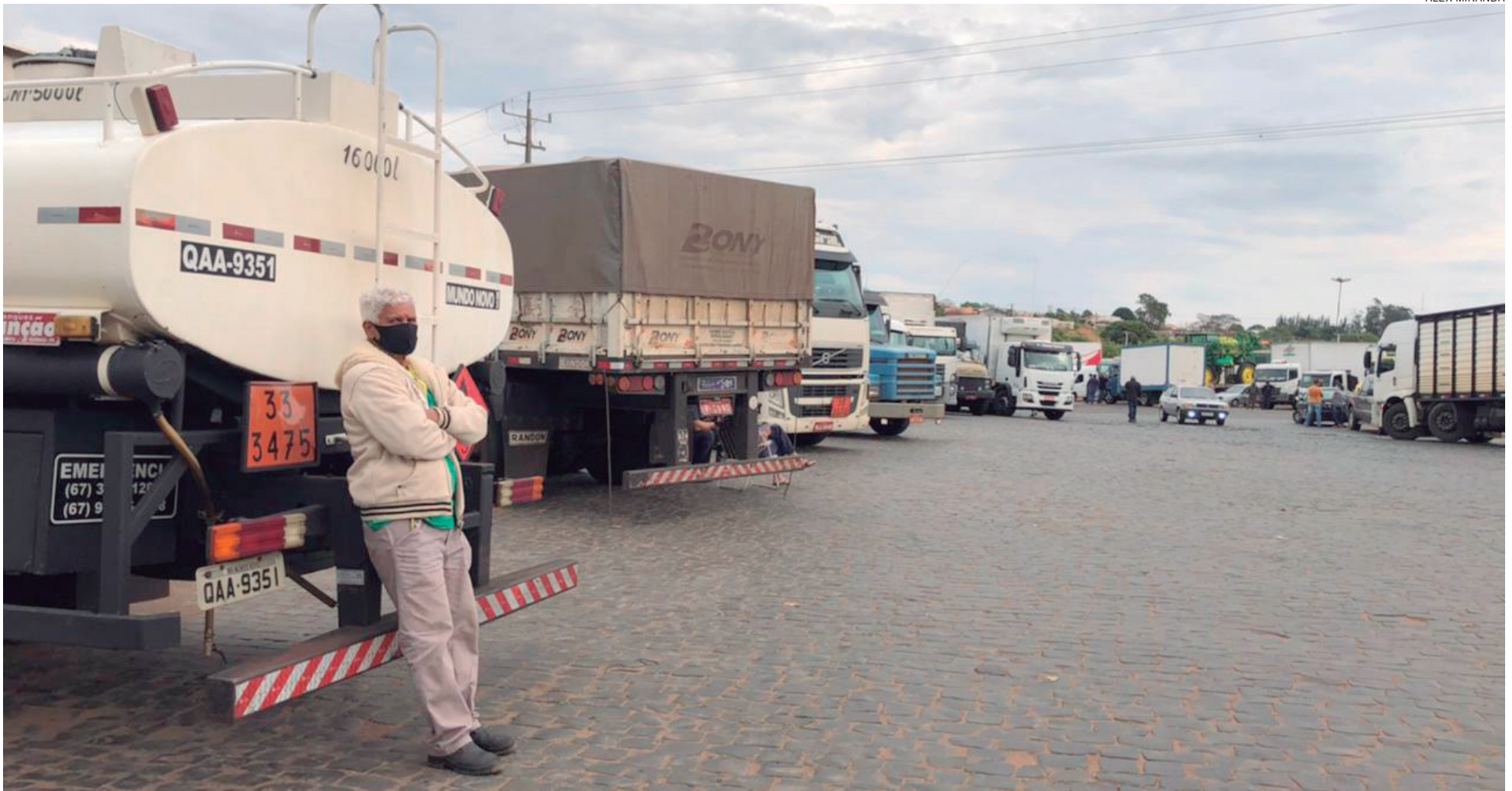
O pátio do Posto Cruzeiroão, na PR-323 em Cruzeiro do Oeste ficou lotado de caminhões impedidos de cruzar o bloqueio. Manifestação foi pacífica

Bloqueios nas rodovias da região noroeste do Paraná seguiram durante a tarde de ontem (quinta-feira, 9), quando grupos de manifestantes começaram a impedir a passagem de todos os caminhões que não estavam transportando cargas perecíveis. Também foram liberados carros baixos, ônibus e ambulâncias. Segundo os organizadores, o movimento está se fortalecendo e hoje (sexta-feira, 10), existe a probabilidade de que o fechamento das pistas seja total.