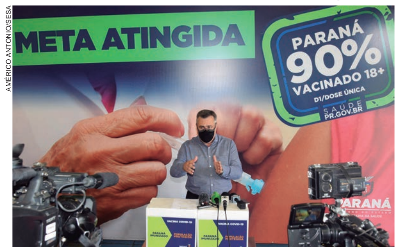
BETO Preto aponta que a vacinação dos adolescentes e o reforço em vulneráveis irá aumentar o escudo imunológico contra a doença no Estado

A administração da dose reforço ou 3ª dose foi orientada pelo Ministério da Saúde na nota técnica nº 27/2021.