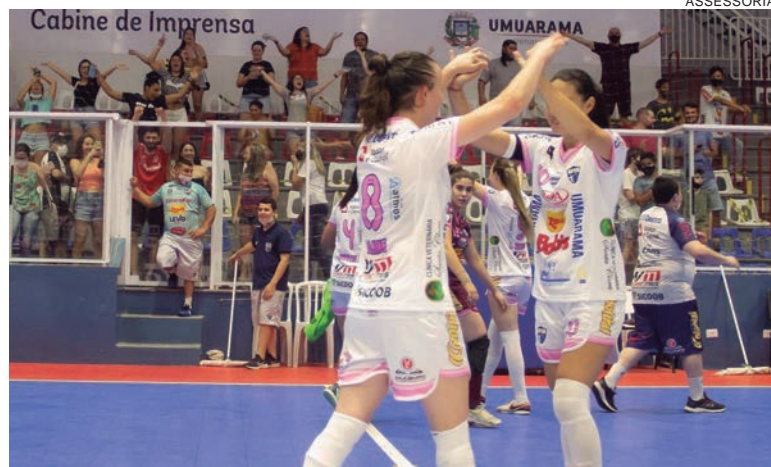
MENINAS do Futsal comemoram o empate no último segundo de jogo junto com a torcida que fez a festa no Vierão

Se passar por estas duas muralhas do futsal paranaense, o Umuarama Futsal Fem segue pra semifinal e o jogo será no Vierão, com a presença da torcida.