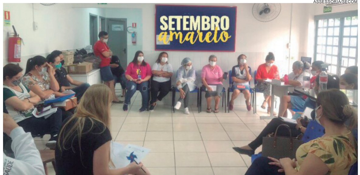
SECRETARIA realiza treinamentos e capacitações profissionais, retomando o processo de matriciamento no atendimento à população

Ela conta que especialistas e autores da área destacam a necessidade de integração da Saúde Mental ao cotidiano das práticas da Atenção Básica, como forma de cuidar da saúde do cidadão de forma integral. “Neste contexto, de união de forças em todas as frentes de atendimento em saúde, o matriciamento surgiu como uma estratégia para fazer valer essa articulação, para garantir um cuidado ampliado à saúde, por meio do diálogo entre os diversos profissionais que trabalham diretamente na manutenção da saúde dos cidadãos”, detalha.