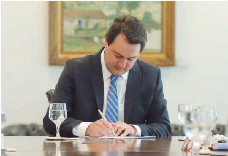
A nova regra foi assinada pelo governador Ratinho Junior e aponta detalhes sobre as liberações e o que segue proibido durante a pandemia

O texto prevê excepcionalidade para a realização de concursos públicos e demais processos seletivos. A realização de eventos esportivos com