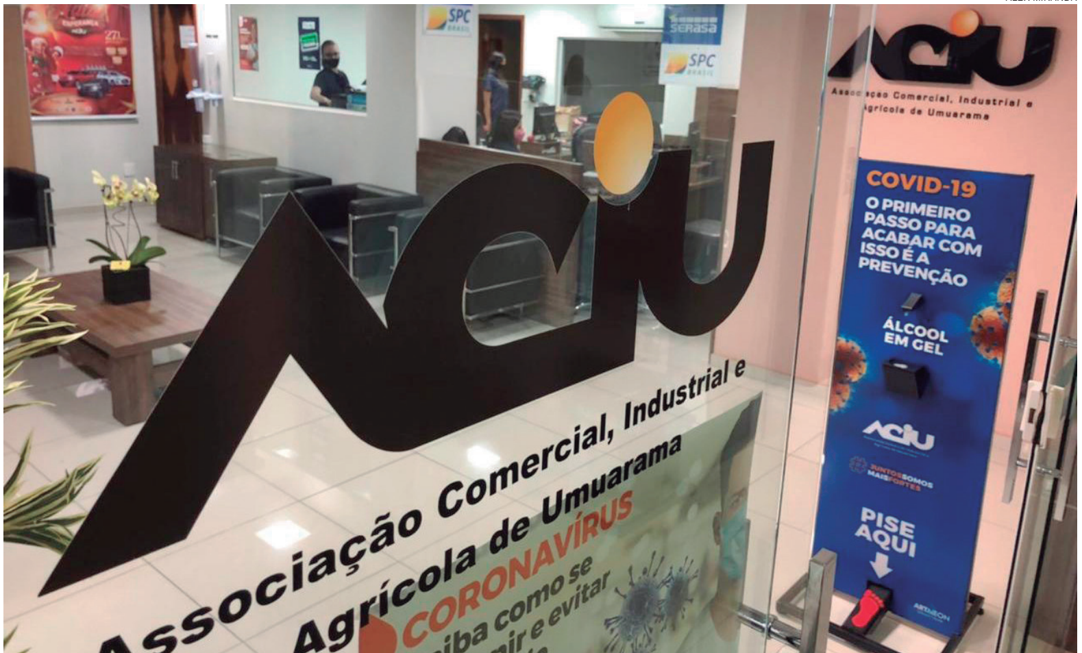
ASSOCIAÇÃO Comercial firmou parceria com a atual administração municipal para eventos e campanhas, com destaque para a decoração natalina

“A associação tem uma atuação que é exemplo para as demais entidades do Estado,