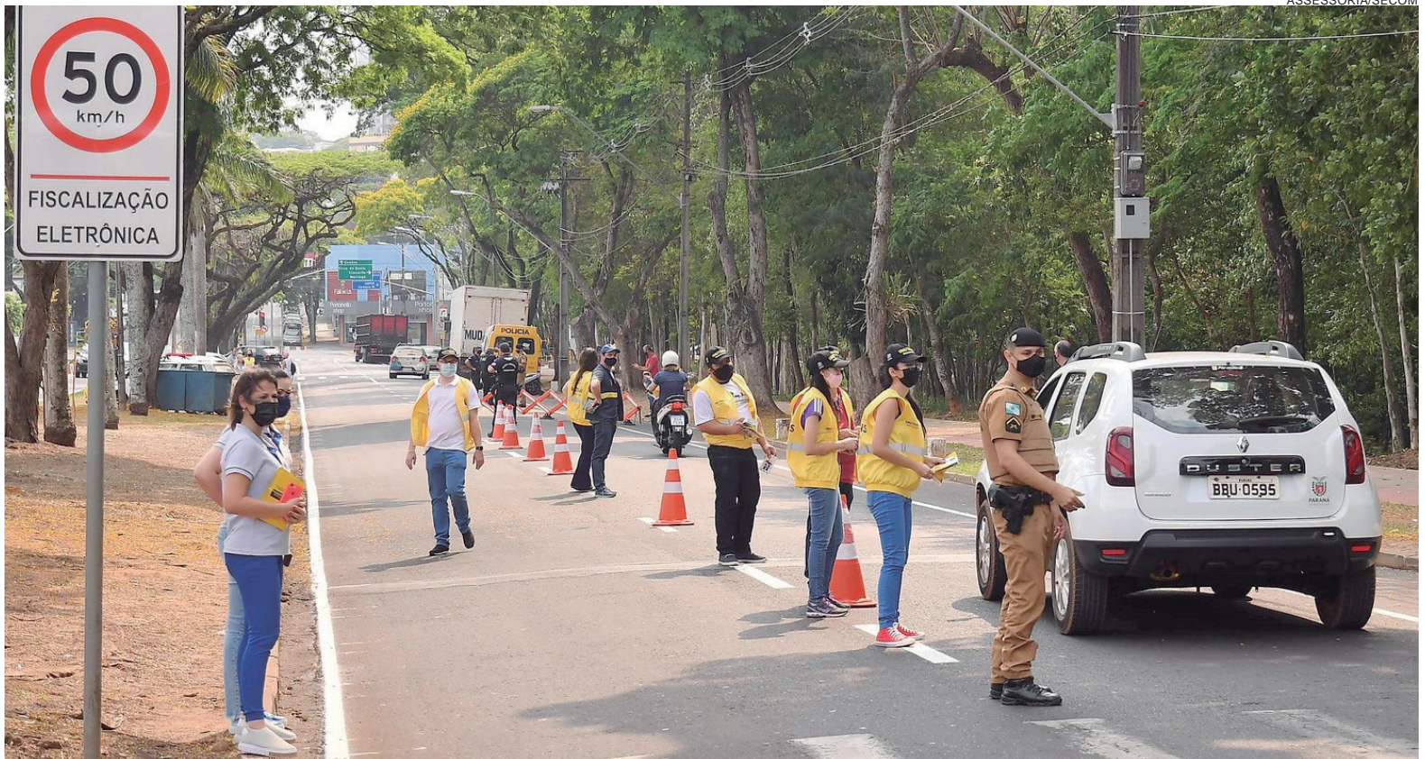
A semana tem um foco específico neste ano nos motociclistas, pois representam a maior parcela no número de vítimas de acidentes automobilísticos

Determinada pelo Código de Trânsito Brasileiro, a semana tem um foco específico a cada ano e em 2021 os motociclistas