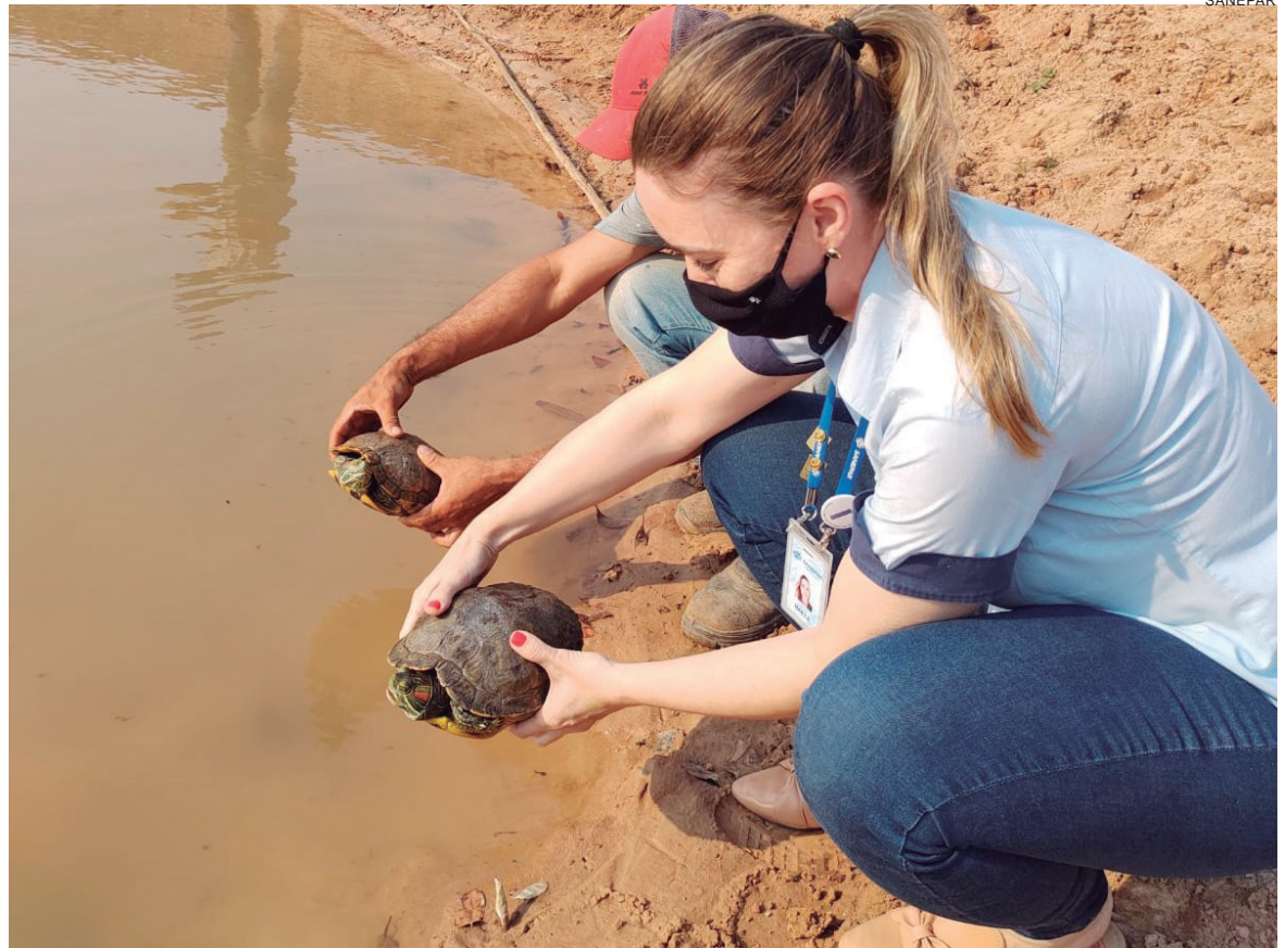
A espécie era vista com frequência no local, mas com a desativação da lagoa, a água baixou e as tartarugas começaram a ficar presas na lama