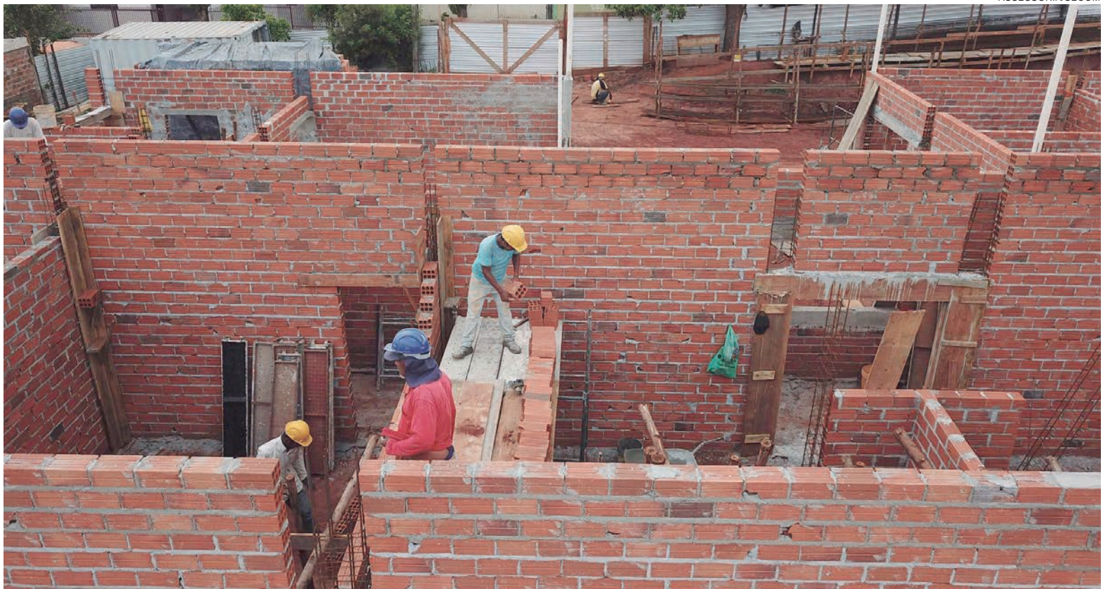
NOS últimos dois meses, o volume ficou bem acima da média dos últimos cinco anos, que oscilou entre 19.450 m 2 a 21.262 m 2

Segundo o prefeito, o bom desempenho é sinal de que os investidores continuam apostando no desenvolvimento de