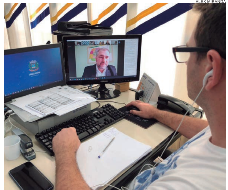
GESTORES e servidores da Prefeitura de Umuarama acompanharão o evento 'Licitações na Prática' na modalidade presencial conectado

Até o final do ano, estão previstas mais duas capacitações, cobrindo assim os 399 municípios do Paraná. O público-alvo são procuradores municipais, secretários de administração, pregoeiros, gestores e fiscais de contratos, membros de comissões de licitação e de sistemas de controle interno, além de micro e pequenos empresários da região que tenham interesse em fornecer bens ou serviços à administração pública.