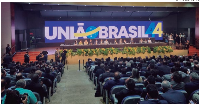
CONVENÇÃO realizada ontem em Brasília decidiu pela fusão e determinou quem toda as decisões do partido

dois partidos, as direções do DEM e do PSL se reuniram separadamente para aprovar a fusão. O diretório do DEM do Rio Grande do Sul foi o único a votar contra a fusão. No PSL, a decisão foi unânime.