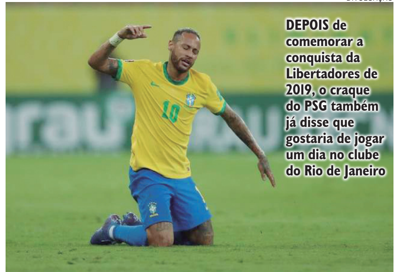
DEPOIS de comemorar a conquista da Libertadores de 2019, o craque do PSG também já disse que gostaria de jogar um dia no clube do Rio de Janeiro

Recentemente, Neymar e Gabriel Barbosa agitaram torcedores do Flamengo ao interagirem no Twitter.