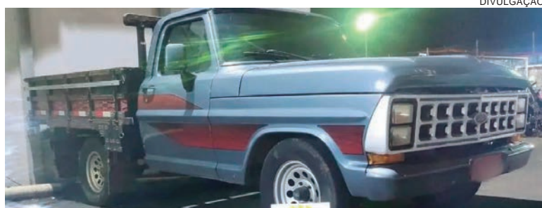
TESTEMUNHAS informaram a polícia sobre o paradeiro do veículo

O boletim de ocorrência do furto havia sido registrado