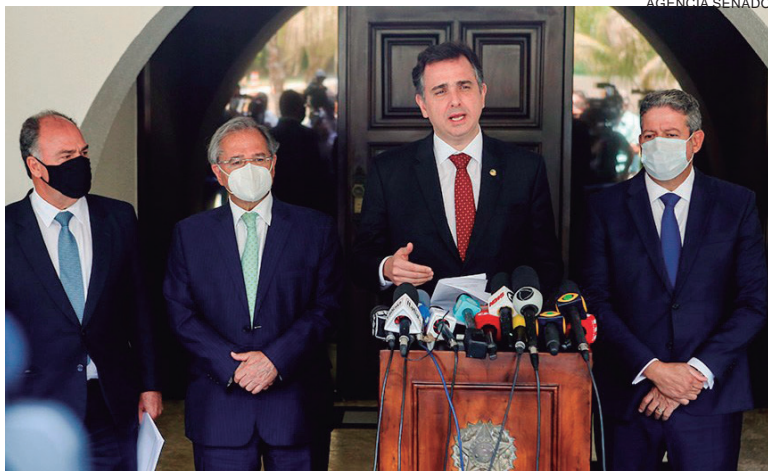
EM reunião, no dia 21/09, o presidente do Senado, Rodrigo Pacheco, o ministro da Economia, Paulo Guedes, e o presidente da Câmara, Arthur Lira (PP-AL), tentaram um acordo sobre a PEC dos Precatórios

De acordo com a IFI, com limite de gastos anuais com precatórios pelo valor de 2016 (corrigido pela inflação acumulada em 12 meses até