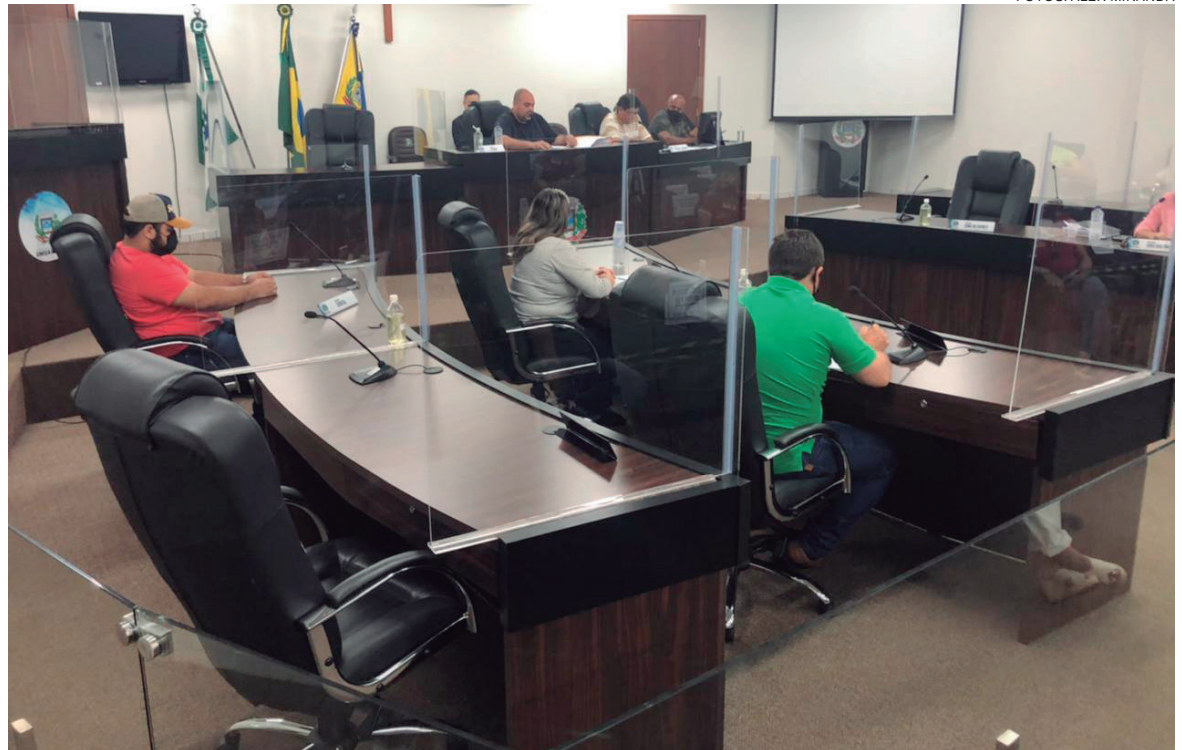
COM os trabalhos suspensos, comissão processante aguarda definição judicial na expectativa de liberação do prosseguimento dos trabalhos e oitivas