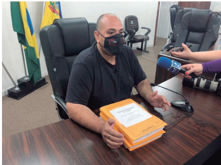
PRESIDENTE da comissão disse que apresentará à sociedade datas das oitivas e manterá “todo o trabalho às claras”