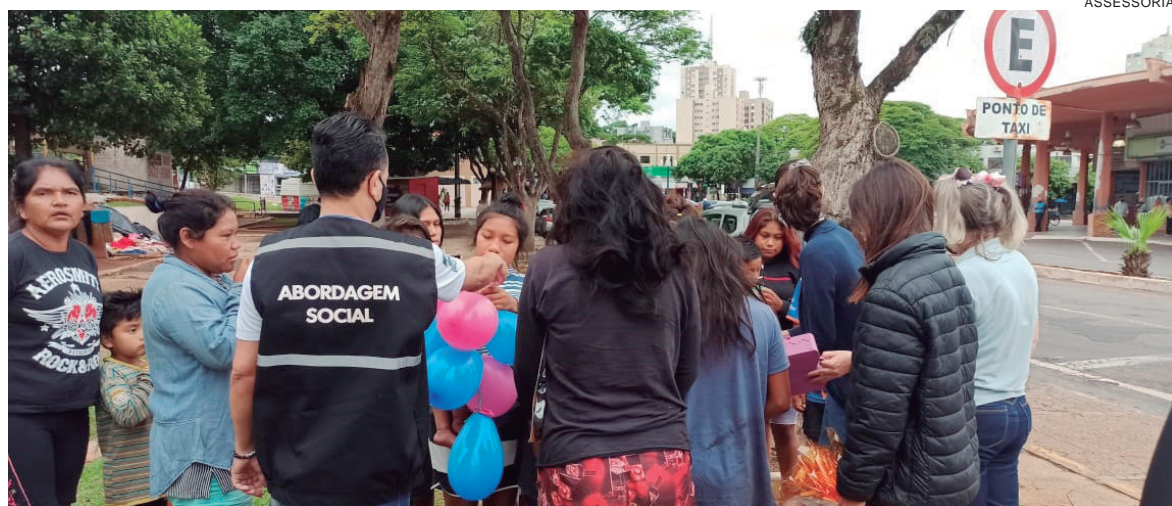
CRIANÇAS da etnia caingangue ganharam brinquedos e orientações e famílias indígenas receberam orientações das equipes

atendidas geralmente ocupam espaços abertos no entorno da Estação Rodoviária, na Praça da Bíblia e em alguns semáforos do município.