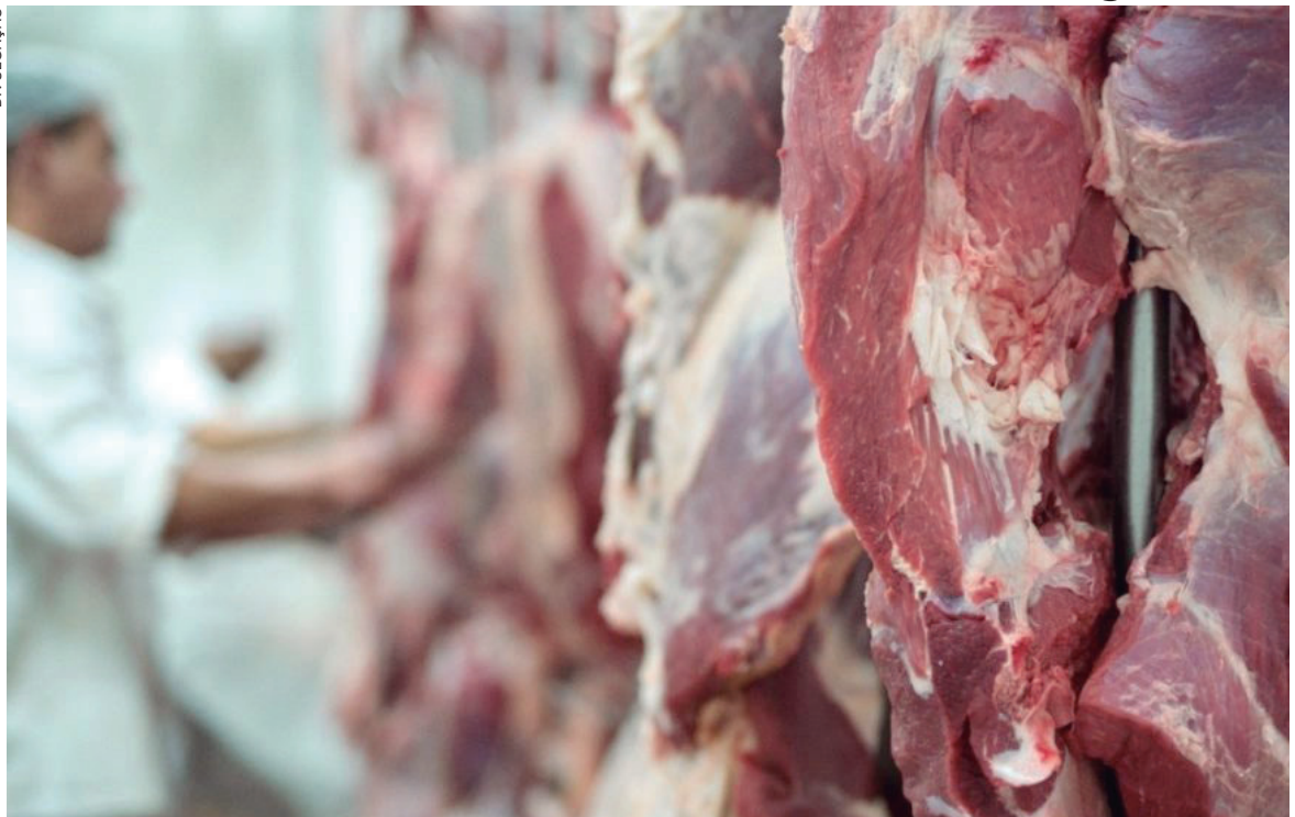
AÇOUGUES serão comunicados pra que não comercializem mais ossos ou carcaças de animais, mas que façam a doação

A inflação de setembro (1,16%), último indicador divulgado pelo Instituto Brasileiro de Geografia e Estatística (IBGE), foi a mais alta para o mês desde 1994 – no acumulado de 12 meses já atingiu 10,25%. O grupo Alimentação e Bebidas teve