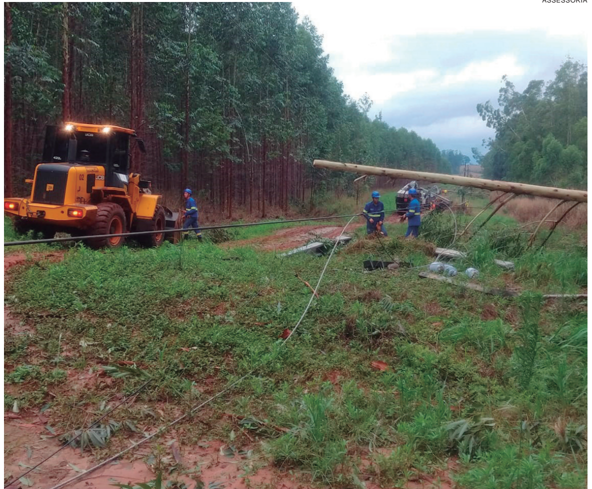
EQUIPES trabalhando na região de Moreira Sales, ontem à tarde para regularizar os serviços às unidades consumidoras que seguiam sem energia

Na região de Umuarama, os sistemas mais afetados e que ainda registravam falta de energia eram os de Francisco