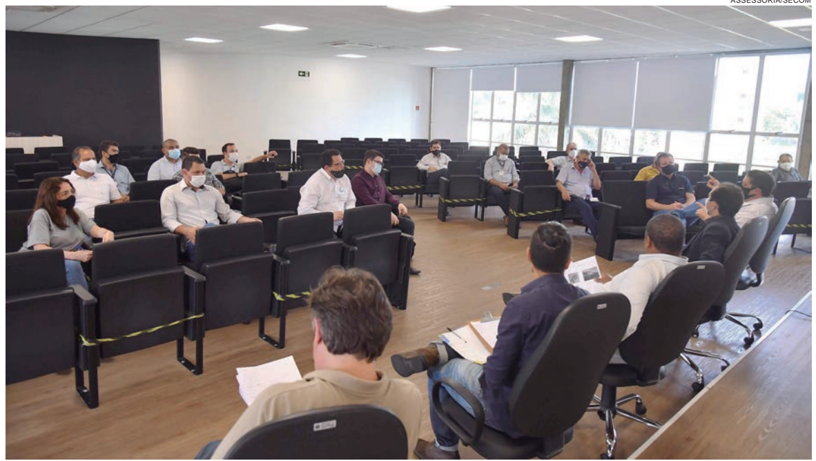
FORAM tratados os detalhes sobre as transferências das empresas responsáveis pelas linhas que atendem passageiros de Umuarama e região, inclusive as metropolitanas

Dessa forma, a rodoviária velha deixará de receber as linhas de ônibus que fazem parada atualmente. “Como a maioria dos espaços são privados, o município tem dificuldade para investimentos no local. Estudamos alternativas para tornar o espaço atrativo e seguro à população, a fim de estimular o comércio,