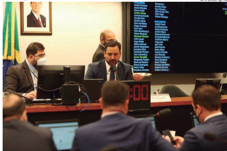
COMISSÃO especial aprovou a PEC dos Precatórios, permitindo descontos e reajuste pela taxa Selic. Texto será levado ao Plenário

Dos recursos gerados pela PEC, R$ 24 bilhões devem ser usados para o reajuste de despesas da União indexadas pela inflação e será fundamental para garantir o pagamento do Auxílio Brasil, com a previsão de R$ 400 para atender 17 milhões de famílias no ano que vem. A proposta ainda deve garantir R$ 11 bilhões para compra de vacinas em 2022.