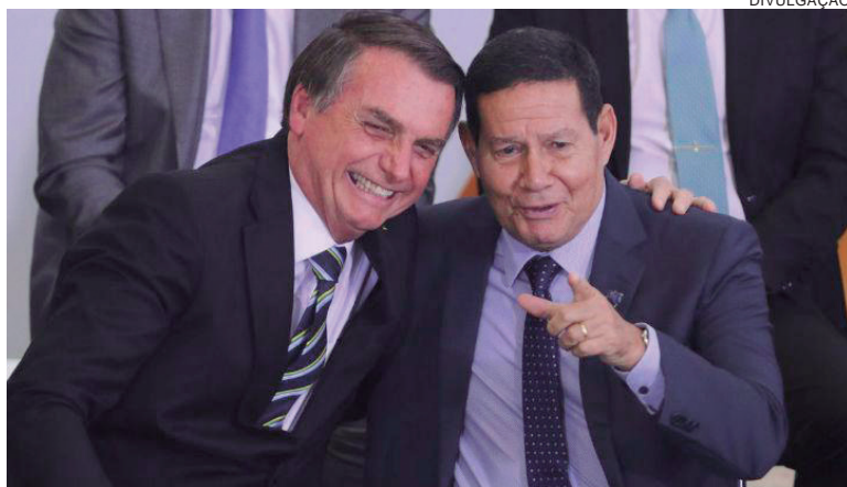
MESMO com a cassação rejeitada, o TSE reconheceu a existência de um esquema de disparo em massa de notícias falsas contra adversários da chapa

Em função desse entendimento, a maioria dos ministros aprovou, por seis votos a um, a fixação da tese jurídica para deixar explícito que há abuso de poder político-econômico caso um candidato venha, daqui em diante, se beneficiar do disparo em massa de fake news pela internet.