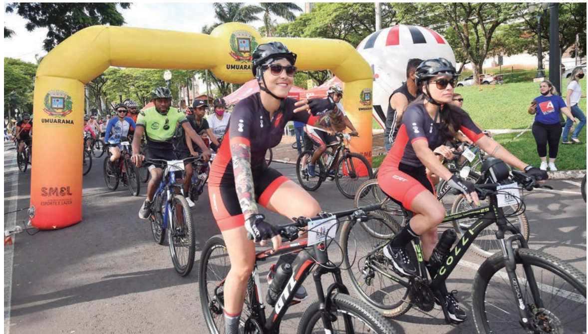
ADEPTOS aos pedais participaram do passeio que terminou com o sorteio de dezenas de prêmios na inauguração da ‘praça do ciclista’

Ele conta que a ideia do Ponto do Ciclista é oferecer um incentivo ao hábito do pedal, combater o sedentarismo e atrair ainda mais praticantes. “Queremos despertar