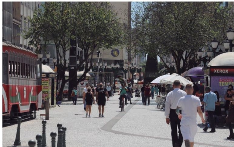
A suspensão das medidas restritivas vem com uma melhora de todos os indicadores relacionados à pandemia no Estado

Mesmo com o fim do decreto, o uso de máscara continua obrigatório em todos os espaços públicos. A medida é estabelecida pela lei estadual 20.189/2020, que institui multa em caso de descumprimento. Os valores variam entre R$ 106,60 (uma Unidade Padrão Fiscal do Paraná) a R$ 533,00 para pessoas físicas; e entre R$ 2.132,00 a R$ 10.660,00 para