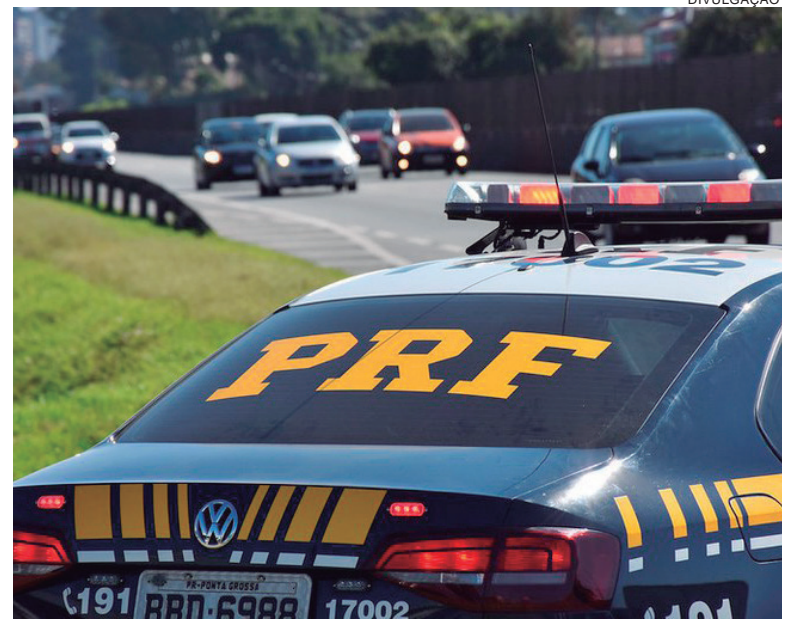
NO Paraná, metade das mortes ocorreram em colisões frontais e metade dos acidentes com mortes envolveram motocicletas

Em 2019, a operação aconteceu entre 14 e 17 de novembro (de quinta a domingo), naquele período foram 97 acidentes com 111 feridos e seis mortes.