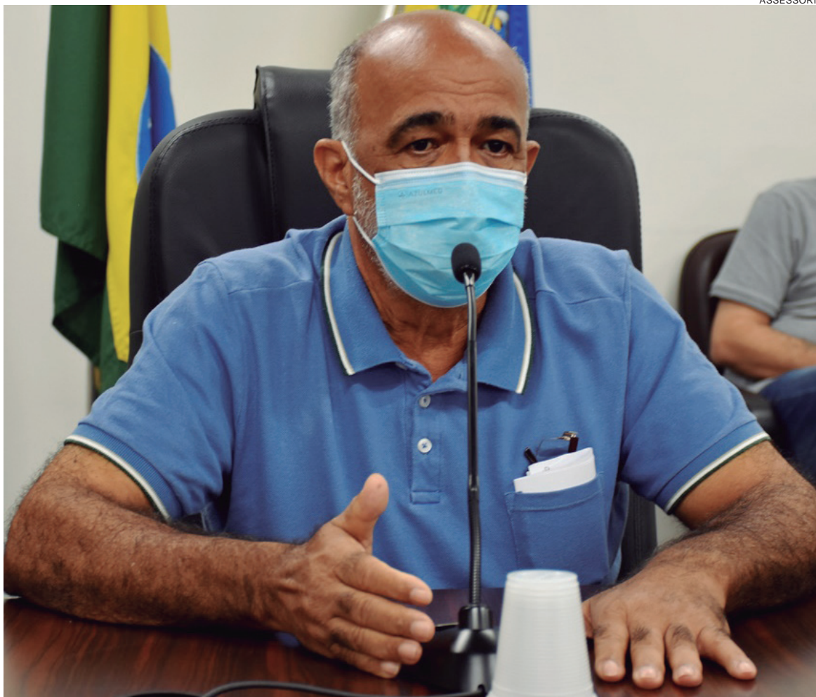
VEREADOR foi citado em trechos da investigação do Gaeco, do Ministério Público, no decorrer da Operação Metástase

Ao se pronunciar, o parlamentar disse que nunca recebeu dinheiro de instituições de Saúde que prestavam serviços ao município. Também confirmou ter se empenhando na angariação de emendas parlamentares de deputados destinadas ao Norospar, a última delas, de aproximadamente R$