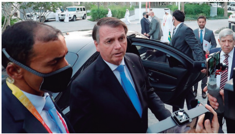
BOLSONARO quer emplacar nomes de sua confiança em Estados como São Paulo, atualmente governado pelo adversário João Doria

“Eu espero que, em pouquíssimas semanas, duas, três, no máximo, casar ou desfazer o noivado”, disse o presidente durante a Expo 2020,