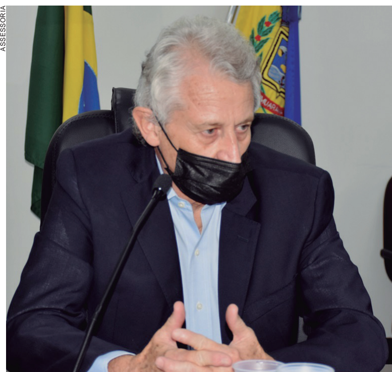
MÉDICO confirmou o recebimento de emendas parlamentares pela entidade e também disse que os recursos do Fundo de Saúde eram destinados ao pagamento de funcionários