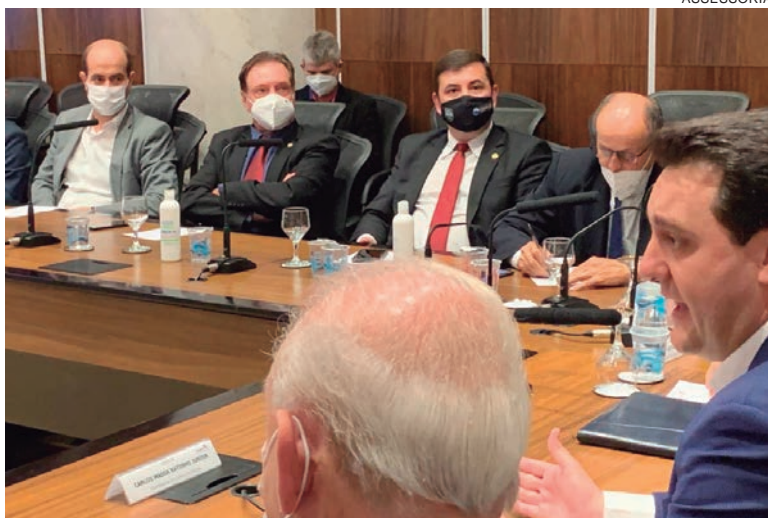
GOVERNADOR apresentou aos deputados como deverá funcionar o atendimento nas rodovias enquanto não houver pedágio

“Neste período de vacância, que envolve o processo de elaboração do novo sistema de pedágio nas rodovias do Paraná, depois com o certame para contratação da empresa que será responsável pelo pedágio, o Estado deve manter a conservação e o atendimento aos usuários. Por isso é que foi realizada esta reunião com os deputados, que conheceram como deverá funcionar este atendimento”, salienta.