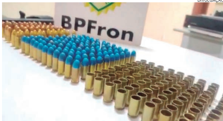
CARTUCHOS intactos e deflagrados foram apreendidos junto com pneus contrabandeados e um rádio comunicador

Durante uma ação desencadeada no domingo, (14) policiais militares do BPFron apreenderam pneus contrabandeados, munições, carregador e um rádio comunicador. O trabalho aconteceu durante um patrulhamento pela cidade de Cafezal do Sul (38 quilômetros de Umuarama), quando abordaram um homem de 29 anos em uma residência. No local foram apreendidas 154 munições de calibre 9 milímetros intactas, além de 92 estojos deflagrados e ainda 14 munições de calibre 380, intactas, um carregador com capacidade para 30 cartuchos e duas empunhaduras com um alimentador e um rádio transmissor veicular. Os policiais encontraram no