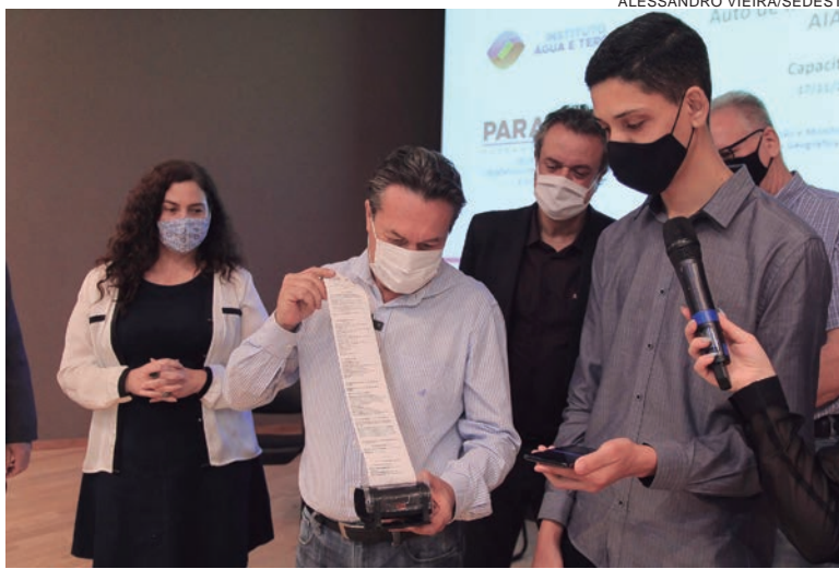
O Instituto Água e Terra lançou o aplicativo AIA-E (Auto de Infração Ambiental Eletrônico) e, com ele, fiscais irão emitir multas eletrônicas

A ferramenta foi lançada no auditório da Fiep, em