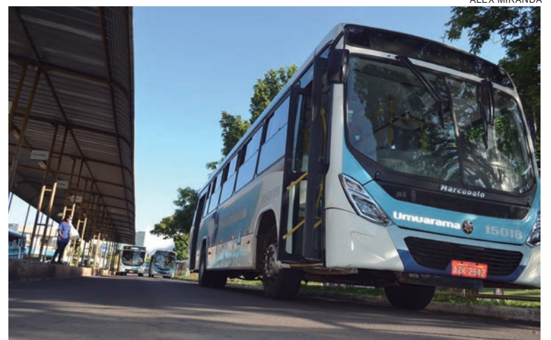
LEI obriga município a repassar R$ 70 mensais à empresa, que alega ainda não ter recebido. Este recurso serviria para o pagamento do 13º, que pode chegar a R$ 110 mil