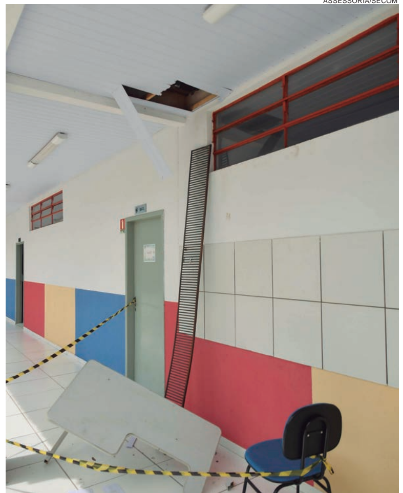
LADRÕES andaram pelo forro e estouraram uma janela para levarem fiação e um computador

Segundo a secretária, o ladrão andou sobre o forro e estragou uma boa parte dele. “É triste que essas situações aconteçam nas nossas escolas. As conquistas e melhorias são sacrificantes, exigem muito trabalho e depois a gente se depara com vandalismo e furto”, completou.