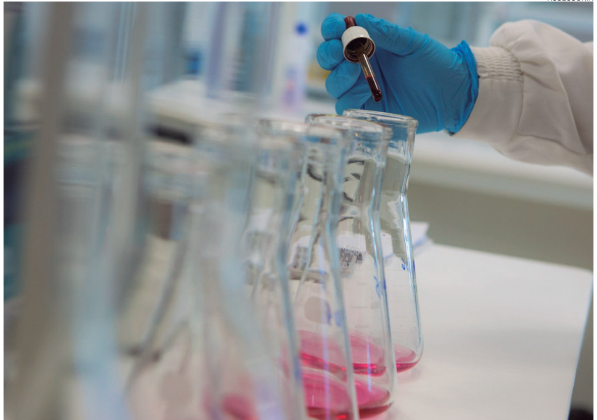
HÁ quatro anos, a Sanepar foi a primeira companhia de saneamento do País a implantar o Sistema de Gerenciamento de Informações Laboratoriais