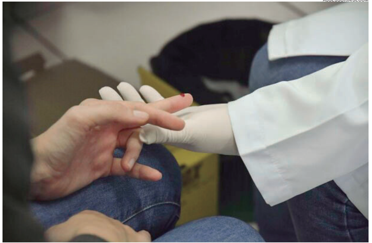
OS novos casos da doença foram confirmados durante os primeiros meses de 2021 em Umuarama