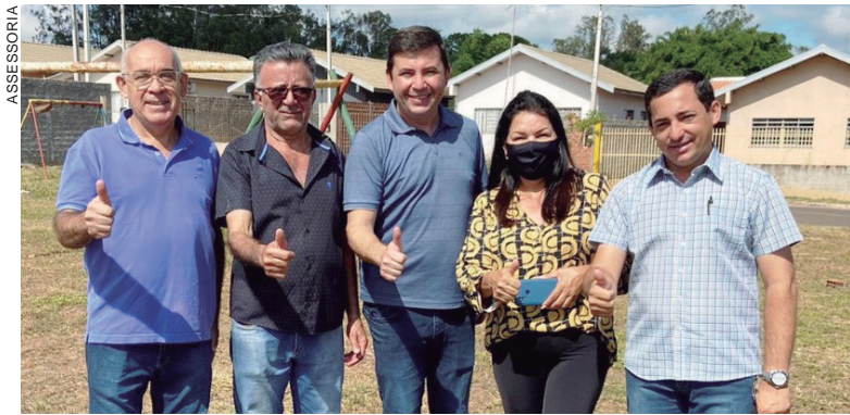
EM Maria Helena, o parlamentar visitou escolas e conheceu os problemas na área de educação

Houve a visita ainda às obras do Parque Urbano, projeto construído em área de fundo de vale, e que proporcionará a preservação do meio ambiente.