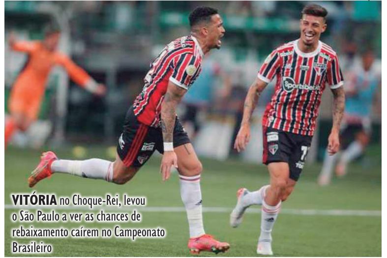
VITÓRIA no Choque-Rei, levou o São Paulo a ver as chances de rebaixamento caírem no Campeonato Brasileiro

O elenco do São Paulo se prepara para enfrentar o Athletico-PR, na próxima quarta-feira (24), às 21h30, no Morumbi. O time comandado por Rogério ceni ainda jogará contra Sport, Grêmio, Juventude e América-MG antes do fim da competição nacional.