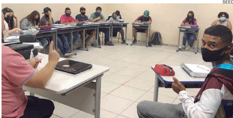
AS atividades têm o objetivo de fomentar na comunidade escolar a reflexão sobre o combate ao racismo