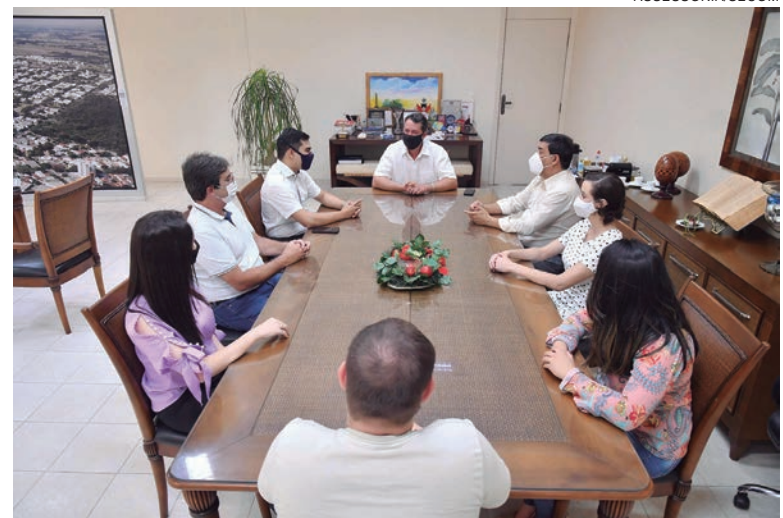
PROFISSIONAIS de Campo Mourão trocaram troca de experiências e conheceram a realidade do órgão em Umuarama, tem uma das mais modernas sedes do Paraná