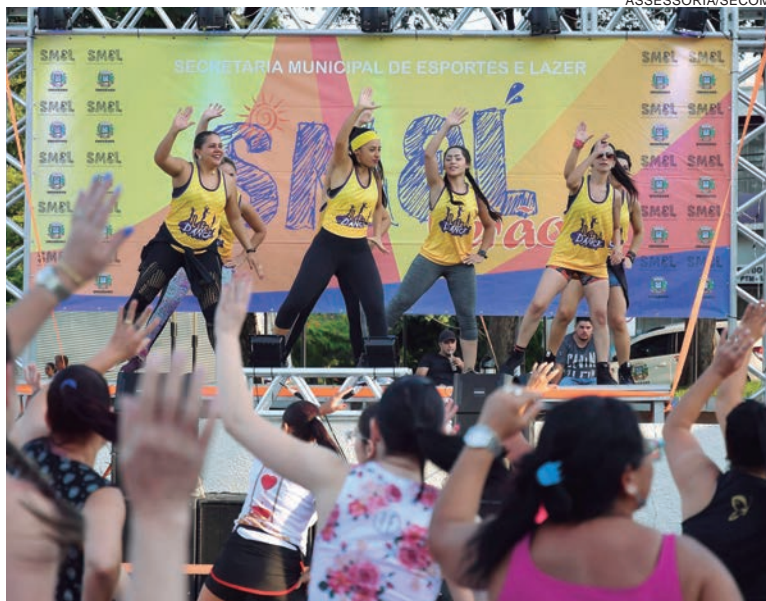
A praça, no centro comercial de Umuarama, será palco de um ‘aulão’ com vários professores do município

Durante três horas de aulas, professores renomados de Umuarama e região ministrarão a atividade num palco repleto de animação.