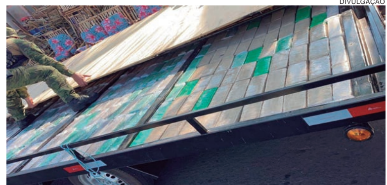
CARRETINHA apreendida em abril, tinha fundo falso, onde eram transportados os tabletes de maconha

Segundo os agentes, além do transporte da droga por meio de veículo preparado, os membros da associação criminosa se valiam de outros subterfúgios para tentar ludibriar a fiscalização estatal. As investigações revelaram que o grupo criminoso tentava dissimular a atividade ilícita, transportando móveis de bambu sobre a carretinha 'recheada' com maconha. Os jogos de cadeiras seriam vendidos, de