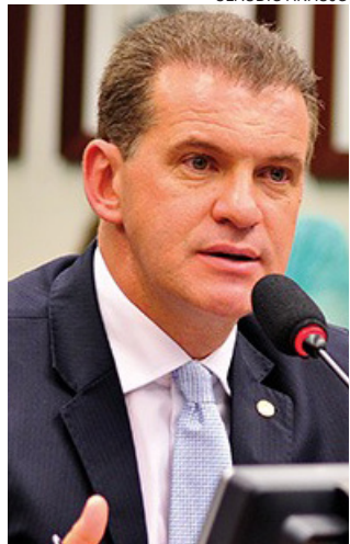
EVANDRO Roman continua no posto de deputado federal