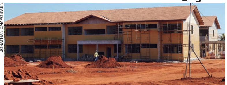
CENTRO Estadual de Educação Profissional de Diamante do Norte é uma das obras que já está em execução

Com a retomada dos CEEPs os jovens de suas regiões terão um acesso mais ágil ao mundo do trabalho. “A estrutura voltada somente aos cursos profissionais e técnicos privilegia a