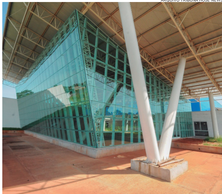
OBRA se arrasta por mais de uma década e até agora, não concluída, consumiu mais de R$ 11 milhões em recursos públicos

Os Tribunais de Contas do Estado (TCE-PR) e da União (TCU) atuarão de forma conjunta para estimular a conclusão de obras federais que estão paralisadas no Paraná. Levantamento recém-concluído apontou a existência de 228 obras federais paradas no estado, com investimento total de R$ 316 milhões. Elas representam 18,6% das 1.233 obras executadas com verba federal no Paraná e 11,4% do valor total, que soma R$ 2,76 bilhões.