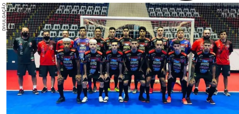
NA primeira fase a equipe da Afca terminou em 2º lugar no seu grupo e em 4º lugar na classificação geral conquistando assim a vaga direta as quartas de final