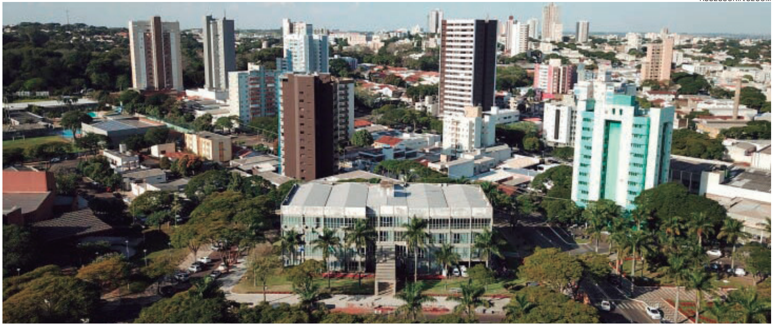
PREFEITURA começa a distribuir os cartões do programa às famílias inscritas no Cadastro Único, entre 1º/05/2019 e 30/04/2021

“Terão direito ao cartão do Bolsa Umuarama famílias com inscrição ativa e atualizada no Cadastro Único, entre 1º/05/2019 e 30/04/2021 referenciadas como de extrema pobreza (renda per capita de até R$ 89,00 mensais por pessoa)”, explicou a secretária municipal