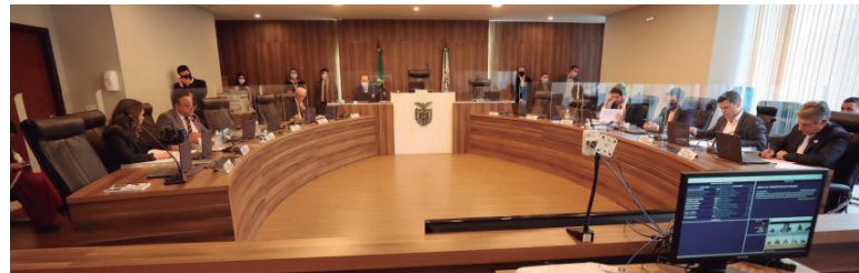
A discussão se arrastou por várias sessões da CCJ com o questionamento de que a proposta pode gerar despesas para o Executivo, o que é vedado