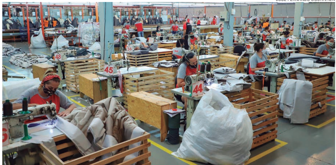
JOSÉ FERNANDO OGUERA/AEN

A alta no ano está amparada no crescimento da indústria geral (38.030), comércio, reparação de veículos automotores e motocicletas (35.280) e informação, comunicação e atividades financeiras, imobiliárias, profissionais e administrativas (29.469).