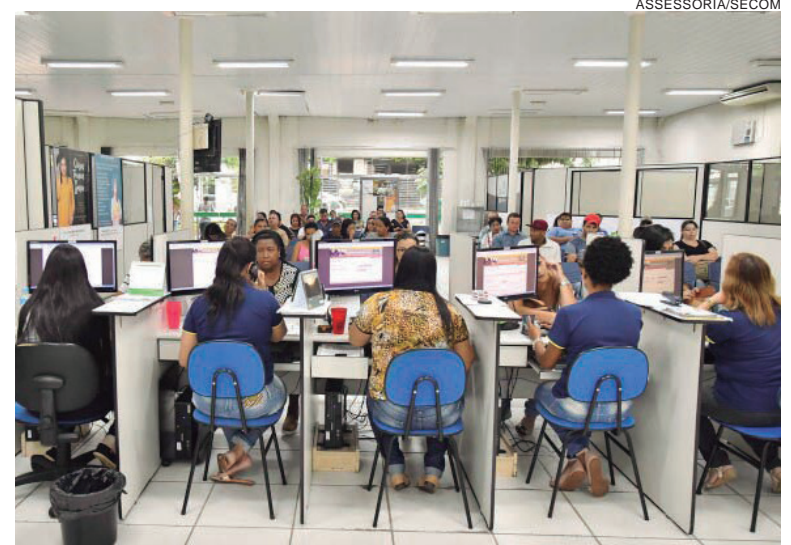
A medida, adotada durante a pandemia para reduzir aglomerações, a fim de prevenir o contágio do coronavírus, deixou de ser obrigatória