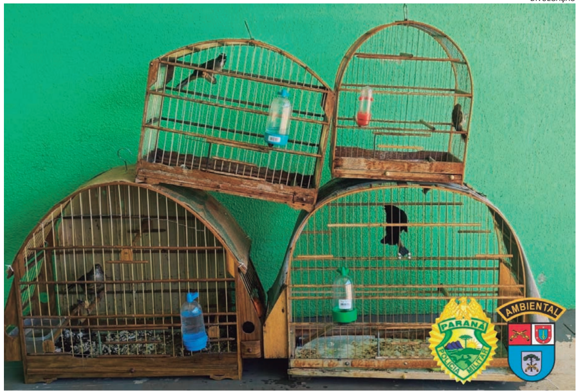
OPERAÇÃO recolheu 6 aves das espécies sabiá laranjeira, trinca ferro, pássaro preto, canário-terra, que são muito apreciadas pelos criadores pela beleza do canto

Algumas aves que estavam domesticadas e anilhadas foram deixadas com os criadores como fiel depositário. As demais foram avaliadas por médico veterinário e realizada a soltura em seu habitat natural. A operação teve o apoio da Polícia Científica que colheu informações para verificar a adulteração em uma anilha. Além das autuações administrativas, os infratores responderão criminalmente conforme artigo 29 da Lei Federal de Crimes Ambientais. Os Autos de Infrações Ambientais geraram R$ 38 mil em multas.